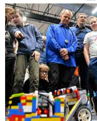
LEGO SUMO täies hoos.