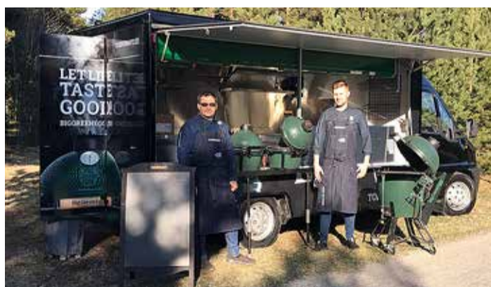
1. mail näitavad Toidunaudi kokad, kuidas "Rohelist muna" kasutada.

Elava tulega grillides saab toidu maitset ja teksturi muuta erinevaid meetodeid kasutades,