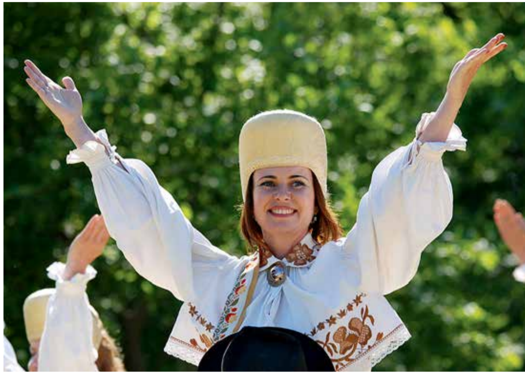
Rannarahvas oskab koos rõõmu tunda ja pidutseda.

Vaade ajalukku aitab meil mõista ja mõtestada meie kodupaiga ja meie kõigi tõelist ole-