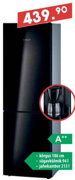
Külmik Bosch KGV36VB32S