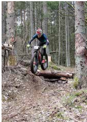
Nii suurest palgist ülesõit vajab julgust.