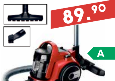
Tolmukotivaba tolmuimeja BGC 05AAA2