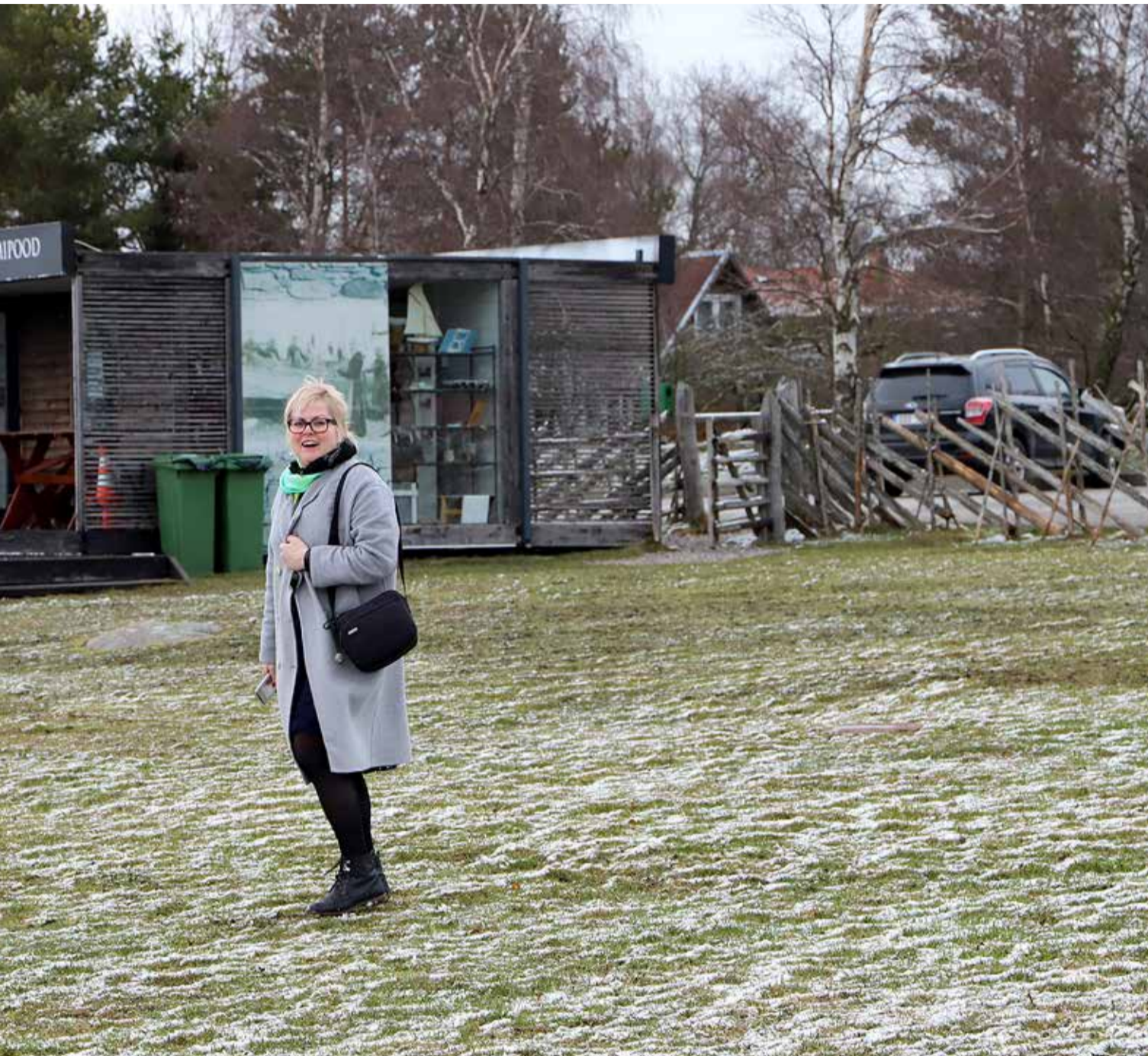
mõttes taga ajada, sest tegemisi valla peal on tal palju ja korruga.

mene jaatav vastus on tulnud Islandi ja Viimsi noorsoovahetuse korraldamiseks, mis on noortevolikogu projekt. Ettevalmistamisel on ka mitmed rahvusvahelised projektid, eelkõige koostöö erinevate valdkondade raames Puente Geniliga His-