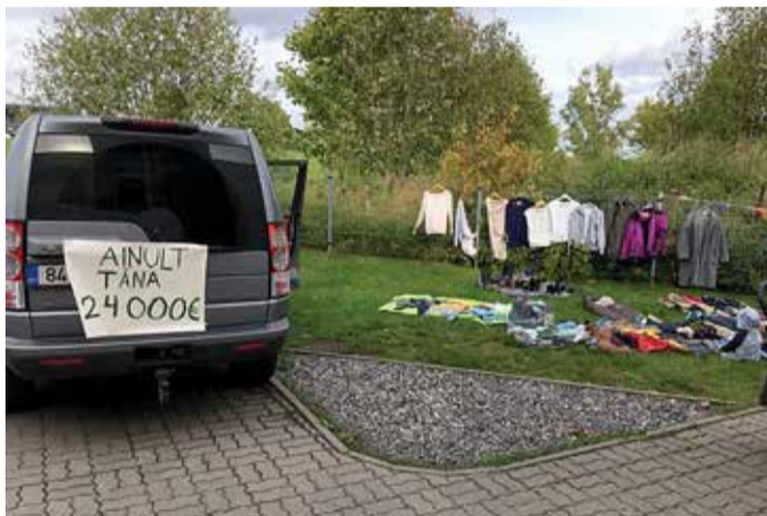
Garaažikalt saab kõike autost jalanõudeni.

de müügiga erinevate müügiportaalide kaudu," selgitab korraldaja.