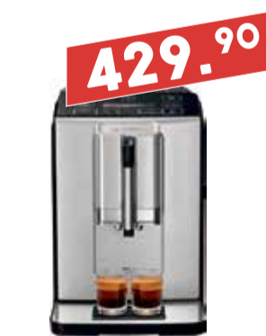
Täisautom. espressomasin Bosch TIS30321RW