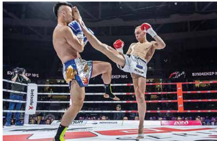
"Võtsin nurki ja tegin lööke," selgitab Astur.