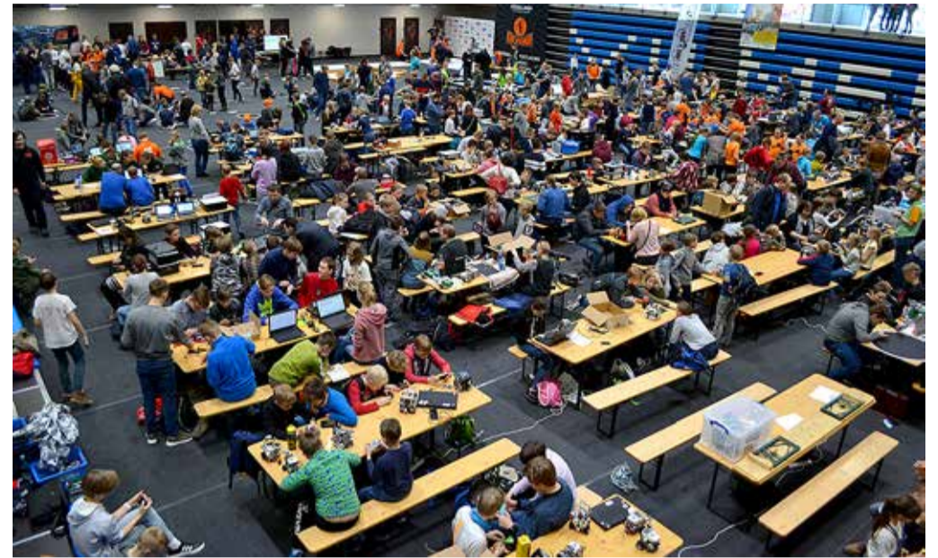
Eesti parimad robotikud meeskonnaalas robotitele viimast lihvi andmas.

ROBOMIKU LAHING 2019. 13. aprillil kogunesid Viimsi Karulaugu spordikeskusesse enam kui 650 õpilast ja üle saja juhendaja, et pidada maha robotikapidu.