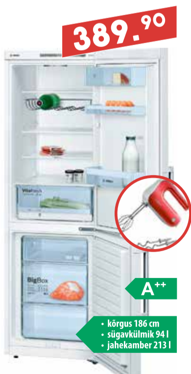
Külmik Bosch KGV36XW31