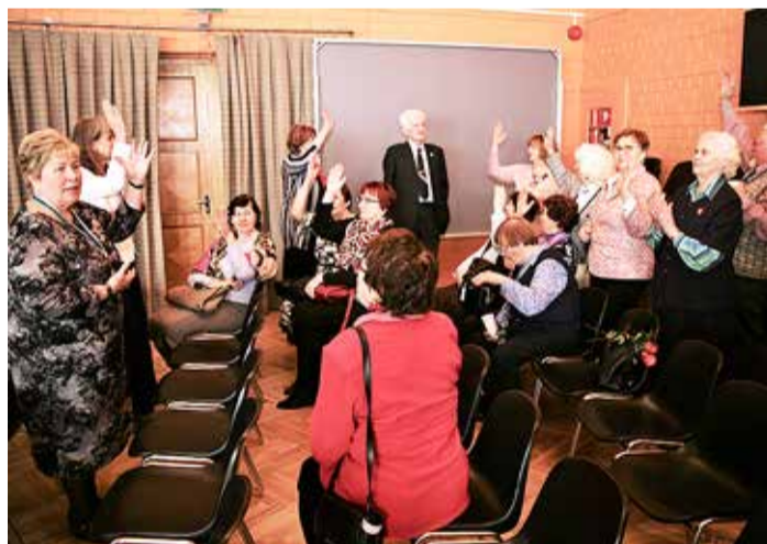
Volikogu valimine toimus ühehäälselt.

Edukalt on alanud koostöö hiljuti valitud Viimsi valla seenioride nõukojaga. Viimsi valla