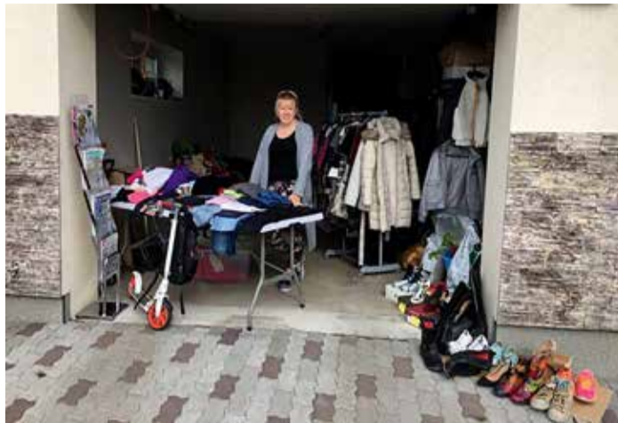
Hästi presenteeritud garaažikaup püüab huviliste silmapilke.

"Garaažimüük on hea võimalus kogunenud asjadest kiiresti vabaneda peaaesjalikult neile, kes soovivad oma elamises ajapikku kogunenud asjade arvelt otsustavalt ruumi teha ning kellel pole aega tegeleda asja-