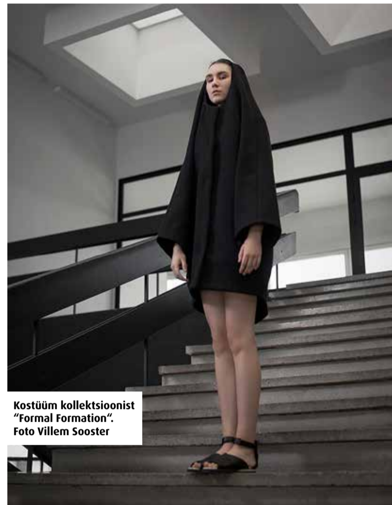
Kostüüm kollektsioonist “Formal Formation”.