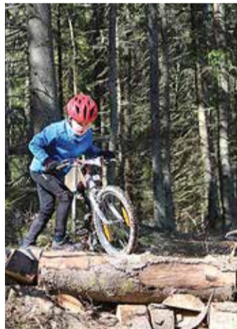
Igat takistust ei saagi ratta seljas läbida.