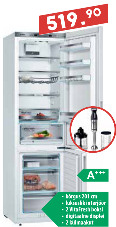
Külmik Bosch KGE39VW4A

* Kui ostate meilt Boschi külmiku enne 20. maid, saate valida tasuta kaupa 10% väärtuses ostetud Boschi külmiku hinnast.