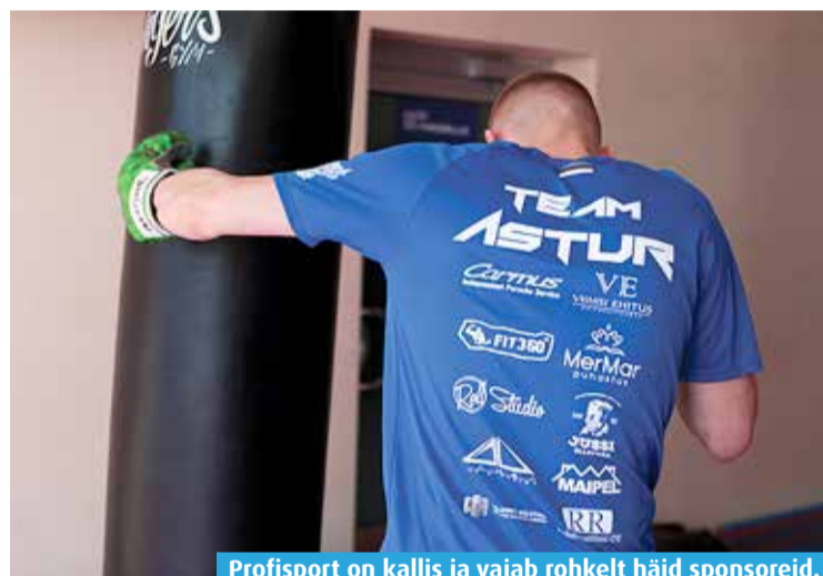
Profisport on kallis ja vajab rohkelt häid sponsoreid.