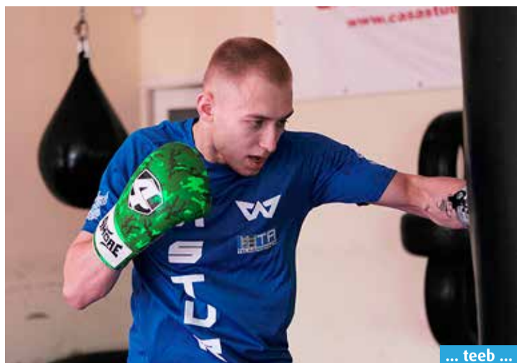
... teeb ...