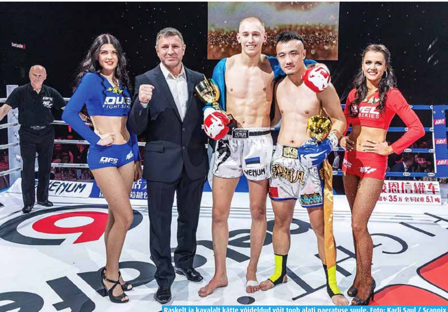
Raskelt ja kavalalt kätte võideldud võit toob alati naeratuse suule.