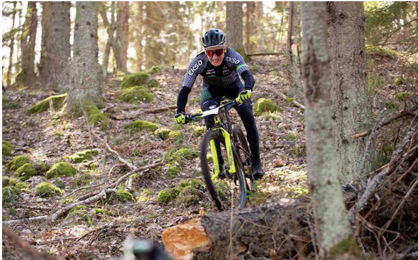
Laskumised loodusmaastikul ei ole just lihtsad.

Laste- ja noortesõidud tehtud, algasid viitstardid põhisoitud.