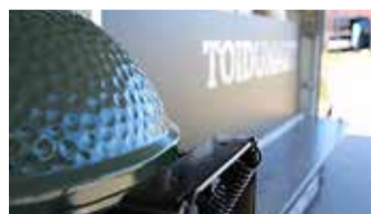
"Rohelise munaga" kohtud tasuta Hoovipeol.

2 Green Eggiga burgerite valmistamine on puhas rõõm!