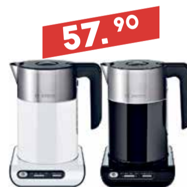
Veekeetja Bosch TWK 8611P/8613P