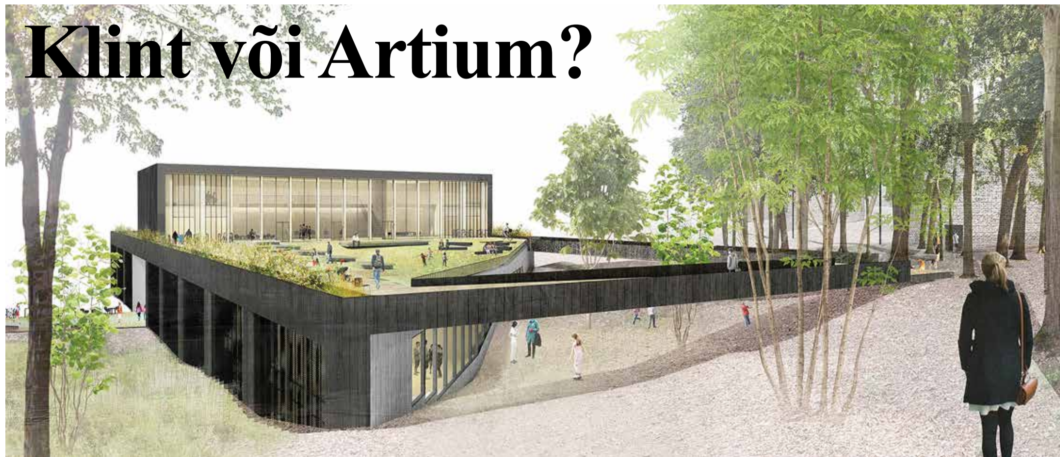
Viimsi uus haridus- ja kultuurikeskus toob 2021. aasta sügisest kokku loomingulised ja tegusad talendid igalt rindelt. Foto Kavakava