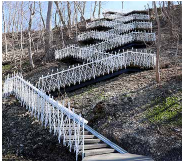
Trepajooksu tuleks harjutada iga päev.

Aasta oli 2017, kui Eesti Vabariigi 100. aasta-päevaks valmis Viimsi keskuse ning Pärnamäe ja Lubja külad ühendanud Põhjakonna trepp. 2. detsember 2017 oli päev, mil trepp üheskoos sportlikult avati. Pea sada viimilast oli kokku tulnud, et joosta aja peale uhiuuest trepist üles. Nende samade osalejate positiivne tagasiside ja tahe korrata võistlust algataski trepajooksu traditsiooni.