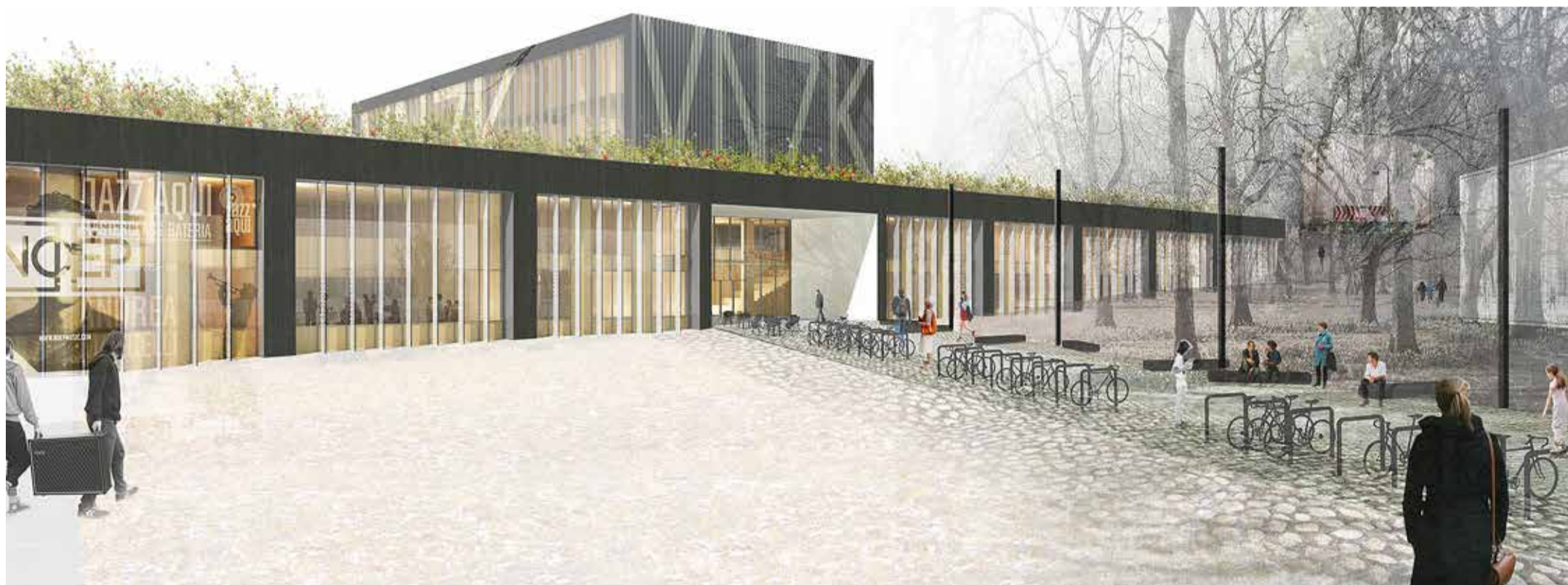
Mida enam tuleb Viimsisse noori, seda rohkem nad linnapildis ning kohalikus haridus- ja kultuurielus ka mõjule saavad. Uus noortele suunatud haridus- ja kultuurikeskus valmib 2021. aastal.