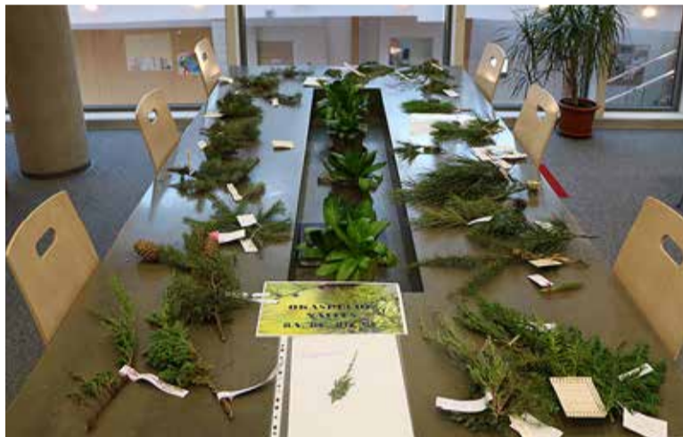
Okaspuude näitus Viimsi koolis.

klassi õpilased. Küpsetati Fairtrade toodetega küpsiseid ja valmistati banaanijäätit, millega said maustada nii õpilased kui ka kooli töötajad. Koolis on üleval kolm näitust: "Väärkas elu kõigile", "Sa oled, mida sööd" ja "Imeline shea-või".