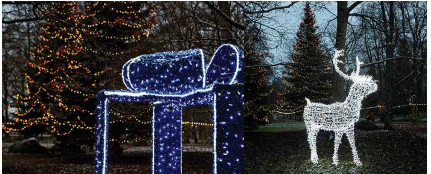
Tuledesära meelkitab viimsilasi mõisa parki.

Jõulumaa on maagiline koht, kus kohtuvad soojus, hoolivus ja tore rahvas. Veetmaks üht toredat päeva üksteise seltsis on Laidoneri pargi jõulumaale oodatud kõik huvilised. Päeva jooksul saab kuulda esinejaid, täita kõhu hea ja pare-