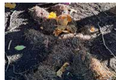
Okkapiisi tegemiseks läheb vaja palju okkaid, natuke käbisid ja lehti.

Töötajate rahulolu, vaimne tervis, stress ja kuidas toetada personali vaimset tervist, et nad läbi