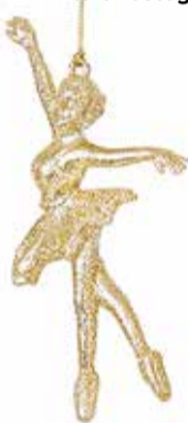
Kuuseehete valik pakub nii traditsioonilisi klaaskuule kui ka kauniit silledavaid minifiguure.

panna just sellise buketi, mis meelepärane tundub. Kaupluses on ka kauneid jõululikke dekoratiivseid kujusid ja palju muud.