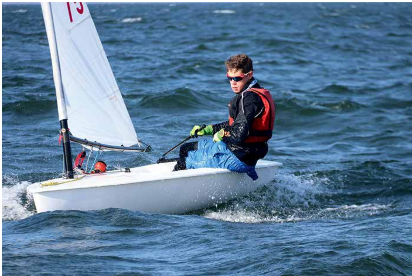
Martinile meeldib, et purjetades peab kasutama korraga nii mõistust kui ka jõudu.

sis, kuid enne seda oli parim tulemus Kuldseekli regati võit. Seal on lisaks purjetamisele kavas ka jooksmine ja ujumine. Eesti meistrivõistluste sarjas tulin ka Saaremaa regati võitjaks.