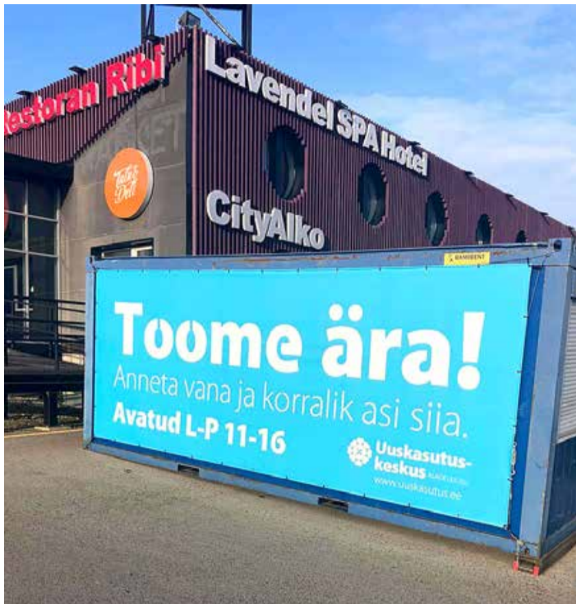
Uuskasutuskeskuse kogumiskonteiner Viimsi Marketi ja Lavendli poe vahelisel alal.