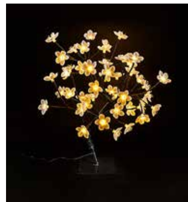
Traditsioonilise jõulupuul asemel võib kaunistada tuba korduvkasutatava valguspuuga.

Kui peres on lapsed või lapselapsed, siis on üheks armsaks võimaluseks teha jõulukaunistused koos nendega ise. Nii Koduekstra kui ka Selveri kaupluses on olemas suurepärane valik erinevaid materjale, mille kasutamisele seab piire vaid oma fantaasia. Pärlketid, mustri- lised paelad, erinevate kujudega kleebitavad dekoratsioonid – vaja läheb vaid pealehakkamist, kuid tulemus on tõeliselt omanäoline ja seda südamelähedasem ning erilisem.