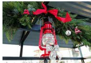
Jõuluehteis peatuses on rõõmsam bussi oodata.

Tal on hea meel, et juba möödunud aastal oli elanike tagasiside