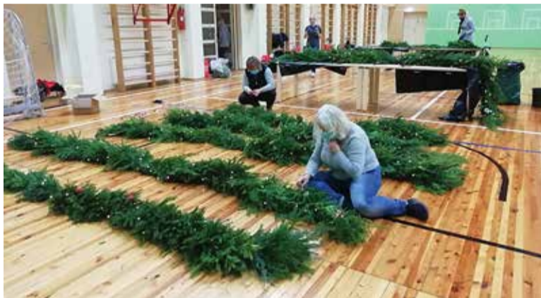
Nii valmisid vanikud bussipeatusesse.

“Idee sai alguse Püünsi külaseltsi ühest väljasõidust 2019. aastal, kus korjasime mõtteid, mida põnevad külas võiks ette võtta. Jõuludeks kuusevanikute punumise mõte tundus koheselt väga atraktiivne, sest seda on piisavalt lihtne teostada. Põhiline ressurss, mis selleks ettevõtmiseks kulub, on külaelanike initsiatiiv, pealehakkami-