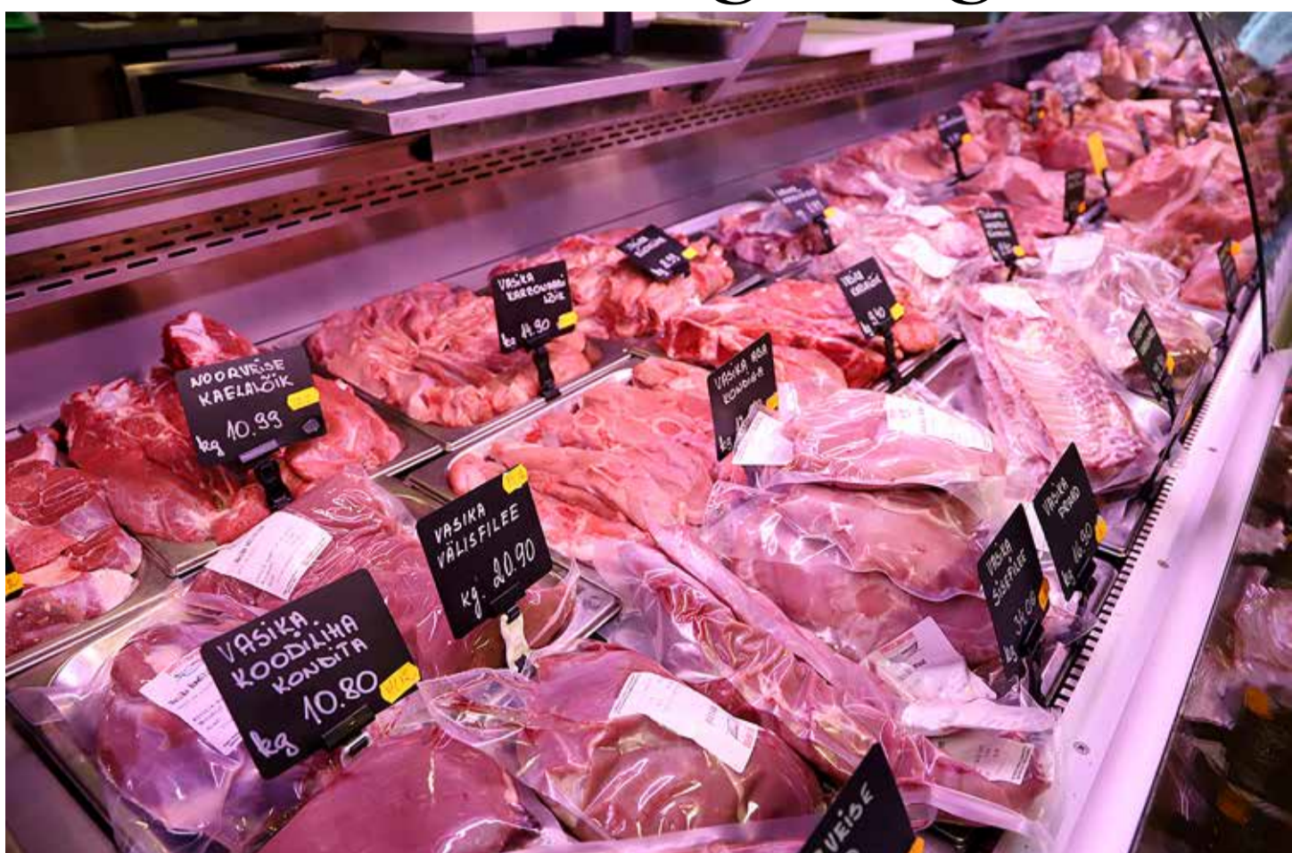
Lihapoes on valikut igale maitsele.