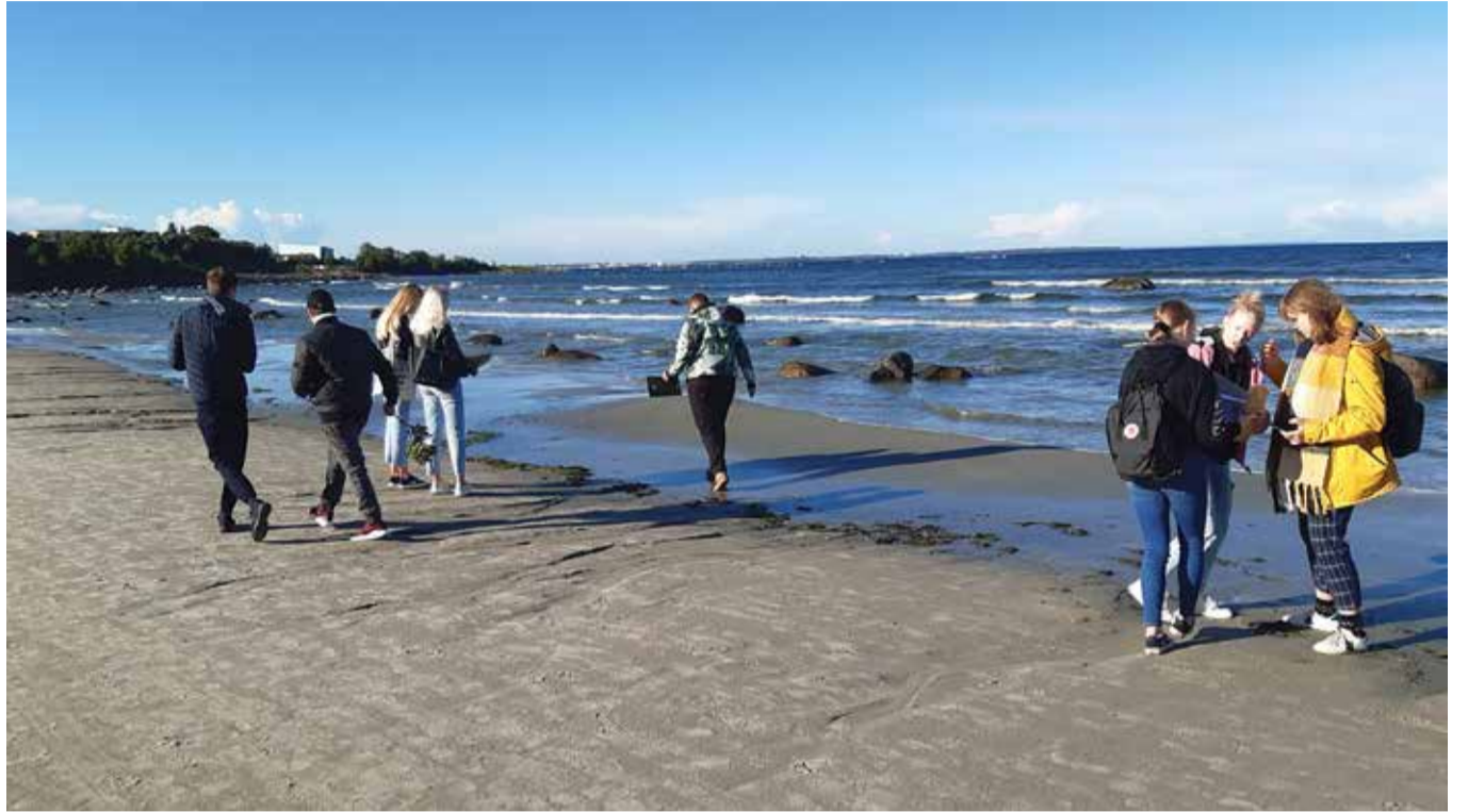
Tavapäraselt algas kooliaasta 8. klassidele õppekäiguga Haabneeme randa.

Viimsi koolis toimusid nädala jooksul teematunnid, kus vaadati teemakohaseid filme ja peeti arutelusid. Toimus videotund, kus 7., 8. ja 9. klasside õpilased said kuulata ÜRO pagulasagentuuri Balti regiooni juhi Kari Käsperi loengut "Kliima ja sundränne". Kodunduse tundides tutvustati õiglase kaubanduse märki Fairtrade ning selle märgiga tähistatud kaupade tootmistingimusi. Kõige agaramad Fairtrade toodete ostjad olid 6.e