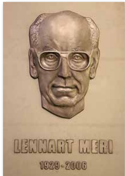
Fotol on EELK Viimsi Püha Jaakobi kiriku seinal asuv bareljeef Lennart Merist.

Lennart Meri preemiat saab taotleda mõnel humanitaarteaduste õppekaval kõrgharidust omandav bakalaureuse-, magistri- või doktoriõppe üliõpilane erialase uurimistöö kirjutamise eest või humanitaarteaduste