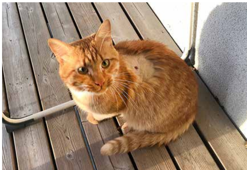
Kassi ootab ees kuuli väljaopereerimine.

Juhtumeid, kus lindude organismist leitakse haavleid, võime nimetada suure tõenäosusega jahipraakideks. Kuigi üldjuhul on jahimehed seadusekuulekad ja peavad heast jahi tavast kinni, võib ka korralikel jahimeestel ette tulla jahipraaki.