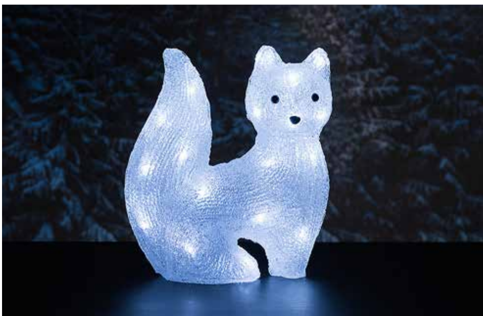
LED-tulukestega valguselementidest saab luua tõelise muinasjutumaa.

Jõuluhõngu saab luua ka taimede ja neist loodud kompositsioonide abil. Kaupluses Õis on saadaval kauneid lahendusi, mis oma värvide ja iluga rõõmustavad iga vaatajat. Muidugi saab lasta kokku