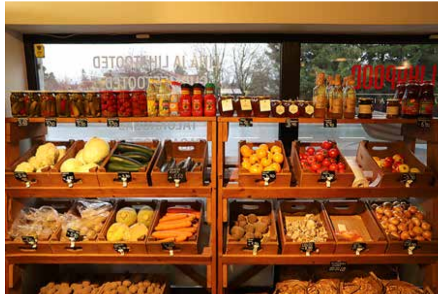
Lihapoes müüakse ka värsked köögiviljad ja muud kraami.