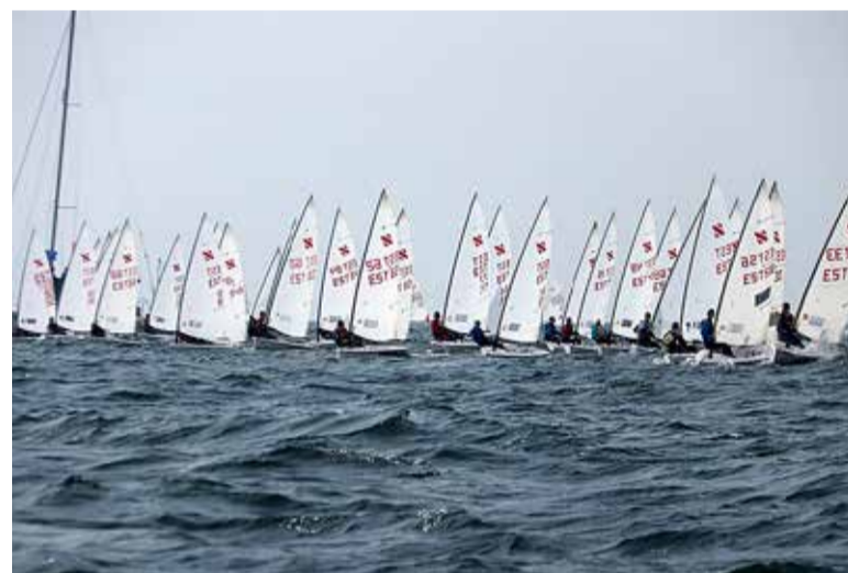
Martini suurim saavutus on Eesti meistriks tulek Zoom 8 klassis.

Tavaliselt jõuan kõik õpitud, kuid väga palju aega üle ei jää ning vahel jäävad õppimised päris hilisele õhtule. Koolist peab puuduma ainult siis, kui on võistlused, ning võib juhtuda, et pärast võistlusi ei jõua kõike kohe tehtud. Aga kuna