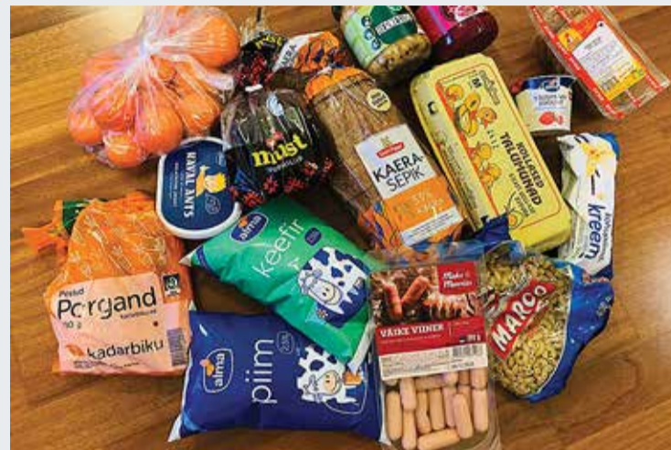
Pakk sisaldab enamlevinud toiduaineid.

Sel nädalal said koroonaviiruse leviku tõttu distantsõppele jäänud Haabneeme kooli õpilased toidupakid.