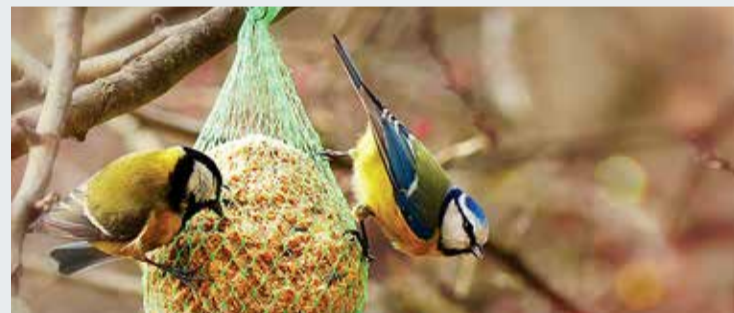
Kui võrk on tühjaks söödud, tuleb see prügikasti visata.

Taaskord on käte jõudnud aasta aeg, mil kollased rasvatihased meile silma jäävad ja oma lauluga meenutavad, et nemandki tahavad enne suurt talvitumist süüa.