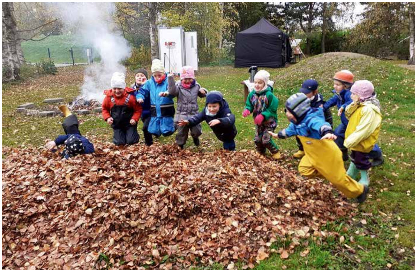
Lehtedes on õnneks pehme maandumine.