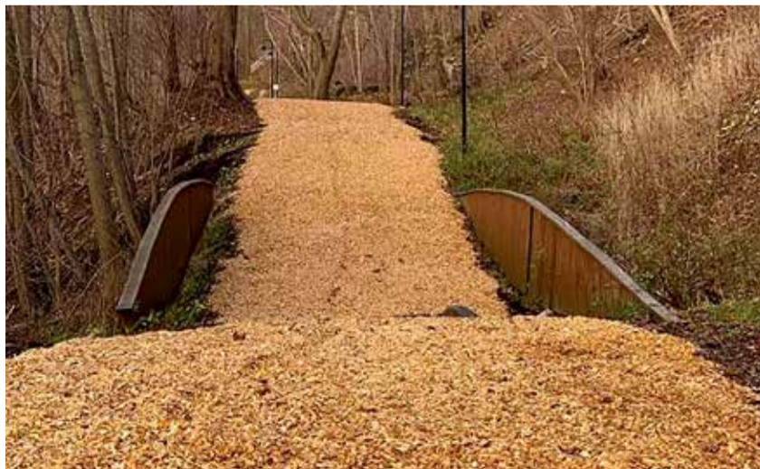
Karulaugu terviserajal teostas tööd Puiduhake.com OÜ.

Kogu terviseraja pikkus on 2,6 km, mis sisaldab 0,7 km pikkust kaht väikesemat ringi (Karulaugu kooli ning Päikseratta lasteaia taga), 1,2 km pikkust keskmist ringi (Viimsi kooli taga) ning 0,7 km väikest ringi (Pargi tee poolsele terviseraja osas).