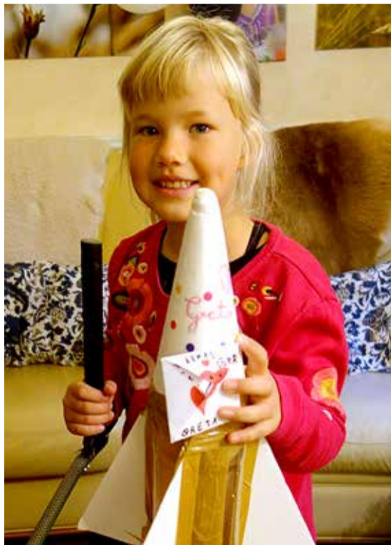
Leiutamine paneb Gretal silmad särama.