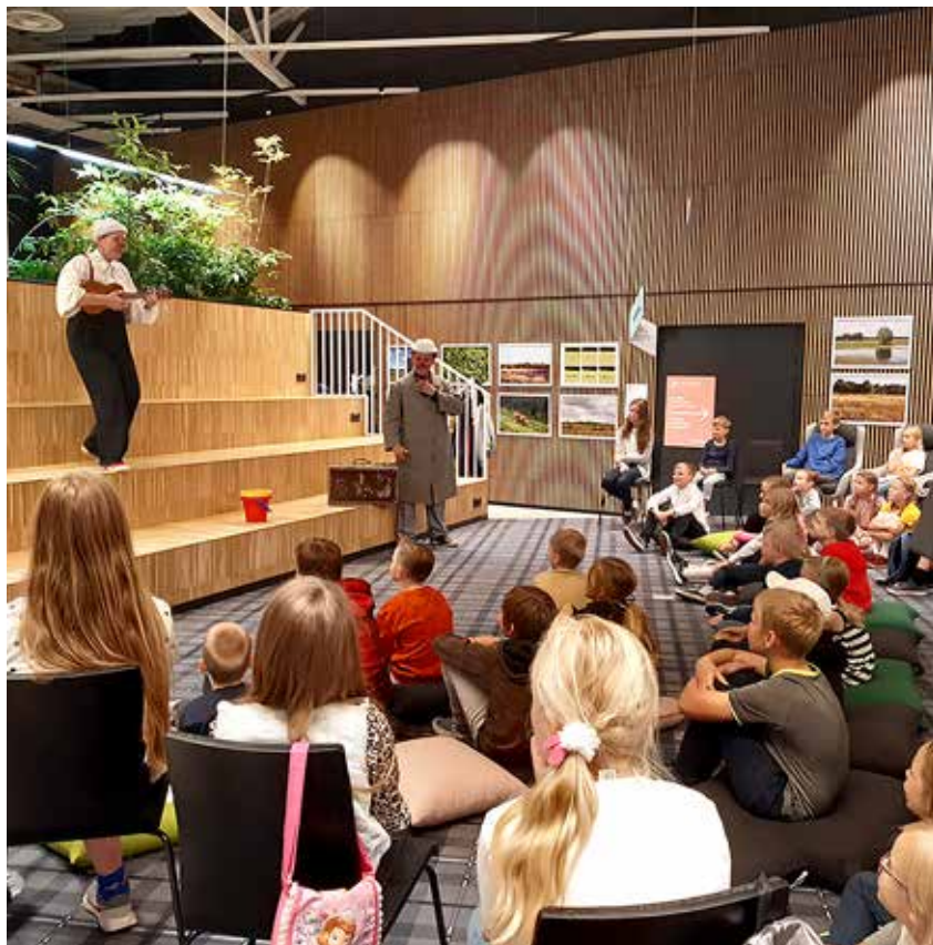
Suvelugemise lõpupidu on lastele oodatud sündmus.

Nagu traditsiooniks on muutunud suvelugemine kui sündmus, on traditsiooniks muutunud ka lõpupidu, et jagada tublimale lugejatele tunnustust ja auhindu. Kui tavaliselt on peole pääsenud need, kes on läbi lugenud vähemalt viis raamatut ning vastanud raamatu kohta käivatele küsimustele, siis seekord tuli arvestada peole osalejate arvu piiranguid, mis oli nii mõne-