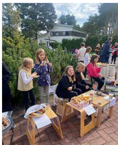
Tüüplised laadalisel müüvad teistele ja naudivad ise.

LAAT Septembri esimesel pühapäeval kogusid kümned Laiaküla noored Käära tee ringile, et traditsioonilisel magusalaadal isevalmistatud küpsetiste ja jookidega taskuraha teenida. Edukamad noored ettevõtjad kogusid isegi üle 50 euro.