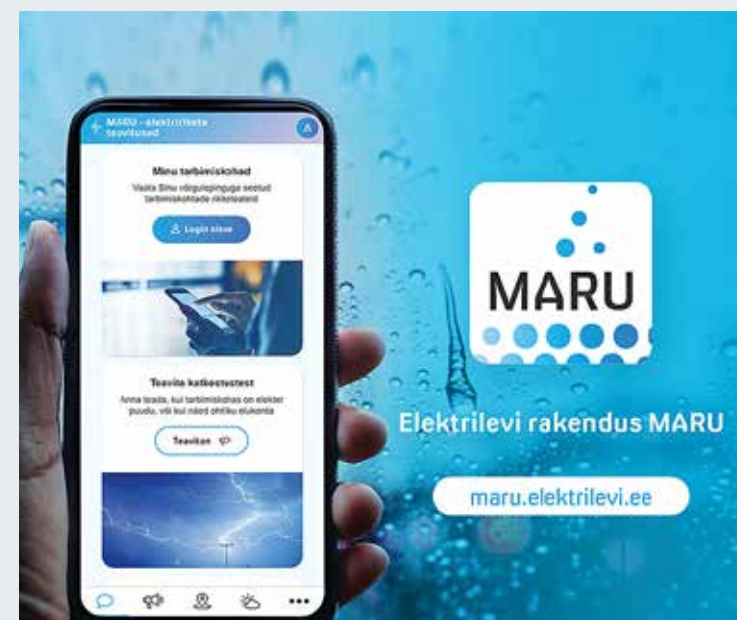
Esialgul on MARU kättesaadav veebilehel https://maru.elektrilevi.ee/ .

Eesti elanike elektrivarustuse eest hea seisev Elektrilevi sai valmis uude rakendusega MARU. Tegemist on keskkonnaga, mis aitab kasutajatel mugavalt jõuda kiireloomulise infoedastusega võrguettevõteteni, eriti tormide ajal. Rakendus on kättesaadav Elektrilevi veebilehel elektrilevi.ee/maru .