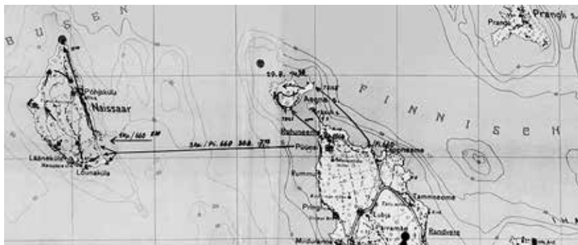
Kaardil on kujutatud Aegna ja Naissaare hõivamist Saksa vägede poolt 1941. aasta augustis.

Viimsi gümnaasiumi vilistlane, Tartu Ülikooli ajaloo ja arheoloogia instituudi üliõpilane