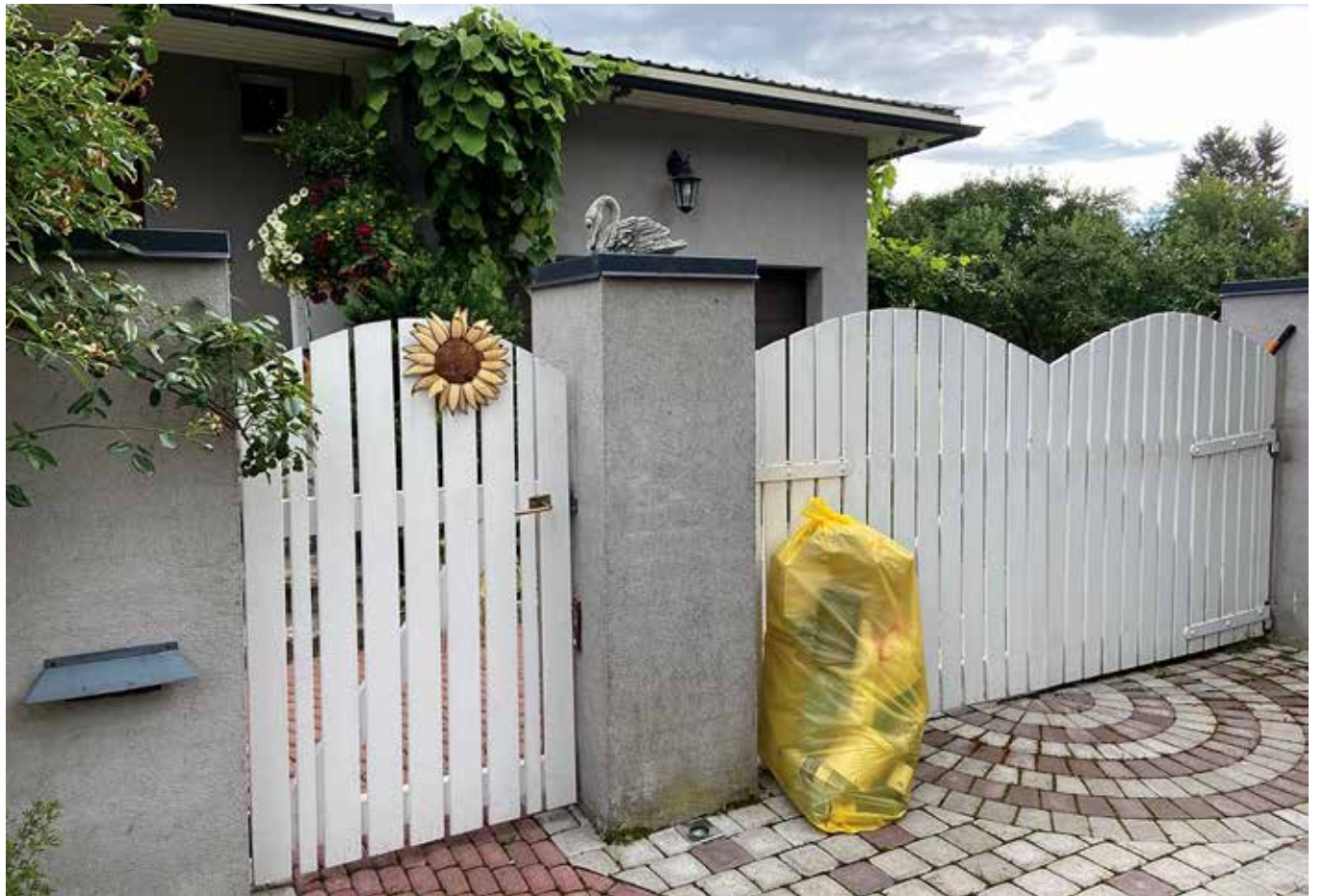
Äraveopäeval tuleb pakendikott asetada aia taha või aias nähtavale kohale.

Pakendikotti ei tohi panna ohtlike ainete pakendeid (nt liimi-, värvi- ja lahustitepakendid) ning aerosoolpakendid (nt õhuvärskendaja, juukselaki või vahukoore