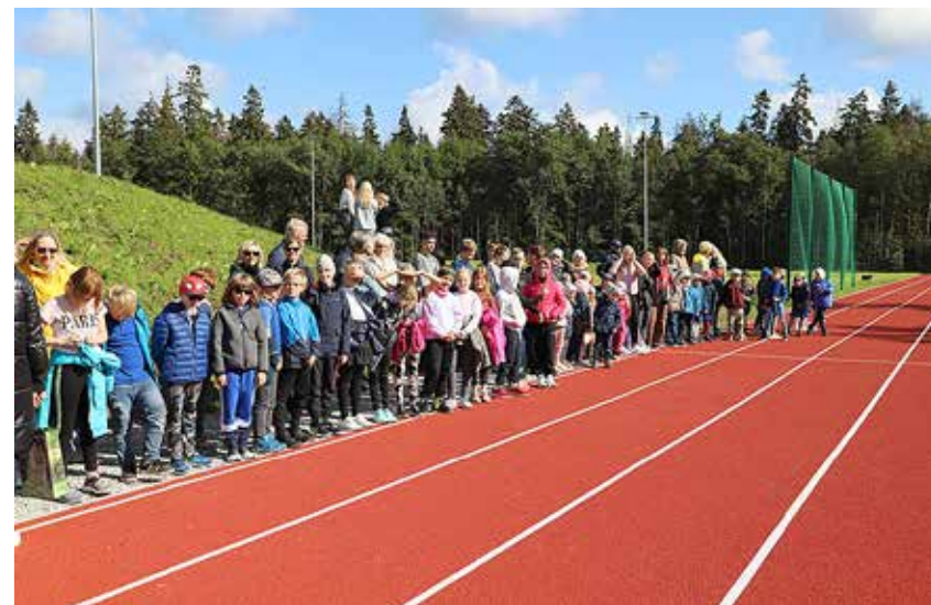
Möödunud reedel avati Püünsi kooli uus staadion.

Avamisüritusel kõnelesid vallavalitsuse esindajad, Püünsi koolijuht ja kohalikud spordikultuuri edendajad. Meeleolukate tantsude ja lauludega rõõmustasid kohaletulnuid Püünsi lapsed. Üritusele pandi sportlik punkt teatejooksudega, milles võitsid omavahel mõõtu Püünsi kooli 3. klassi võistkond ja vallavalitsuse võistkond. Pingeline võistlus lõppes sõbraliku viigiga.