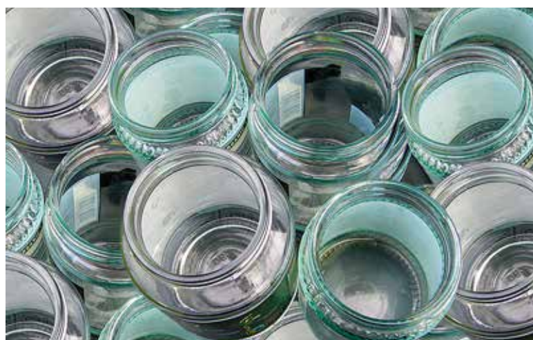
Klaaspurke ja -pudeleid on mõistlik teistest pakendijäätmetest eraldi koguda, et neid oleks lihtsam uuesti ringlusesse saata.

Lisaks EPR-i klaasikonteineritele on teiste organisatsioonide avalikud pakendipunktid leitavad https://bit.ly/viimsi-pakendipunktid .