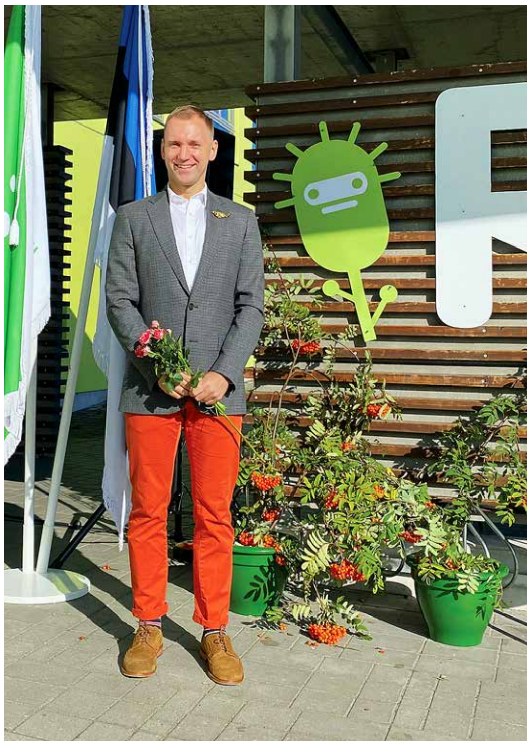
Randvere koolimaja ees – uus õppeaasta, uued väljakutsed ja kindlasti ka võidud.

Tema sõnul on Randveres olemas nii teadmised kui ka piisavalt head ruumilised võimalused, samuti ühtehoidev koolipere. Värsket juhti inspireerib väga kujundava hindamise temaatika, sest