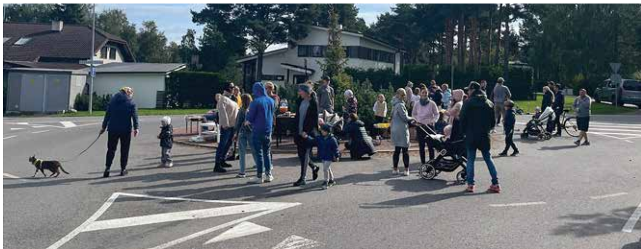
Laiaküla magusalaat on toimunud juba 13 aastat.