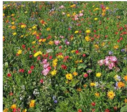
Lillemurus kasvab 14 erinevat põllulille.

Kes pole veel lillemuru avastanud, siis on kindlasti väärt mõte mõnel õhtul või nädalavahetusel väike jalutuskäik ette võtta ja värvikirevad õied oma silmaga üle vaadata.