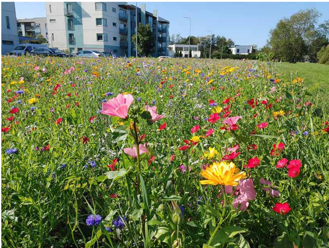
Lillemuru lisab sügisesse röömsaid ja kirkaid värve.