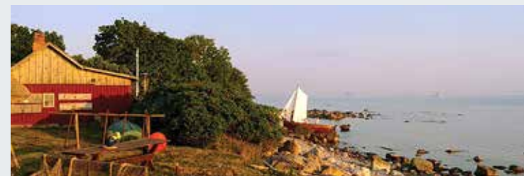
Muuseumi kaasajastamine võiks ühtlasi anda impulsi kogukonnatunde kasvatamiseks.

SA Rannarahva Muuseum ja Eesti Arhitektide Liit kuulutasid välja arhitektuurivõistluse, mille eesmärk on leida Viimsi vabaõhumuuseumi külastushoonele sobivaim arhitektuurilahendus.