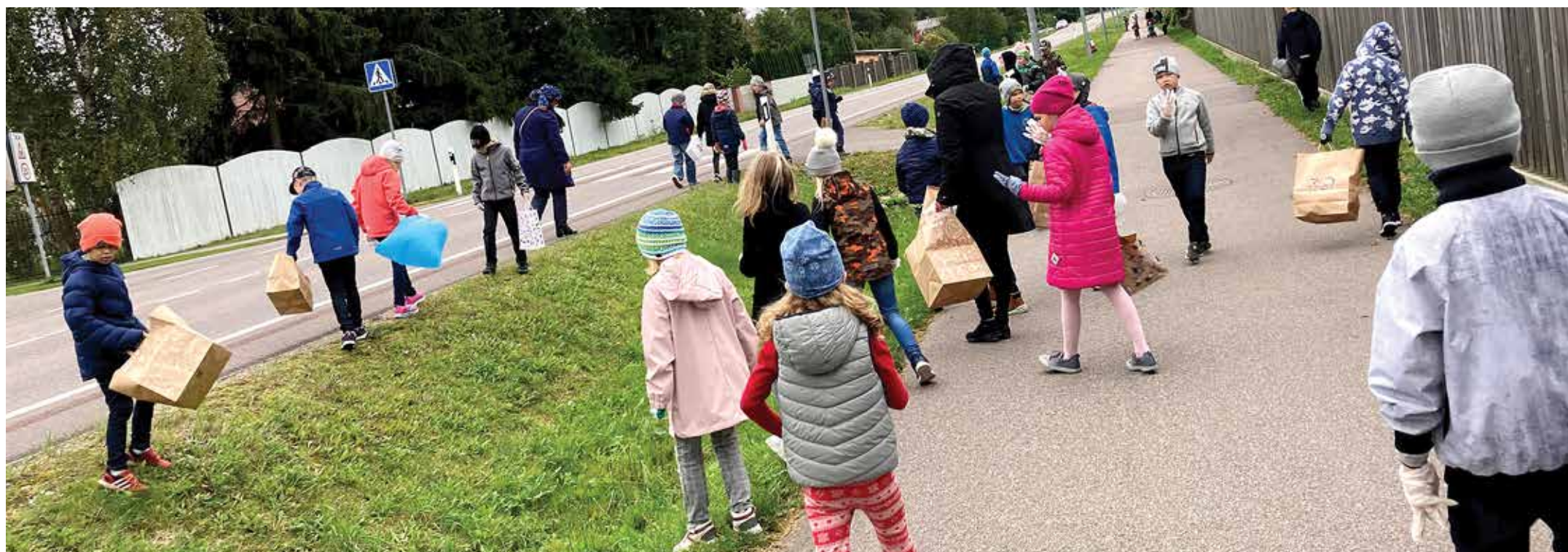
Randvere lapsed oma külatänavat koristamas.