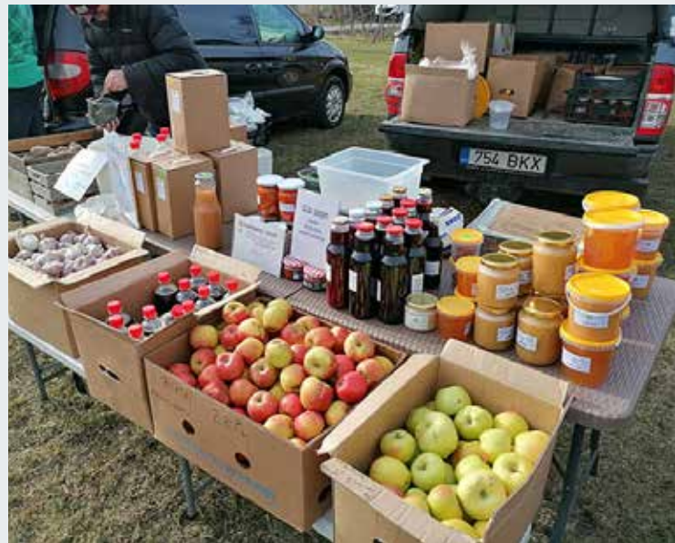
Metsakasti OTT-il on ainult värsked ja väärt kaup.

OTT ehk otse tootjalt tarbijale kaubakohting on kogukondlik algatus, mis annab kohalikele elanikele võimaluse osta head ja tervisliku toidukaupa otse toidu tootjalt või kasvatajalt. Vahendajaid ei ole, impordikaupa ei pakuta.