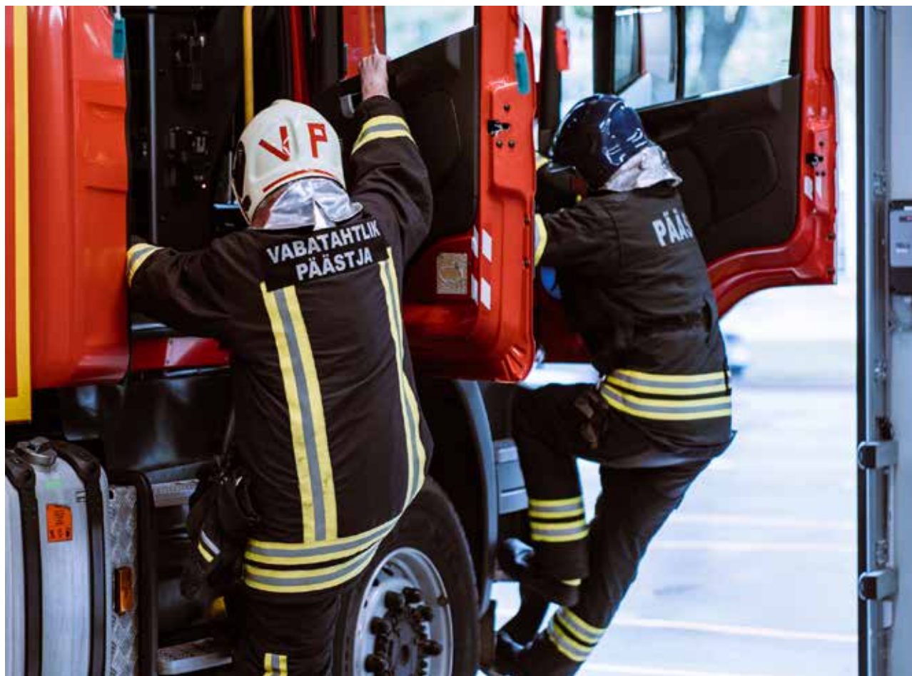
Vabatahtliku päästjana saab panustada kogukonna turvatundesse.

VABATAHTLIK TÖÖ Tänapäeval on vabatahtlikud päästekomandod väga suureks abiks kutselistele komandodele – seda nii väljakutsetele reageerimisel kui ka ennetustöö tegemisel.