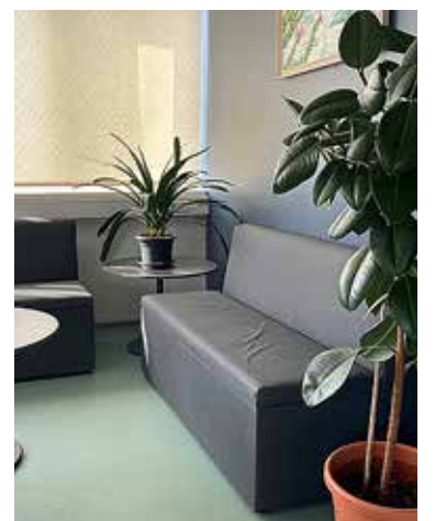
Randvere päevakeskus.

Ta julgustab päevakeskusesse pöörduma kõiki, ka neid, kellel juba on iseenda või oma lähedase toimetuleku osas küsimusi. Hoolekandekeskus ei ole ju toeks mitte pelgalt teenuse saajale, vaid abistab kaudset kogu peret – eakatele