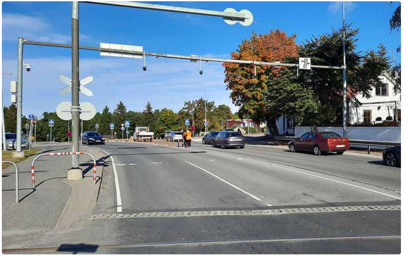
Liiklussageduse loenduri paigaldus.

Nädalate lõikes tuleb püsiloendus-punktide andmete põhjal selgelt välja ka COVID-19 mõju liiklusele. Aastal 2020, eriolukorra ajal, langes liiklussagedus oluliselt ning ka 2021 varakevadel oli liiklussagedus tavapärasega võrreldes mõnevõrra madalam. Kui Viimsi-Rand-