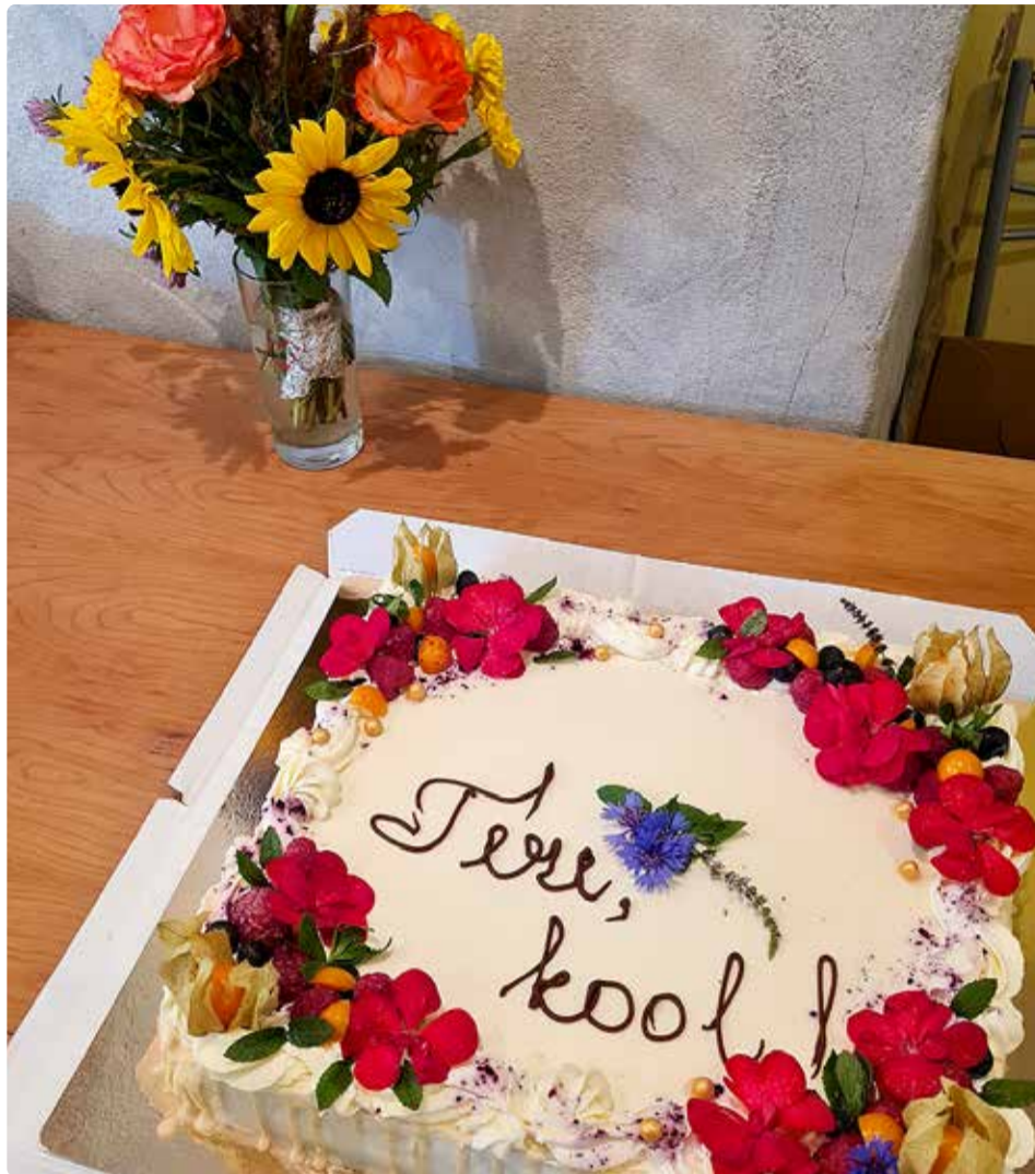
Prangli põhi- kooli 1. septem- bri kook.

damise süsteemi Arno aadressil piksel.ee/arno/viimsi ning esitada koolimineku avaldus. Süsteem arvestab koolikoha määramisel rahvastikuregistri järgse elukoha lähedust koolile, õdede-vendade olemasolu samas koolis ning võimalusel lapsevanema eelistust. Arnos on võimalik lisada kommentaaride lahtrisse lapse kohta infot, mida komisjon peaks vanema arvates teadma. Klasse komplekteerivad koolid pärast seda, kui on selgunud 1. klassi laste nimekiri. Võimalusel arvestatakse erisoove,