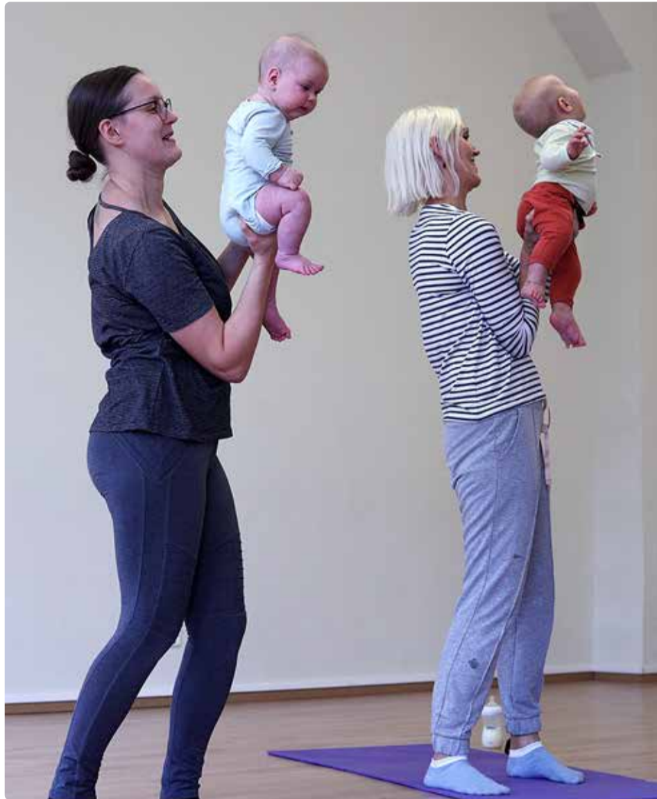
Beebid harjutamas istumist emal käel.

Beebisid ootame võimlemistundidesse alates 6. elunädalast. Bee-