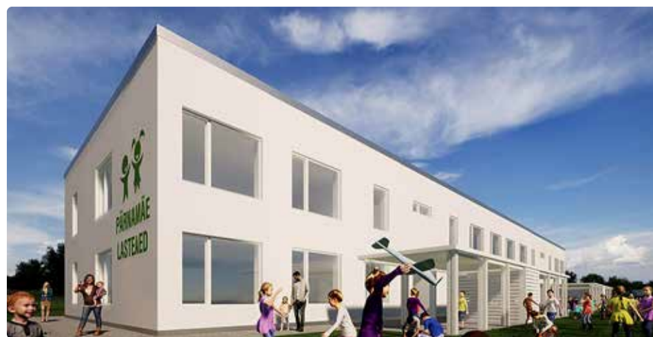
Nii peaks Pärnamäe lasteaed valminult välja nägema. Praeguseks on majakarp juba püsti.