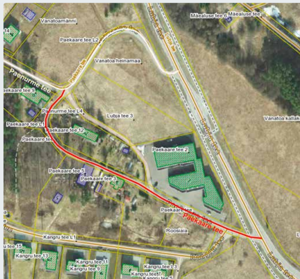
Paekaare tee liikluspinna ja terviktee uus ruumikuju.