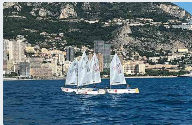
Eesti noored Monacos võistlemas.