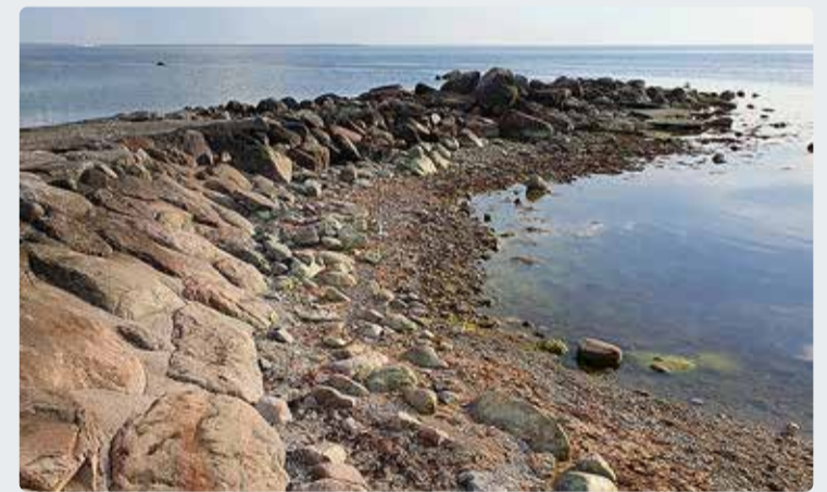
Suurevälja muul.