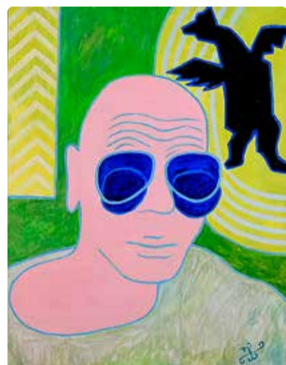
Autoportree “Läbi värviliste prillide”.

Viimsi kunstikooli galeriis avatava värvika näituse algseks pealkirjaks pidi esmalt saama “Tähdusmaastikud”, sest seos maastikuga ja vahetu looduskogemus on Urmasele nii hingepide kui ka energiaallikas. Ta nime-