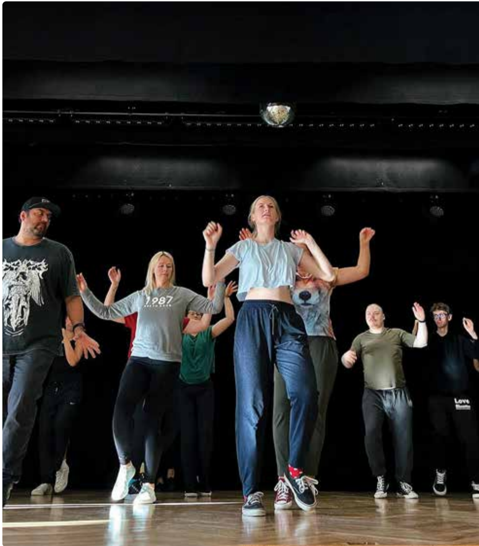
Proovid suureks sündmuseks on täies hoos käimas.

Lisaks on Viimsi huvikeskuse saalis nüüdseks üleval uus valguspark, seega galakontsert ja Viimsi muusikaliteatri etendused saavad olema veelgi uhkemad ja ägedamad kui varem.