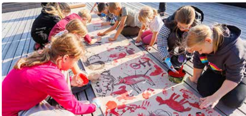
Kohatasu muudatus on oluline, et tagada jätkuvalt kvaliteetset ning laste ja vanemate ootustele vastavat teenust.

ning laste ja vanemate ootustele vastavat teenust. “Viimsi valla lasteaiade ja -hoidude teenusele on lapsevanematelt väga hea tagasiside ja seda kõrget taset soovime me hoida ning säilitada. Tasude muudatus on vajalik, sest üldise hindade kallinemise kontekstis ei ole seniste tasudega võimalik teenust vajalikul moel pakkuda ja arendada,” selgitas Katrin Markii.