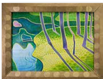
“Kokadera – samblatempel”.