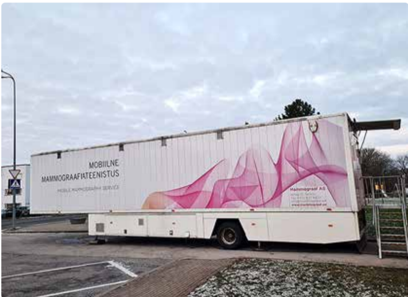
Mammograafiabuss on Viimsis 25.–29. novembrini aadressil Nelgi tee 1.

Silva Sildmaa rahvatervise peaspetsialist