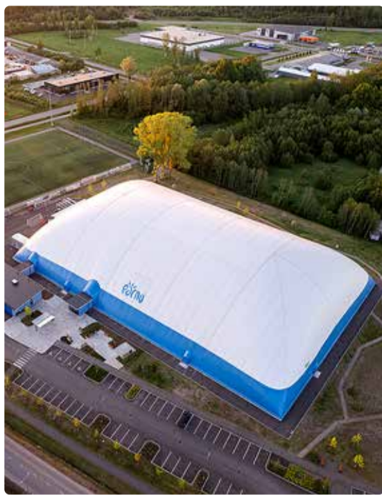
Pärnu jalgpallihall.

Kunstmuruväljaku täismõõtmel on 100 x 64 meetrit. Halli on rajatud ka nelja rajaga tartaankattega jooksusirge, mida saab kasutada mitmesugusteks tegevusteks. Sportlastele on kohapeal neli riietus- ja kaks duširuumi. Pealtvaatajate jaoks on olemas seisukohad, istekohad puuduvad.