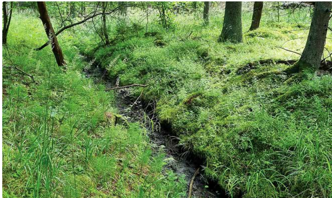
Kuivenduskraav Rohuneeme maastikukaitsealal.