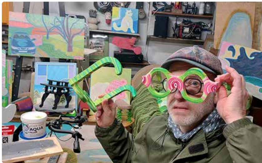
Urmase maastikud on vaatajasõbralikud ja lapsemeelsed.

tab neid ise ka sugestiivseteks maastikeks ja teatav sisendusjõud neis teostis on. Või siis hoopis endasse neelav jõud – Urmas oli varem tegev keraamikuna, nii et ka tema maalides on tajutav vormide voolimine ja voolamine, mis võib vaataja endasse mässida. Kui sukelduda merelainetes, siis tungib laine-tustunne ju mõneti meie kehadessegi?