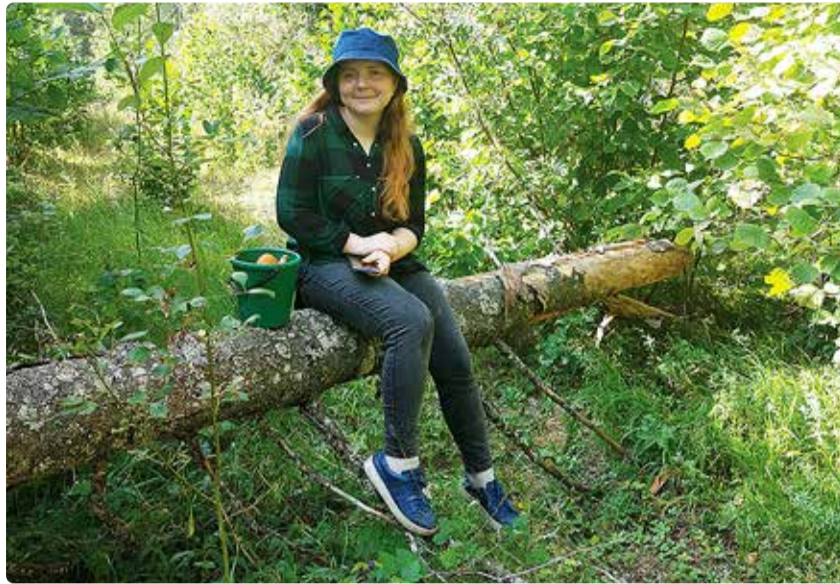
Kui ainus rada koduni viib näiteks läbi naabrile kuuluva metsa, tasub temaga kokku leppida ja sellele teele servituut seada. Naabril pole õigust sel juhul ligipääsu koduni langetatud puude või aiaga takistada.

Kui servituut on tehtud konkreetse isiku kasuks, siis on tegemist isikliku servituudiga. See tähendab, et ainult konkreetne isik saab servituudis nimetatud õigust kasutada. Näiteks saab anda konkreetsele isikule õiguse korjata kinnisasjalt õunu vms. Tih-