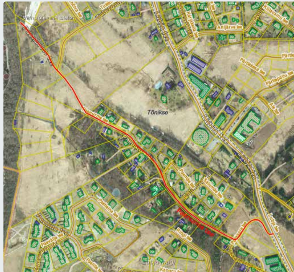
Paenurme tee liikluspinna ja terviktee uus ruumikuju. Aluskaardid: Maa-amet

Lubja küla, Paenurme tee ja Paekaare tee liikluspindade ja tervikteede ruumikujude muutmine (vt joonised 1 ja 2). Vt lisainfo Viimsi valla kodulehel www.viimsi-vald.ee/kohanimi .