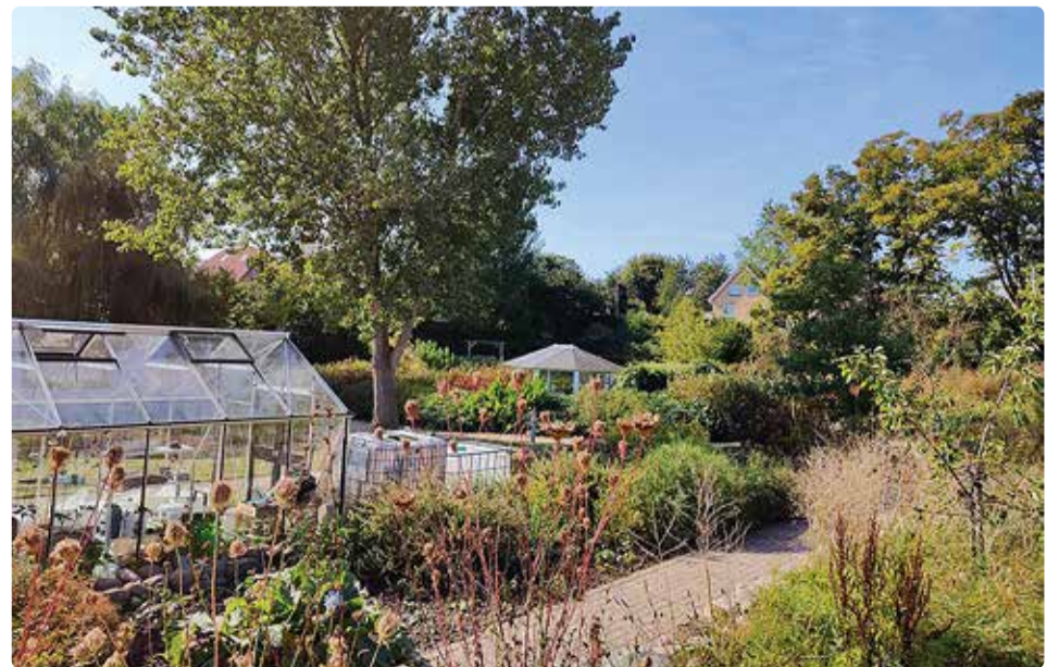
Soovi korral saavad asukad teha aiatöid.

riumiga loomas tegevuskava olukorra parandamiseks. See sisaldab endas ka kogukondlike kokkuleppeid (kuhu on kaasatud ka eraettevõtted) alaealiste alkoholitarbimise vähendamiseks. Uuringud on näidanud, et kui peres tarbivad vanemad alkoholi ja pakuvad seda ka oma lastele ning aktsepteerivad noorte alkoholiga pidusid, siis nende lapsed tarbivad rohkem alkoholi. Samas peredes, kus vanemad veedavad rohkem aega oma lastega, teavad nende sõpru ja sõprade peresid, tunnevad huvi, millega nende lapsed tegelevad, ja seavad selgeid piire alkoholi tarbimisele, on viimast vähem. See on huvitav fakt, sest Eestiski on väga levinud arusaam, et las laps pigem tarbib alkoholi kodus oma vanemate silme all kui väljaspool kodu. Kindlasti tasuks vanematel mõelda, kas ja mis vanusest on ikkagi sobiv lapsele alkoholi pakkuda.