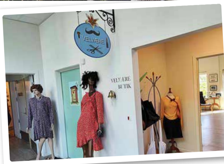
Linnaku elanikele on avatud terve kaubatanav.