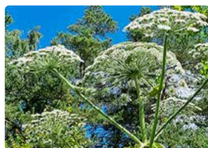
Sosnovski karuputke õisik. Seda invasiivset võõrliiki on juba Rohuneeme MKA-l üksikutes kohtades leitud. Trassiraiega kaasneb oht võõrliike levitada ja nende levilat laiendada.

Kuivendamine tähendab suure tõenäosusega sanglepa ja kase järelkasvu vähenemist ning kuuse oma suurenemist. Säilinud lodu- ja sooliigid kaovad lõplikult ning asenduvad kodusoo- ja arumetsa taimeliikidega. Kuivemad metsad tähendavad ka langust kodumaiste tiguude ja kahepaiksete arvukuses, aga ka putukate liigirikkuses. Suureneks ka vanade puude suurem ning metsad “võsastuksid” rohkem.