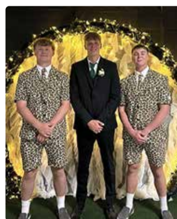
Vahetuspere ja koolikaaslased võtsid loo autori hästi vastu, kaatses teda igale poole.