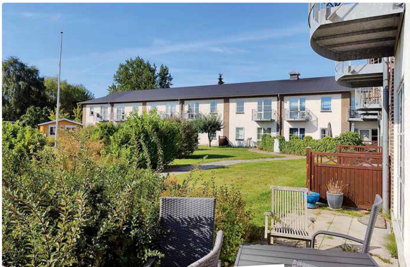
Linnak näeb välja pigem nagu puhkekodu.

Täna on Gentoftes omavalitsus koos Taani terviseministree-