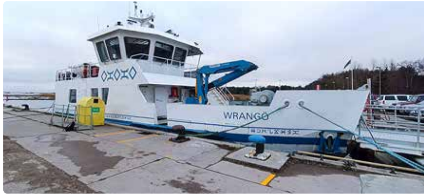
Reisilaev Wrangö Kelnase sadamas.

Abivallavanema sõnul on OÜ Spinnaker kogenud teenusepakkuja, kes on