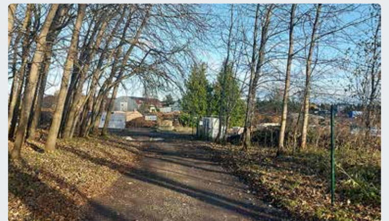
Praegu katab Kannikese teed kruus.