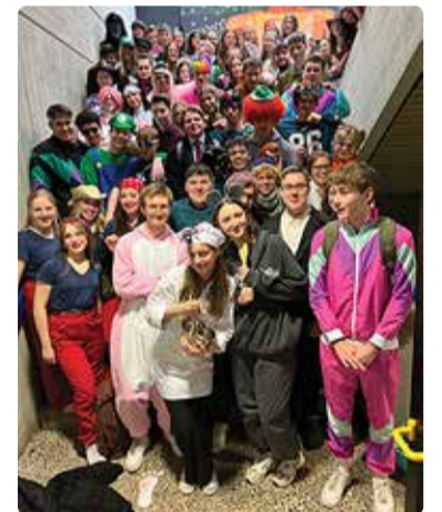
Vahetuseõpilaseks saades võid saada endale sõbrad kogu eluks.

le ning üldiselt haritumaks. Täna Viimsi valda ja kõiki teisi, kes mu vahetusaasta võimalikuks tegid, sest ilma teieta poleks mu unistus saanud täituda.