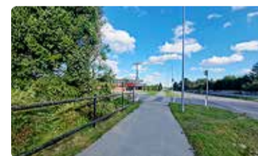
Jalakäija vaade kergliiklusteelt Schüdlöffeli tee ja Randvere tee ristmiku suunas. Vasakul oleva aia demonteerimistööd on alanud.

nähtavusulatus, liikluskorraldus ei muutu. Uue lahendusega väheneb oht eelkõige vähemkaitstud liiklejatele (jalakäijad, ratturid) ning paraneb tervikuna ohutus kooliteel.