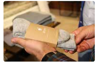
Jõuluaja menuutoode – alpaka-villast sokid.

ne. Algas tõsine töö, sest alustada tuli sisuliselt nullist.