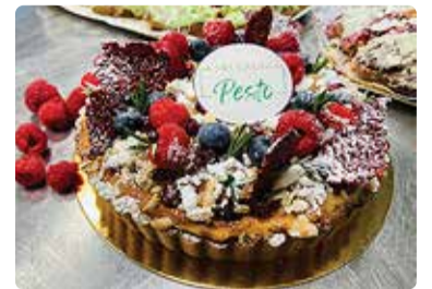
Karulaugu Pesto võtab vastu ka eratellimusi.

Kui suvehooajal tegutses nädalalõpu kohvikuna Eesti sõjamuuseumis ning läbi hooaja ollakse pop-up kohvikuga väljas ka Viimsi huvikeskuses toimuvatel üritustel, siis cateringi teenust võib tellida piltlikult öeldes aasta läbi hommikust õhtuni ning 10-st kuni 200-le inimese-