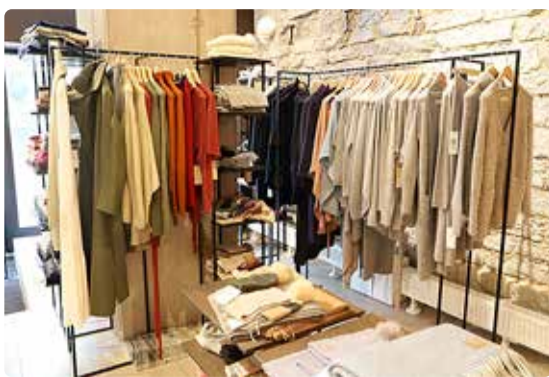
Alpaka tooteid on nii meestele kui ka naistele.

Alpaka brändile sobivate tootjate leidmiseks on tehtud aastaid põhjalikke tööd ja näiteks lõnga tootab neile maailma suurim lõn-