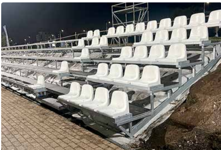
Tribüün on paika saanud.

Näeme staadionil ja anname üheskoos endast kõik, et uuel hooajal oleks nii nais- kui ka meeskond Eesti jalgpalli tippliigades. Üheskoos suudame rohkem!