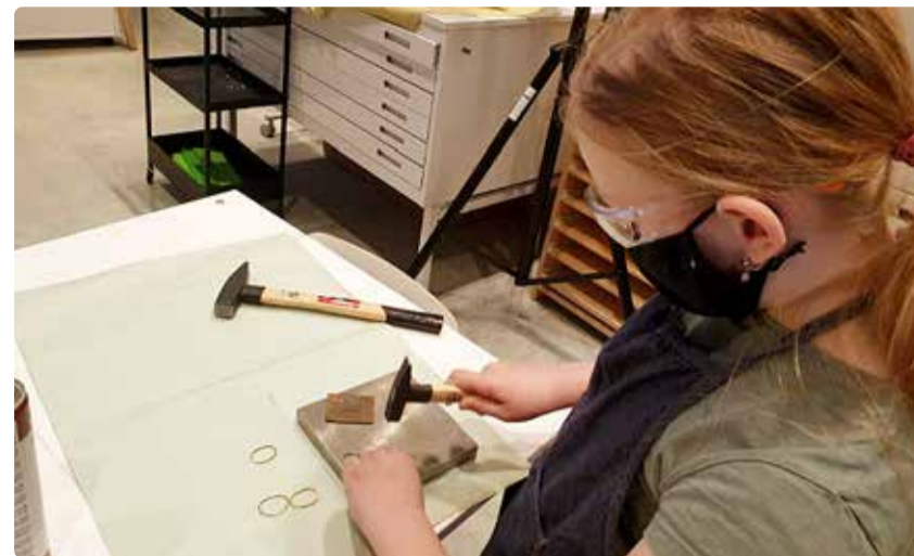
Õppetasude muudatused on tarvilikud, et säiliks Viimsi valla huvikoolide kõrge kvaliteet ja õpetajate vääriline tasustamine.

Huvikoolide õppetasusid vaadatakse üle kord aastas, lähtudes õppetöö mahust ja selle tagamiseks vajalikest kuludest. Õppetasude suuruse kehtestamisel arvestatakse arvestuslikku tegevuskulude suurust õpilase kohta, lapsevanema poolt kaetavat osa, Tallinnaga sõlmitud koolituskulude katmise lepingut ning erasektori poolt kinnitatud õppetasude suurusi. Lisaks on võrdluses Tallinna munits-