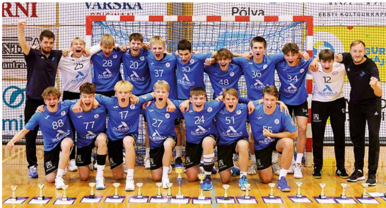
Viimsi U17 võistkond.

VÕIT HC Viimsi U17 võistkond tuli käsipallis 2024 karikavõitjaks noormeeste B-vanuseklassis.