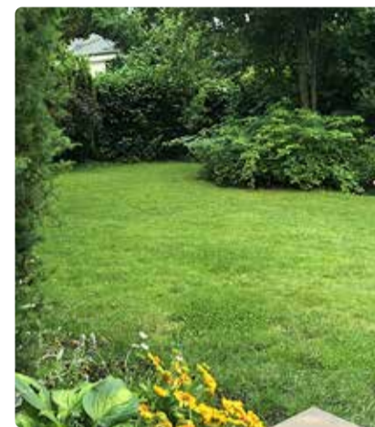
Privaatsust saab edukalt tekitada ka nt ungari sirelist heki, kuhu sisse on pikitud jugapuud ja põisnelat.

Kindlasti ei ole siinkirjutajad elupuude kui taimede vastu, vaid nende massilise ja üheülbalise kasutamise lõpetamise poolt. Me kõik hindame privaatsust, kuid ka seda on võimalik luua targalt. Kui mõtlete oma koduaia peale, siis võib jagada privaatsed tsoonid või vaated kaheks – need, mis on vajalikud kogu aeg, ja need, mis olulised suvel. Esimeste osas tasub tõesti kaaluda igihaljaste taimede kasutamist, kuid suvel piisab ka heitlehiste taimede kasutamisest. Mõlemate soovide rahuldamiseks on meie kliimasse taimelikut küllaga. Heki asemel võib vaatesuunda sulgema istutada hoopis grupiti taimi – tulemus on juba mitme-