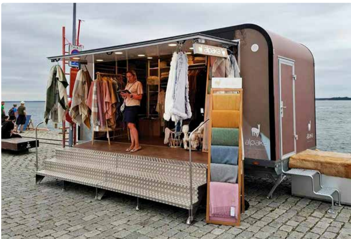
Alpaka pop-up pood. Täpsema info poe kohta leiab ettevõtte kodulehelt.

2013. aastal avaldas ajaleht Mirror uudise, et Saksamaal Falke kompanii toodetud eksklusiivsed vikunjavillast sokid saab soetada ei rohkem ega vähem kui 872 euro eest. Kampsuni eest peab huviline välja käima pea 2421 eurot.