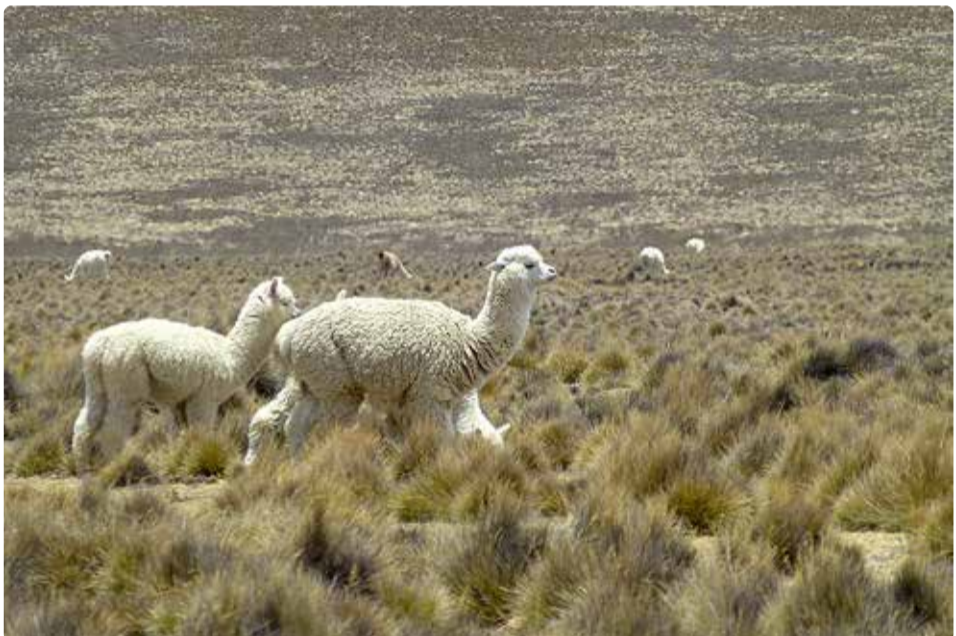
Alpakad Peruu.

Aga konkurents paneb pingutama ja seda on ettevõtja räägitust ka