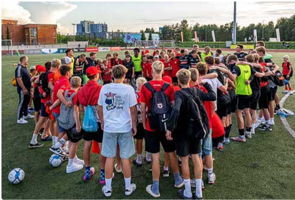
Jalgpallur läheb trenni ja võistlusele igasuguse ilmaga.

Meeskonnal seevastu on kõik mängus. Hooaja lõpuni on 16. oktoobri seisuga jäänud veel ainult viis mängu – kaks kodus ja kolm võõrsil. Oleme tabeliliidrid, mis tähendab, et kõikide õnnestumiste tulemusena saab uuel hooajal