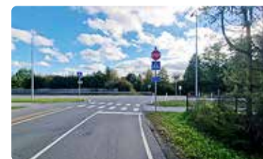
Sõidukijuhi vaade Schüdlöffeli teelt Randvere tee suunas. Paremale jäävat kõrghaljastust on kavas liiklusohutusest tulenevalt eemaldada ja piirdeaia taandega ehitamine võimaldab senisest paremat nähtavust.