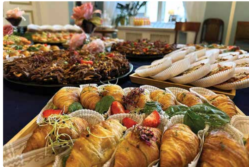
Karulaugu Pestos valmistatakse algselt lõpuni kõik ise.