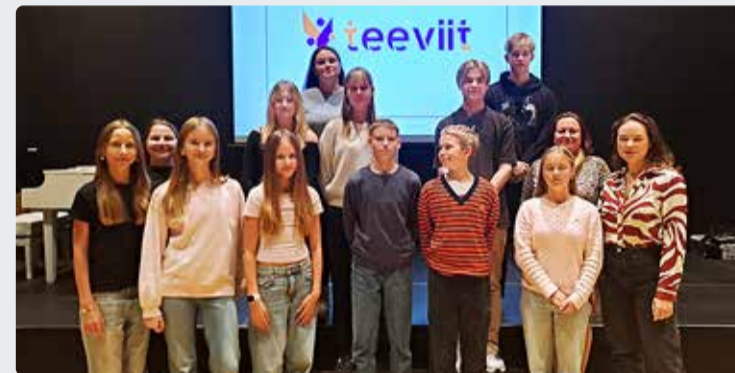
Kohtumisel osalenud noored ja noorsootöötajad.