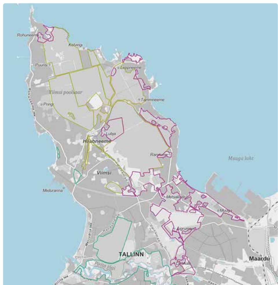
Maastikukaitsealade (MKA) paiknemine ja uute ettepanek poolsaarel hõlmab suure osas seniseid kaitsemetsi ja rohealade teemaplaneeringu alasid. Heleroheline – olemasolev MKA, sinine – riiklik kaitseala, lilla – uute MKAde või olemasolevate laienduse ettepanek. Joonis: ÜP eskiis, kaart: Maa-amet

Oluline on kokkulepete ja tasakaalustatud lahenduste leidmine, mis seeläbi aitab Viimsist kujundada veelgi atraktiivsema ja harmoonilisema elukeskkonna. Usun, et ka maaomanikel on soov hoida siinset elurikkust. Maastikukaitsealal tuleb küll teatud reeglitega arvestada, aga oluline ongi selles osas leida mõlemat poolt rahuldav tingimuste komplekt. Selleks kaasame maaomanikud eraldi.