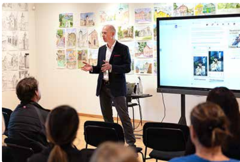
Selle aasta ettevõtluspäeval oli võimalik osa saada tasuta koolitustest, mis osutusid väga populaarseteks.