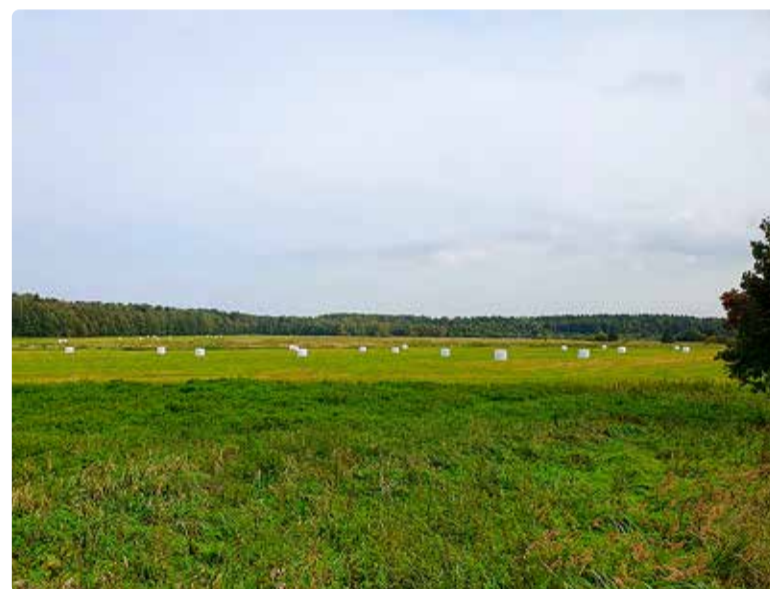
Avamaastikud on oluline osa rohevõrgustikust. Need on muuhulgas toitumislauaks ulukitele, pesitsemiskohaks aga ka rände ajal peatumispaigaks lindudele. Fotol silo tegemine Mäealuse maastikukaitsealal.

Viimsi valla territooriumil tegeleti looduskaitsega juba 13. sajandil. Nimelt peetakse Taani kuninga poolt sätestatud Naissaare metsa raiekeeldu 1297. aastast Eesti vanimaks looduskaitsealaseks dokumendiks üldse. 17. juunil 1297 avaldas Taani kuningas Erik Menved käsu kaitsta metsa Naissaarel ning lisaks ka Aegnal, Paljassaarel. Kolme aasta pärast on meil võimalik