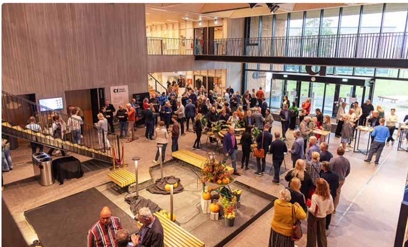
Viimsi ettevõtluspäev on aastatega viimsilaste seas üha populaarsemaks muutunud.