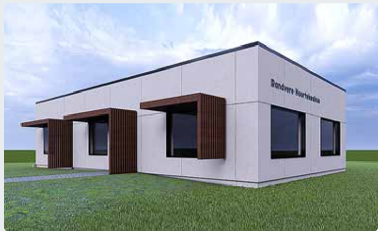
Randverre tuleb uus noortekeskus. Eskiis: Kristjan Reidl