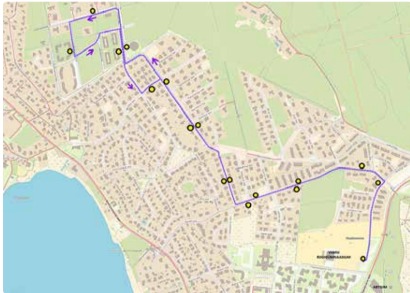
Isesõitva bussi marsruut kaardil. Aluskaart: Maa-amet

Testperioodil liigub buss marsruudil Vardi tee – Nurme põik – Hundi tee – Põldheina tee – Tammepõllu tee parkla. Marsruudi valikul on arvestatud piirkonnaga, kus hetkel puudub ühistransport, kuid kus asuvad rahustatud liiklusega ja vähendatud piirkirusega teed. Buss teenindab huvilisi iga päev kuus tundi: hommikul kell