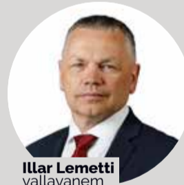
Illar Lemetti vallavanem