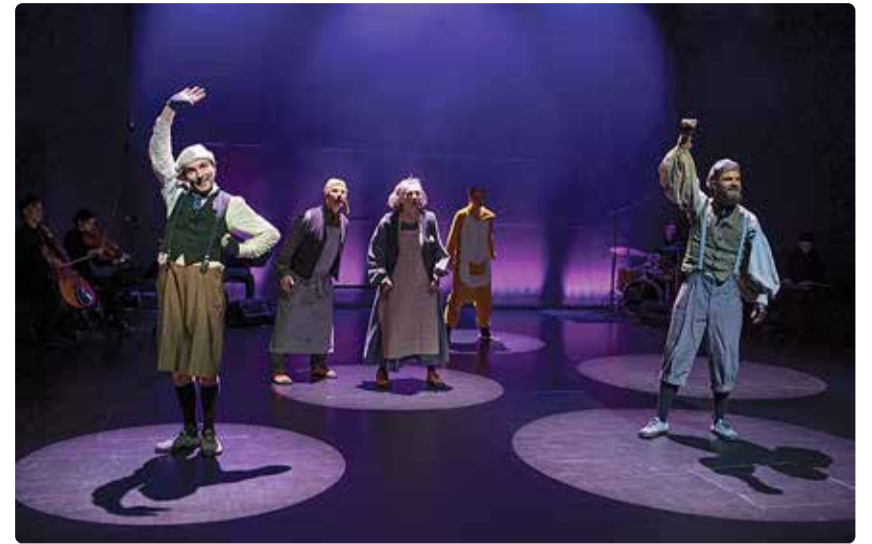
Stseen etendusest “Tallinna karud”.