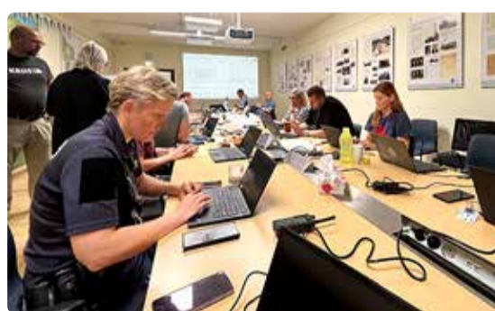
Vallavalitsuse kriisistaap õppusel.

Kriisideks valmistumisel on oluline iga üksikisiku panus. Edukas kriiside haldamisel saab olla siis, kui on kaalutud riskid ja koosta-