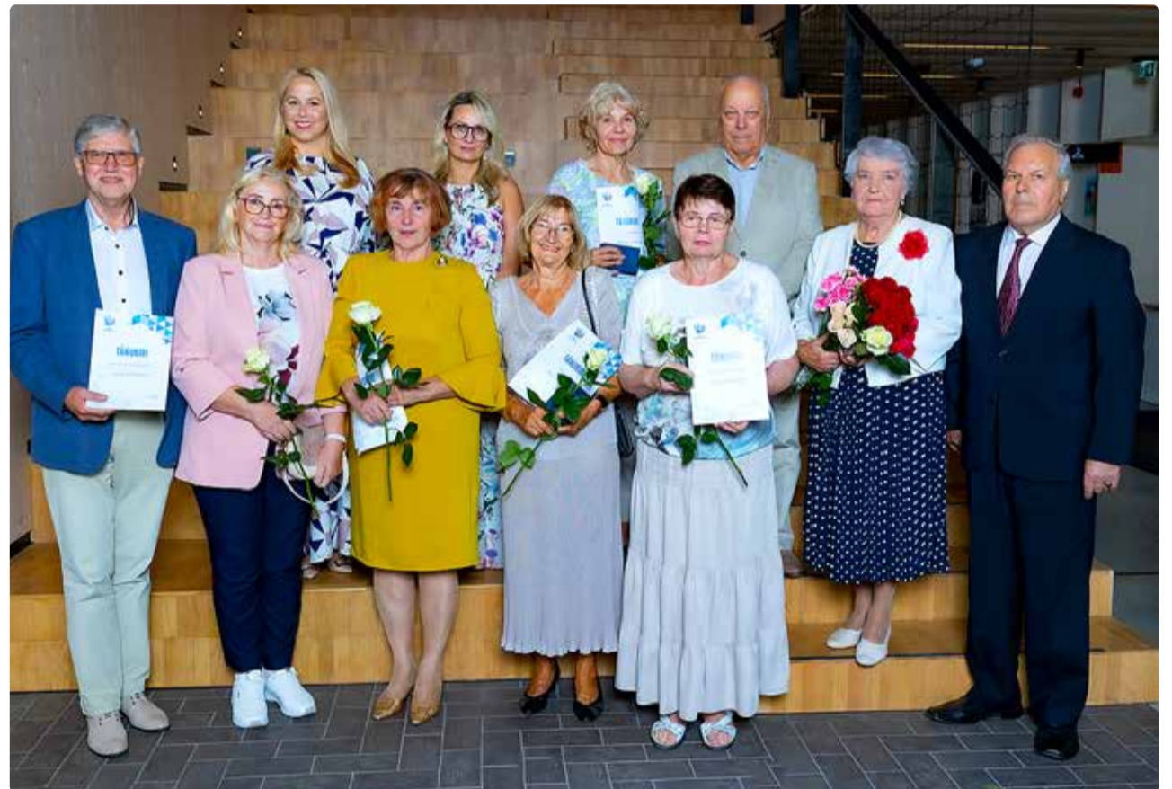
Tunnustuse saanud vanaemad ning teemant- ja kuldpulmapaariid.

VANAVANEMAD Juba kolmandat aastat järjest tähistati Viimsi septembri teisel pühapäeval vanavanemate päeva.