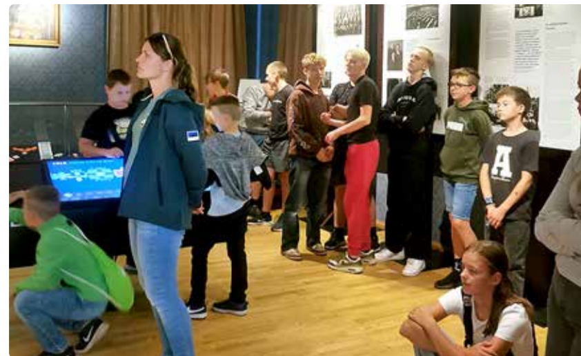
Museumikoolis saavad ajalooühilised õpilased ülevaate Eesti lähiajaloo.

Koolitus kestab kaks päeva, sisaldades ekskursiooni sõjamuuseumis, loenguid Eesti lähiajaloo historiograafiast, üldistest ajaloolastest andmebaasidest ja sõjamuuseumi enda andmekogudest ning praktilist töötuba, kus õpilased saavad õpitut kinnistada