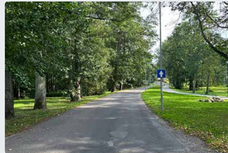
Pargi teel teostatakse töid septembris ja oktoobris.