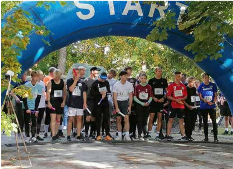
Üks Spordinädala sündmustest on kindral Johan Laidoneri olümpiateatejooks.

SA Liikumisharrastuse kompetentsikeskuse kommunikatsioonijuht