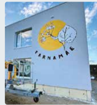
Uue lasteaia maja seina ehib logo.