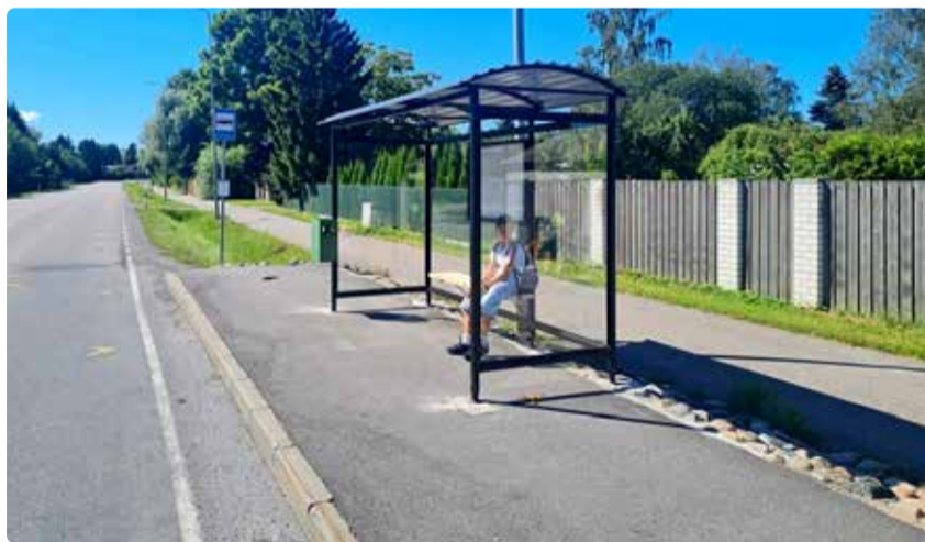
Vaade Metsakasti peatuse uuele ootekojale.

Ampri tee otsas asuvas Farmi peatuses on käimas platvormi laiendamise tööd (kraavi torutamine ja platvormi ehitus), et ka sinna saaks paigaldada ootekoja kojusõitmist ootavate töötajate jaoks. Koostöös transpordiametiga on läbi viidud riigihange, et ehitada välja bussitasku ja platvorm ning võtta ette ootekoja paigaldamine Nurme tee alguses olevale Rannarahva peatusele.