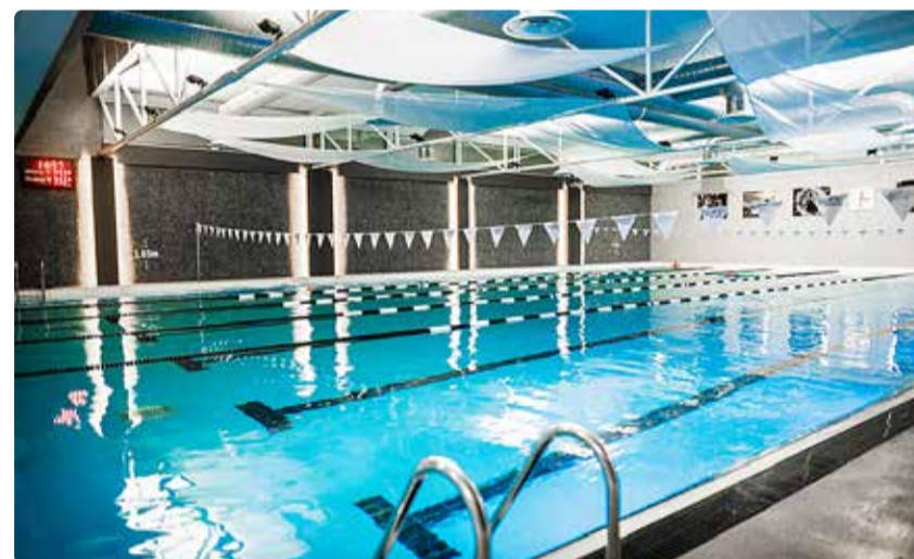
Viimsi SPA spordiklubi ujula.

Vallavalitsuse toel saavad soodsalt tervislikult aega veeta rahvastikuregistri järgi Viimsi vallas elavad pensioniealised inimesed, kellel tuleb pääsme eest tasuda 9 eurot. Vör-