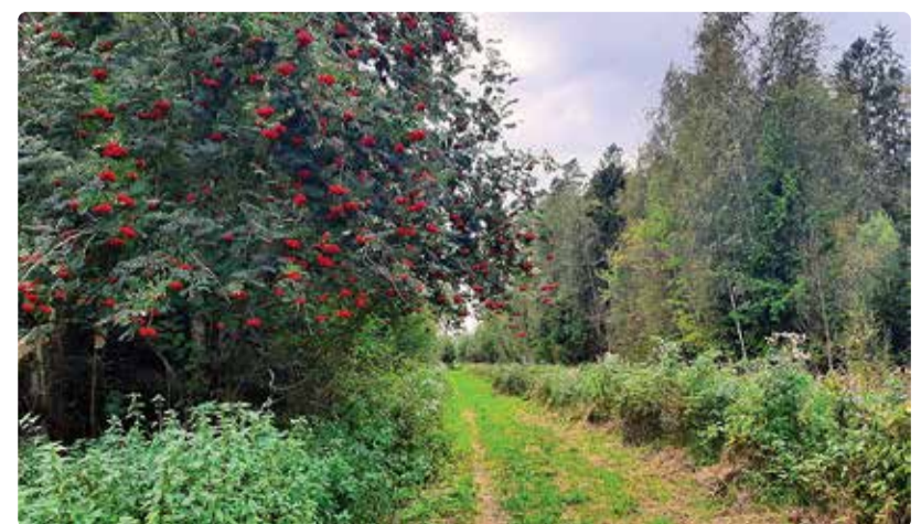
Rajad on nüüd puhastatud ja niidetud.