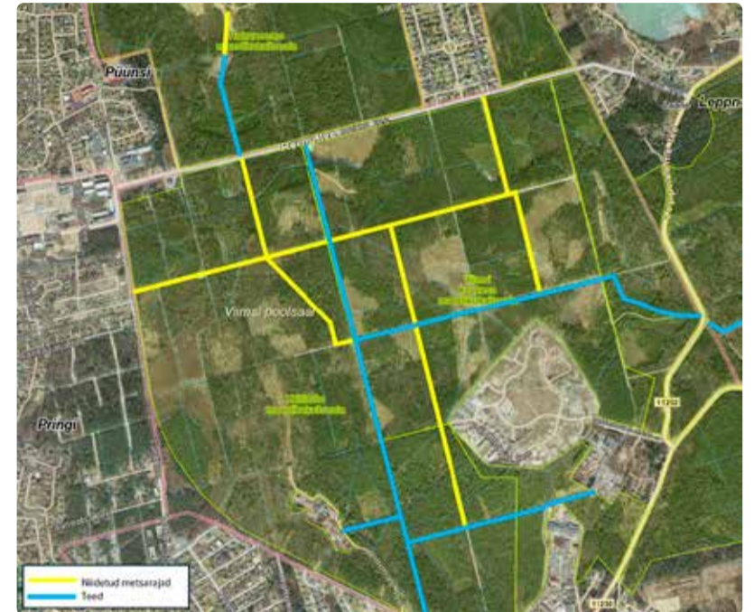
Teed ja niidetud loodusrajad Krillimäe MKA-I, Viimsi keskosa MKA-I ja Rohuneeme MKA-I. Kaart: Maa-amet

Viimsi vallavalitsus tegi algust matkaradade võrgustiku rajamise ja nende omavahelise ühendamise tööga Viimsi poolsaare kaitsealadel. Esimene etapp viidi ellu Krillimäe ja Viimsi keskosa maastikukaitsealadel (MKA), aga puudutatud sai ka Rohuneeme MKA.