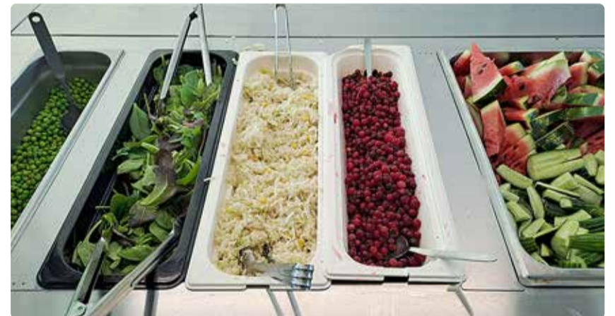
Uuest kooliaastast on koolitoidu menüüdes suurem köögi- ja puuviljade valik.

Mitmekesisem ja tervislikum toit Alates augustist kehtivad Viimsi lasteaedades ja septembrist ka koolides