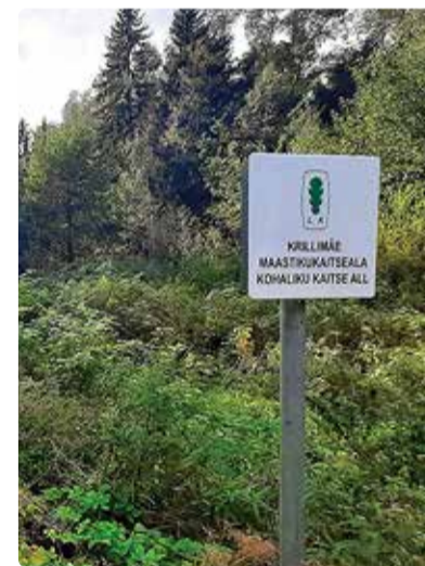
Krillimäe MKA-I ootab sind kaunis loodus.

Esimeseks tööks oli radade puhastamine ja niitmine. Nüüd saab metsade vahel jalutada nii niidetud radadel kui ka olemasolevatel teedel. Igaüks saab endale sobiva trajektoori valida. Kui tahad, võid jalutada Kelvingist Pringisse või hoopis Pringist Rohuneemele, sest nüüd saab ka Reinu teelt läbi Komposti kinnistu Rohuneeme MKA põhja- ja kirdeosasse liikuda.