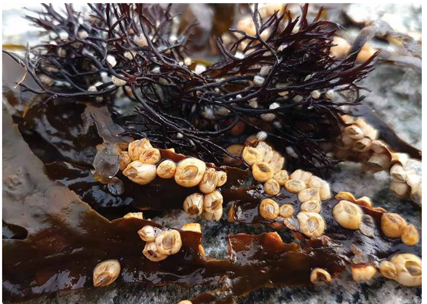
Tõruvähid makrovetikate (mh põisadru) peal.

Tõruvähk võib olla kinnitunud näiteks kividele, vaiadele, laevakerele, teokarpidele, nootadele, võrkudele, aga ka kõikisugu muudele kõva pinnaga objektidele, mh vees