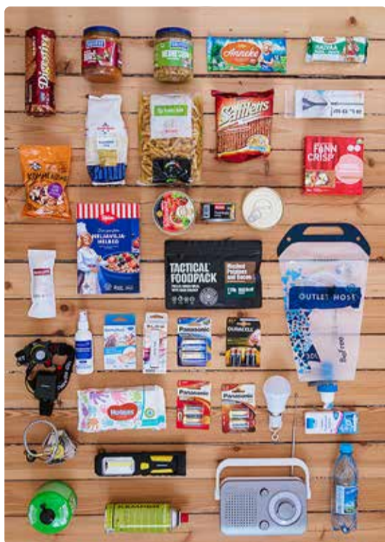
Näide kriisivarudest.

Omavalitsus peab hindama võimalikke riske ning looma plaani, kuidas oma inimesi kaitsta. Päästeamet veab regionaalseid kriisikomisjone, kuhu kuuluvad piirkonna omavalitsused ja riigiasutuste regionaalsed üksused, kelle roll on lahendada kõiksugu kohalikku elu