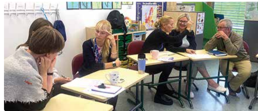
Õpetajad õpingides õppimas.

Eelmisel õppeaastal käivitusidki Viimsi koolis õpingid – 12 umbes kümneliikmelist õpigruppi, mida juhtis õpingi juht ning mis kogunesid kümnel korral õppeaasta jooksul. Õpingide jooksul loodi ühtne teadmispagas psühholoogiliste baasvajaduste ja täidesaatvate funktsioonide osas. Õpingi juht ei olnud loengupidaja, vaid pigem teadlik arutelu juhtija. Osalev õpetaja ei olnud õpingis mitte ainult õppija rollis, vaid läbi arutelude ja kogemuste jagamise ning analüüsimise toimus koos õppimine. Loodud õpingid olid aine- ja kooliastme ülesed, mis andis võimaluse uusi inimesi tundma õppida ning kogemusi ja teadmisi jagada kolleegidega, kellega igapäevaselt kokku ei puutuks. Õppides koos teise valdkonna ja teistsuguse taustaga inimestega, tekib avaram maailmavaade ning võimalus näha teisi vaatenurki. Õpingid toimusid umbes kord kuus 1,5 tundi pärast koolipäeva lõppu, mis ühtpidi oli väsitav, kuid samas andis hoogu ühtsele väärtusruumi tekkele – õpingidest sai Viimsi kooli koolikultuuri osa.