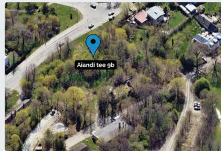
Aiandi tee 9b kinnistu asukoht. Kaart: Maa-amet