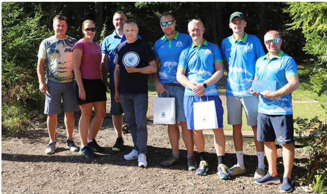
Vallavalitsuse, vallavolikogu ja MTÜ Viimsi Discgolf esindajad.