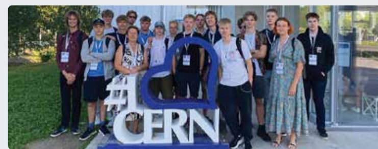
Viimsi gümnaasiumi noored koos õpetajatega CERN Science Gateway es.