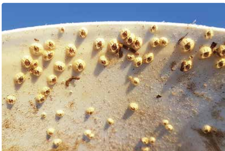
Tõruvähid mereprügi (plastikämbr) peal.

Lisaks kõigele sellele on tõruvähkidel ka võime eriti halbades tingimustes langeda seisundisse, kus nad oma elutegevuse peaaegu seisma panevad, suutes nii mitu kuud eksisteerida. Kui tingimused paranevad, taastub ka endine elu.