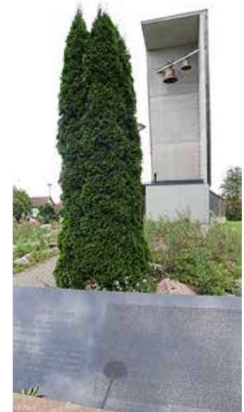
Viimsi Püha Jaakobi kiriku juures asuv mälestuskivi reisi-laev Estoniale.

■ Estonia huku 30. aastapäeva mälestuskontsert "Laulan üle merede" toimub 28. septembril kell 19 Viimsi Püha Jaakobi kirikus. Kavas on eesti, soome ja rootsi heliloojate muusika: Sibelius, Hillborg, Tormis, Tüür, Kreek, Mägi, Grigorjeva. Esinevad VHK keelpilliorkester (dirigent Rasmus Puur) ja Virgo Veldi (saksofon). Pileteid müüakse kohapeal enne kontserdi algust.