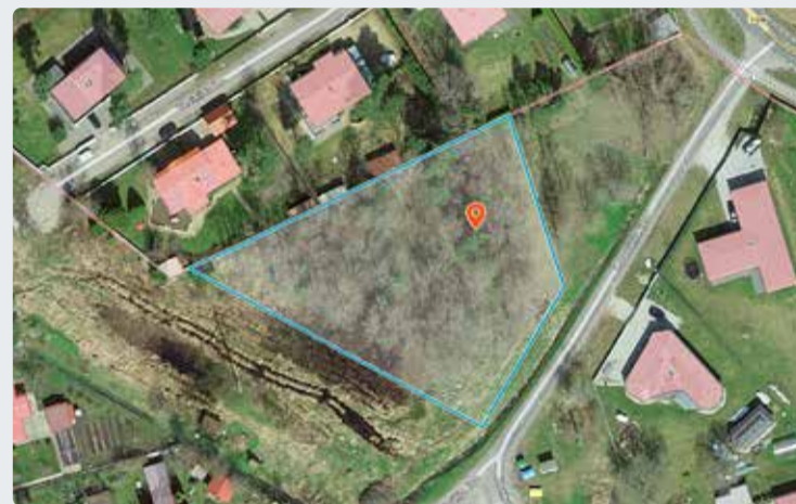
Loovälja tee 2. Kaart: Maa-amet

Täpsemat informatsiooni saab maa-ameti kodulehelt aadressiga www.maaamet.ee või oksjonikeskkonnas aadressil riigimaaoksjon.ee .