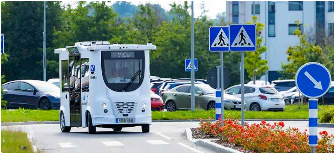
Isesõitev buss teenindab huvilisi kuuel tunnil päevas.