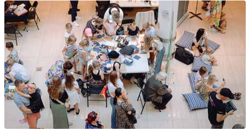
Lõbus päev haaras kaasa nii väikeseid kui ka suuri.

Laval löid meeleolu Mari-Liis Velbergi flamenko tantsustuudio, Kaie Kõrbi Balletistuudio, võimlemis- ja tantsuklubi Keeris, Akrobaatika Kool, Ita-Riina Muusikastuudio ja JJ- Street Viimsi Wanted Battle tänavatantsu võistlus.