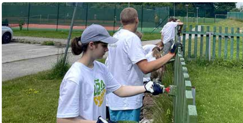
Noored õpilasmalevas.

Maleva rühmajuht Kätlini arvates oli üleöö malev hea võimalus saada malevakogemusest maksimumi. "Üle-