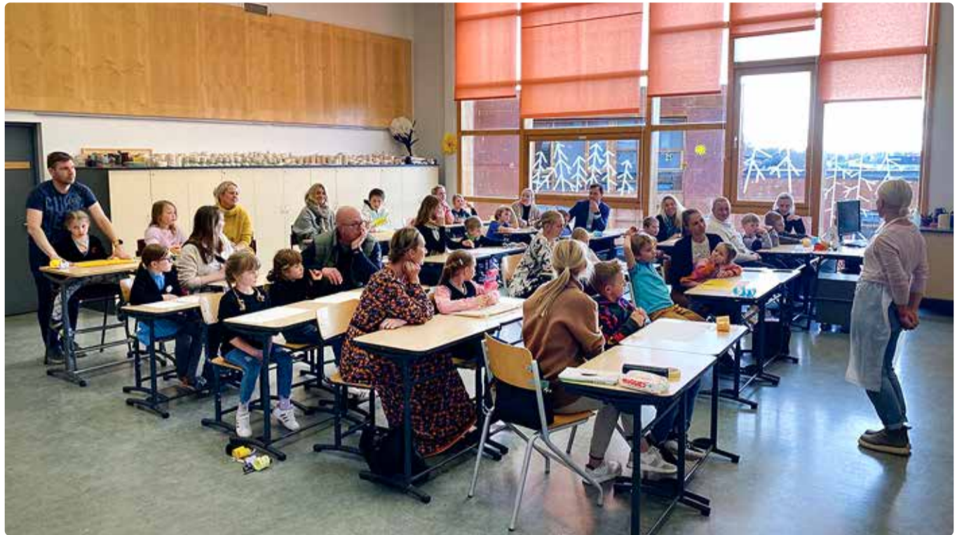
Laste ja vanemate ühis-tegevus pakub alati suurt rõõmu.