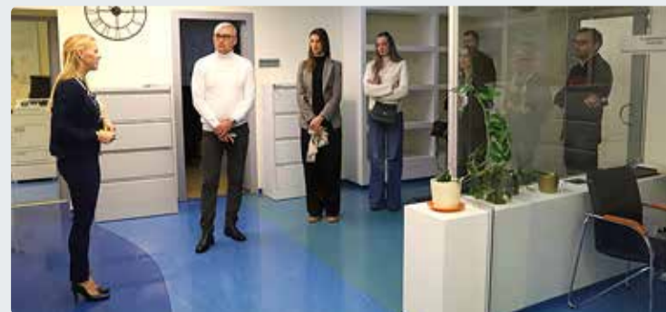
Montenegro delegatsioonile tegi Viimsi vallamajas ringkäiku projektkoordinaator Meeli Kuul.