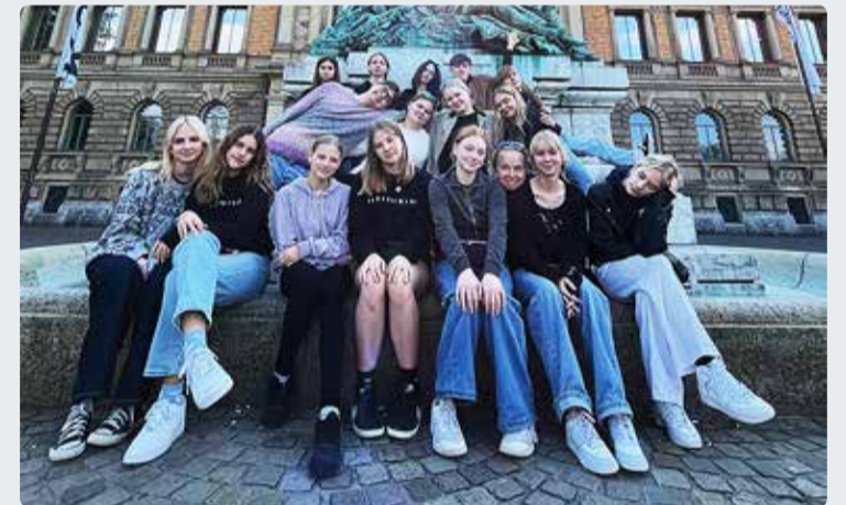
Näitetrupp EKSPERIMENT Saksamaal festivalil.