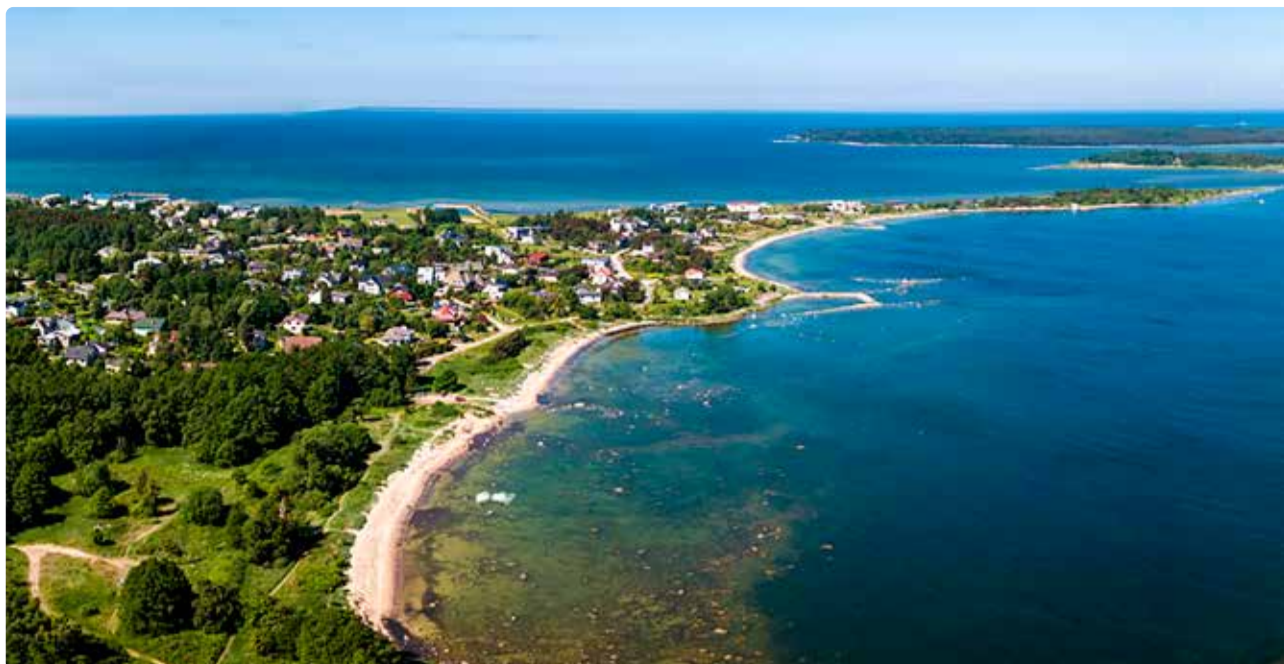
Viimsis tuleb leida tasakaal rohelisuse säilimise ja ehitamise vahel.