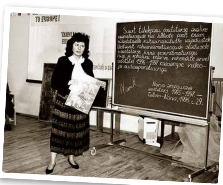
Narva raamatukogu uue hoone arutelul 1995. aastal.