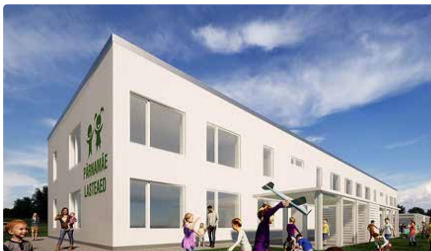
2025. aastal valmiv Pärnamäe lasteaed. Joonis: Viimsi Teataja arhiiv

"Järgmisel aastal valmivad Viimsis kauaoodatud jalgpalli- ja kergejõustikhall, algab Tamme pargi rajamine, valmivad Haabneeme kooli juurdeehitus, erihoolekandekeskus ning Pärna-