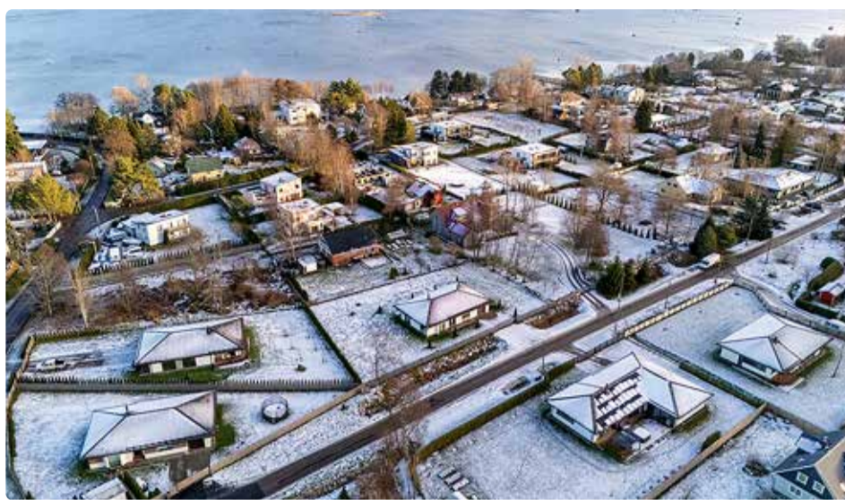
Ettevõtte kodukohas Viimsis leidub majadel Weckmani katuseid nii kaugale, kui silm ulatub.