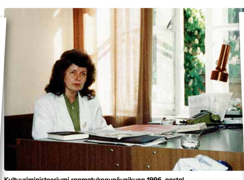
Kultuuriministeeriumi raamatukogunõunikuna 1996. aastal.