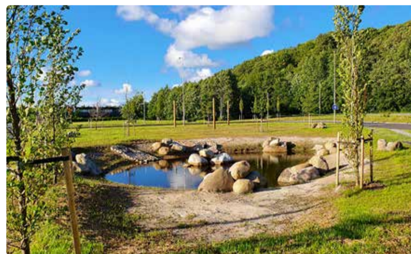
Vaade Haabneeme rajatud kastmisvee tiigile (kasutusel ka viibetiigina).

Partnerluse tegevused keskenduvad kolmele põhivaldkonnale: regulatiivsete takistuste kõrvaldamisele, rahastusvõimaluste parandamisele ja teadmiste levitamisele. Eriline tähelepanu on