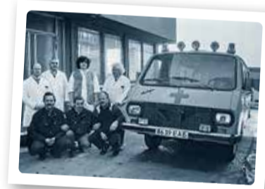
Viimsisse õnnestus luua oma kiirabibrigaad.

Saarevalvur oli maailmast juba aastaid ära lõigatud ja pidas valla esindajaid fašistideks.