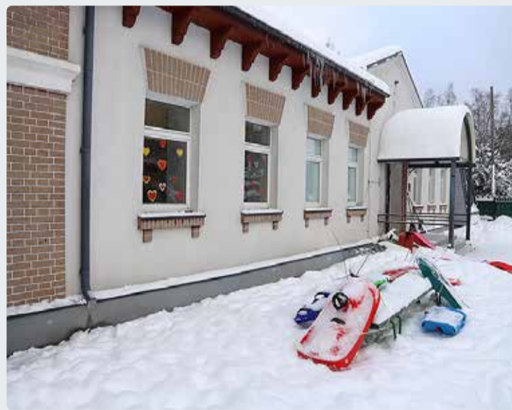
Leppneeme lasteaed.

Polina Kossenkova alushariduse vanemspetsialist