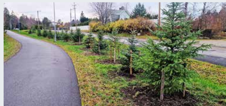
Tammneeme teed kaunistab igihaljas okaspuusalu.