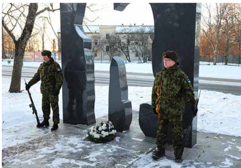
Johan ja Maria Laidoneri mälestusmärgi juurde asetatakse pärjad.

Mälestuspäeval asetatakse küünlaid ja pärji kõikidele vabadussõjaga seotud mälestussammastele, mälestustahvlitele ning vabadussõja võitlejate tähistatud sünnikohtadele ja haudadele. Koos teistega üle Eesti tähistab vabadussõjas võidelnute mälestuspäeva ka Viimsi vald.