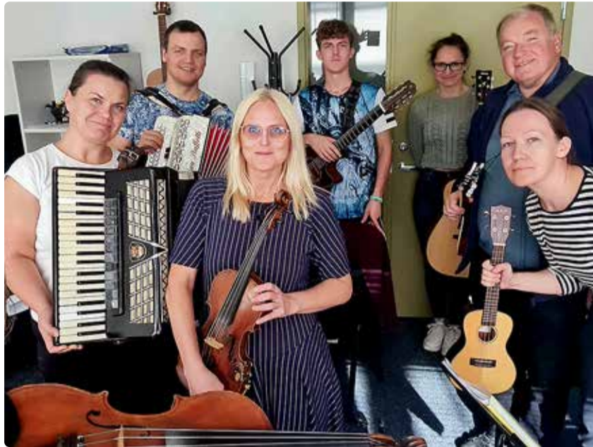
Pilliklubilised Viimsi Äritares.

Pilliklubi Virbel koondab erinevate pillide mängijaid, noori ja veidi vanemaid. Meie koosseisus musitseerivad viiulid, karmoškad, kitarrid ja ukulele, flöödid ja akordion. Suvisel rahvamuusikapeol püüdleme suurde ühismänguorkestrisse, kus sajad pillimängijad koos meie pärimuse varasalvest leitud laule ja pillilugusid esitavad. Pilliklubi juhendajal Krista Sildojal on varnast võtta eelmise peo koondorkestri liigijuhni kogemus, mis ei lase pillimängusädemel vaibuda. Rahvamuusikapidu on suurim valdkondlik pidu võimsate ja eluõiguse välja teeninud laulu- ja tantsupeo kõrval. Vabaduse väljakul kõlama hakkavad eriilmelised pillilood kutsuvad kaasa laulma