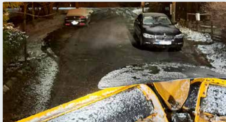
Kui auto teeservale jätke, ei saa teehoolusmasinad korralikult tööd teha.

Morten Talviste teehoolde vanemspetsialist