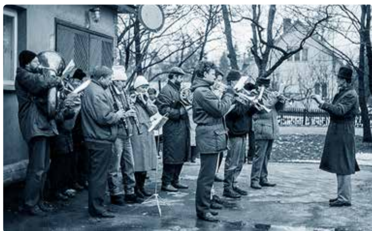
Vallavalitsuse taasavamise puhul mängis orkester.