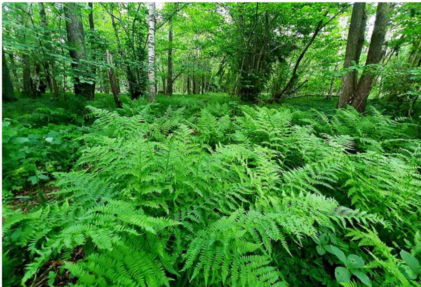
Sõnajala kasvukohatüüp Mäealuse MKA-I.

Muld mõjutab metsa ja mets mõjutab mulda. Mingi ala mullad on seotud lisaks niiskustingimustele ka piirkonna lähtekivimiga, mis on omakorda seotud meie geoloogia eripärade. Lähtekivimiks nimetatakse pinnakatte ülemist osa, mis võtab otseselt osa mulla moodustumisest. Eesti pinnakatte kujunemisel on määravat rolli omanud mandrijää protsessid. Eesti aladel koosneb pinnakatte peamiselt moreenist ja on suhteliselt õhuke, kui