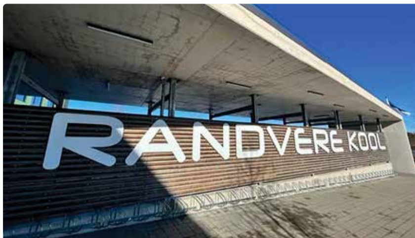
Randvere kool teeb kõik võimaliku kitsaskohtade kõrvaldamiseks.

“Siin on kindlasti oluline sisend ka vallale, et peame oma järelevalve mee-