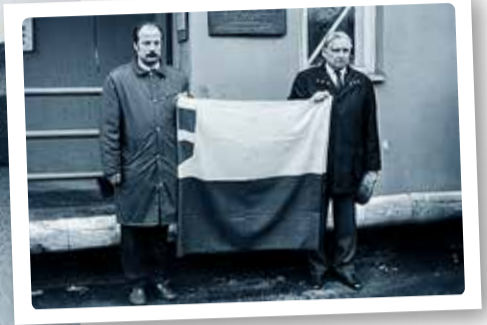
Asendada tuli vana külanõukogu siit ning paika panna ka valla lipp.

1993. aasta 1. septembri Rahva Hääle esilehe lugu kandis pealkirja "Koolimaja, mis teeb kadedaks". See oli lugu vastvalminud Püünsi koolist. Leht kirjutas: "Püünsi Algkoolis alustab kooliteed 35 poissi-tüdrukut esimesest kuni neljanda klas-