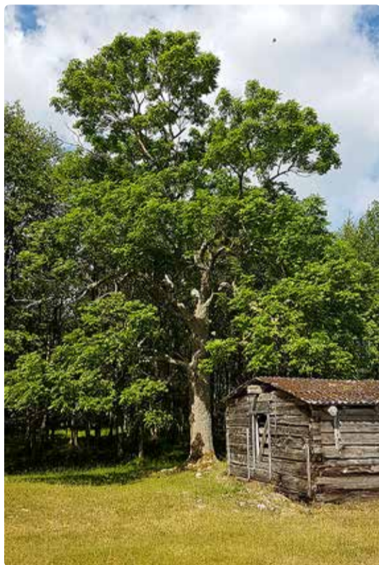
Suur saarepuu pakub nii aiailu, varju kui ka elupaika.

Viimsi vald ei ole küll linn, aga ometi elab valdav osa siin elavatest inimestest tiheasustusega aladel, kus maa hulk on piiratud ja selle kasutamise üle on suur konkurents. Kuna puud iseenda eest seista ei saa, tuleb meil ka nende heaoluga arvestada. Viimsilastele on sinne loodus väga oluline ja puude raiumisega toimuv tekitab alati kõrgendatud huvi.