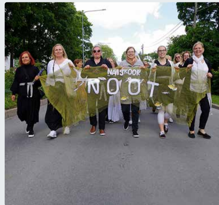
Naiskoor Noot Harjumaa laulu- ja tantsupeo rongkäigus.