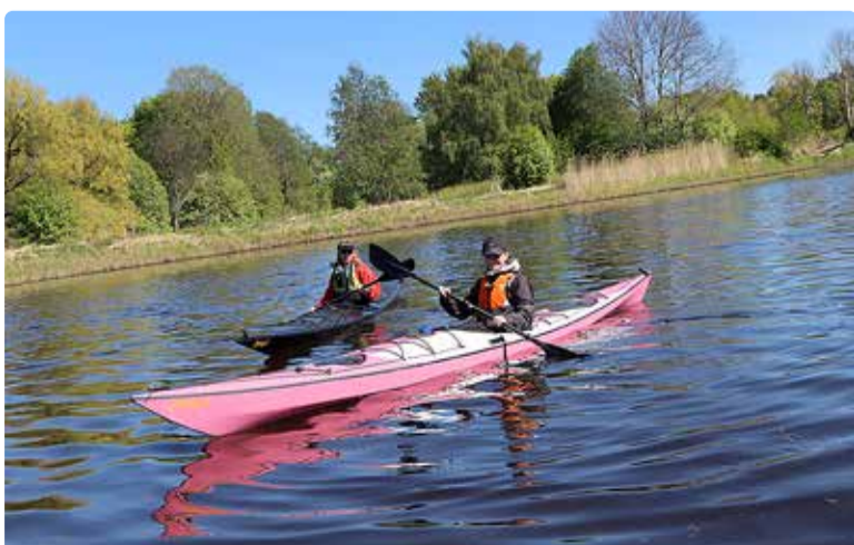
Elen proovisõidul Pirita jõel.

Talvised eskimopöörde koolitused Lembit Uudsemaa juhendamisel Viimsi kooli basseinis: kanuujakahvel.ee/eskimopoorde-koolitused/ .