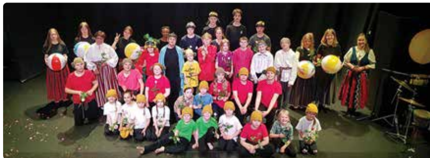
Projektis osalenute ühispiilt.

“Lõuna!” oli eriline koostööteatri projekt Soome ja Eesti vahel, mille tulemusena sündis tantsuteatri etendus, kus tavalised koolinoored vanu-