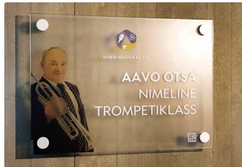
Klaasistahvel klassiruumi 304 kõrval.

Aedade ja terrasside ehitus ning renoveerimine