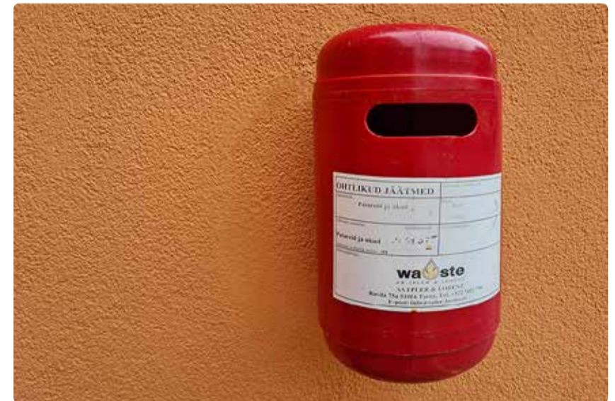
Ohtlikud jäätmed tuleb viia spetsiaalsetesse kogumiskohtadesse.