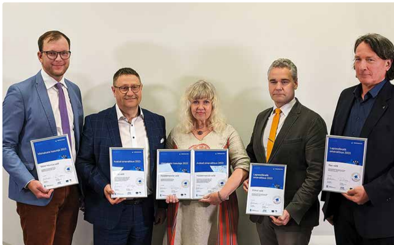
Väike-Maarja, Tartu, Häädemeeste, Viimsi ja Rae vald paistavad silma lastesõbralike ja võimalusterohkete kohalike teenustega.

Liikuvuse valdkonnas on Viimsi tulemus (6) kõrgem. Väga hea olukord on süsteemsuse ja tulemuslikkusega. Siin alalõigus teevad eriti rõõmu elanike kõrged rahuloluhinnangud nii sõidu-, jalg- kui ka jalgrattateedega. Murelikuks teeb alla omavalitsuste mediaani jääv ühis-transpordi kättesaadavus ja liiklus-