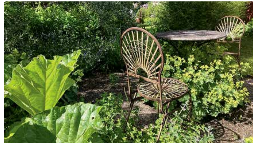
Istumiskoha ümber rabarber, h. pune, faasseni naistenõges, lavendel, kortsleht, asparaagus, mesiohakas, astelpaju, laua all h. kortsleht – kõik iluks ja toiduks.

Konteineri nurka või istutusala keskele sobivad nt tüümian või pune. Mõlemad taimi saame kasutada toiduks terve hooaja vältel ning lisaboonusena kaunistab igihaljas liivatee aeda sügistalvisel perioodil. Pune kasuks räägib varakevadine tärkamine ja taim 100% kasutamise 2–3 korda suve jooksul, lõigates maapinna lähedalt maha ja kuivatada või teha maitsesoola (miksides teiste maitsetaimedega) – tugevam maitse ja aroom on öitseval taimel. Samal moel saab kasutada ka igihaljast tüümiani, kuid selle taimi puhul peaks tugevam tagasi lõikus jääma augusti algusesse, et taim