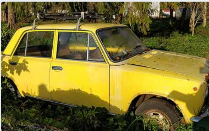
Hoov puhtaks! Lase oma autoromu tasuta ära viia.

kliimaministeeriumi tootjavastutuse ja ohtlike jäätmete valdkonna juht