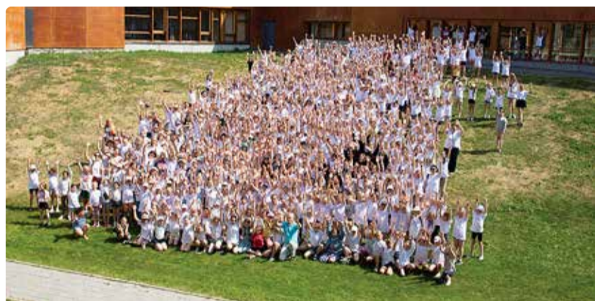
Laagrilised Viimsi kooli õuel.