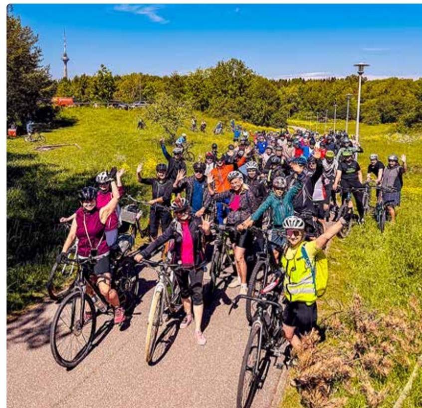
Rattaretk tõi kokku üle saja rattasõbra.

Rattaretkelised piilusid ka Konstantin Pätsi tallu ehk tänasesse botaanika-aeda, arutlesid Mähe aedlinna aianduskoperatiivinduse üle ja otsisid