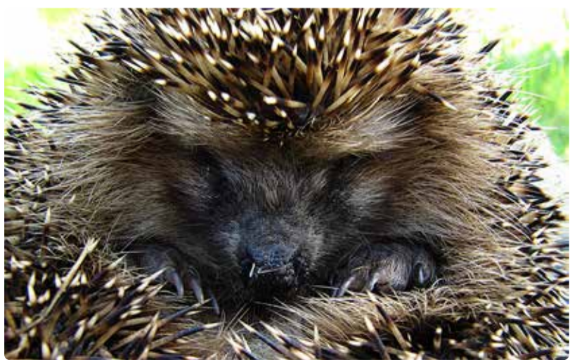
Robotniiduki tekitatud vigastused võivad siilile eluohtlikud olla.