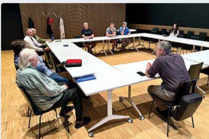
Kohtumine toimus Viimsi raamatukogus.