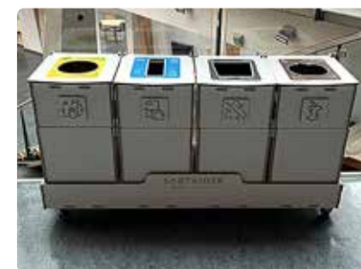
Keskkonnasõbralikud prügikastid asuvad nüüd Randvere, Haabneeme, Püüsi ja Viimsi koolides.

Ühtlasi suureneb seeläbi õpilaste teadlikkus prügi sorteerimise vajalikkusest ja mõjust keskkonnale ning aitab kaasa harjumuse tekitamisele jäätmete liigiti sorteerimisel.