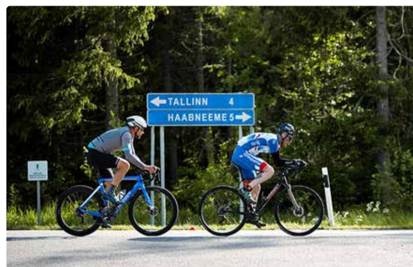
Filter Temposarja neljandal etapil käis rattarajal tihe rebimine.

Kuue kilomeetri pikkusel jooksurajal teenis võimsa võidu Akleksandr