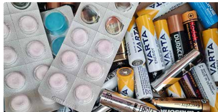
Ohtlikud jäätmed on nii aegunud ravimid kui ka patareid ja akud.