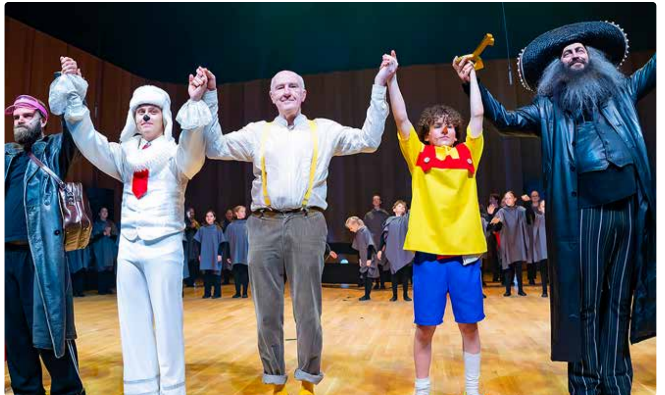
Publik võttis esimesed etendused vastu suurte ovatsioonidega.