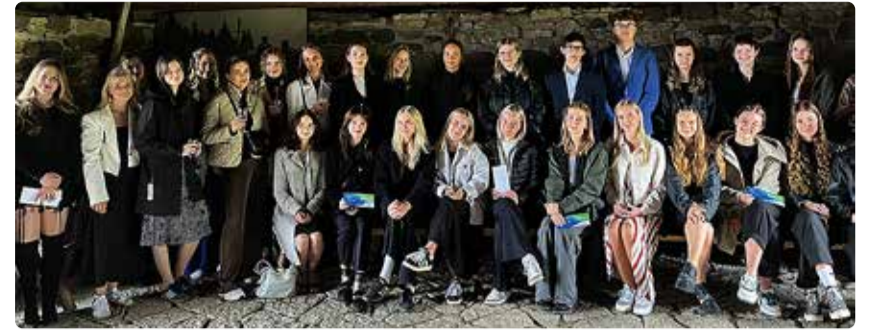
Medalistid vallavanema vastuvõtul.