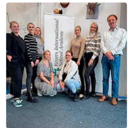
Viimsi gümnaasiumi matemaatikaõpetajad Rivers International Schooli Arnhemis koos kohaliku keemiaõpetajaga.

Õpetaja Merle naasmine õpirändelt tõi kaasa sügava arusaamise eneseteadlikkuse ja enesehoolitsuse olulisusest nii õpetajate kui ka õppijate