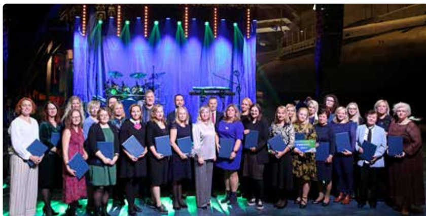
Õpetajate tänuüritusel 2023 tunnustuse saanud haridustöötajad.

Aasta haridustöötaja kandidaat on Viimsi valla üldhariduskooli, huvialakooli, noorte keskuse või koolieelse lasteasutuse töötaja, kes toetab teadliku tegevuse ja isikliku eeskujuga laste/õpilaste väärtushoiakute ja õpioskuste kujunemist; rakendab kaasaegseid õppemeetodeid ja kaasavat haridust;