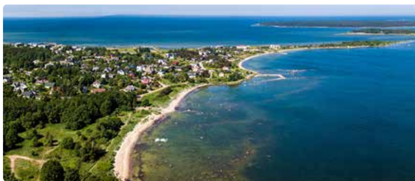
Suve tulekuga võeti üldplaneeringu koostamisel fookusesse valla saared ja rannikualad.

pääsemise ning paadiga randumise asukohad vägagi tähtsad ning eelkirjeldatud eksperthinnang on oluliseks alusinfoks üldplaneeringu eskiisil vastava valdkonna kajastamisel ja tingimuste määramisel.