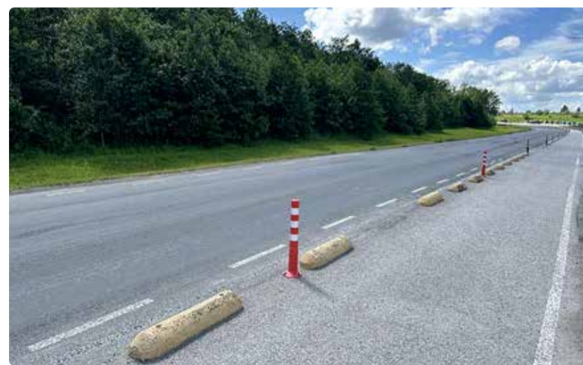
Muuli tee kergliiklusteel käivad remonditööd.

segatud peeneteralise killustiku, emulsiooni ja lisandite segu, mis kantakse õhukese kihina teekattele. Klaasfibreeritud ja lateksi lisamisel tagatakse mössi katte elastsed omadused.