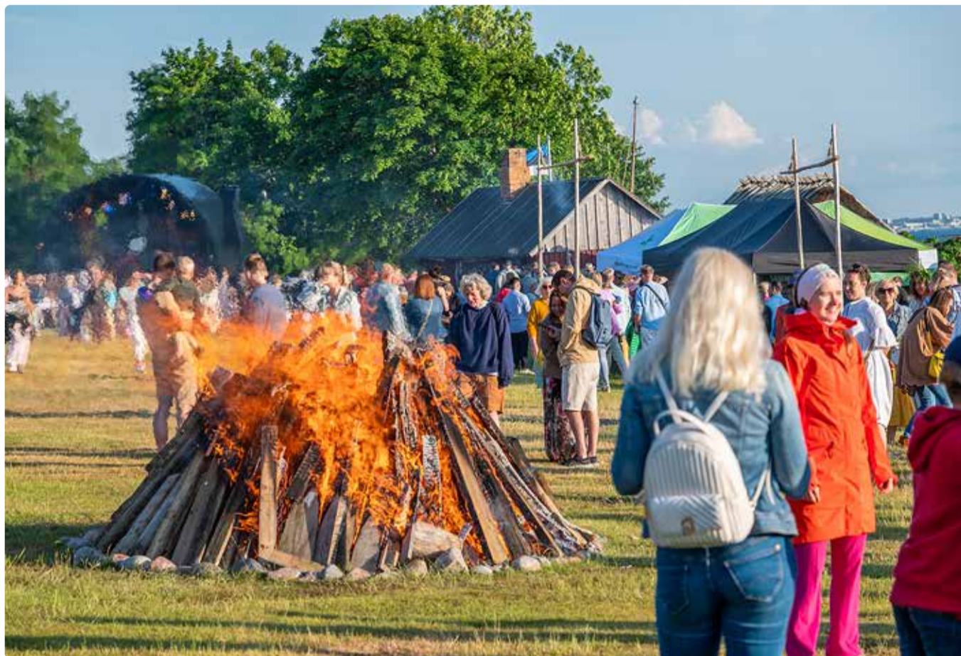
Viimsi vabaõhumuuseumis toimub jaanipeol süttib jaaniõke kell 20.

Suve valgeimal ööl 23. juunil kõlavad Viimsi vabaõhumuuseumis