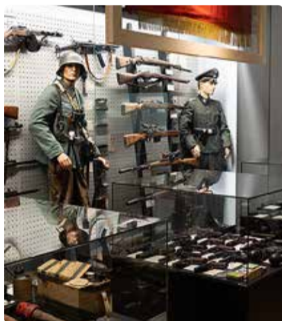
Näitusel on suur hulk teise maailmasõjas kasutatud käsitulirelvi.