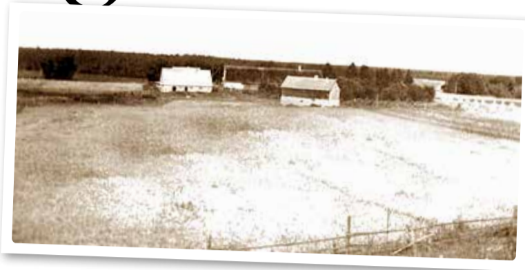
Tõnikse talu Viimsi vallas Lubja külas (14.08.1938). Pildistatud klindiastringult, paremal on näha lõik Lubja teest, mida tollal hobustega läbiti.