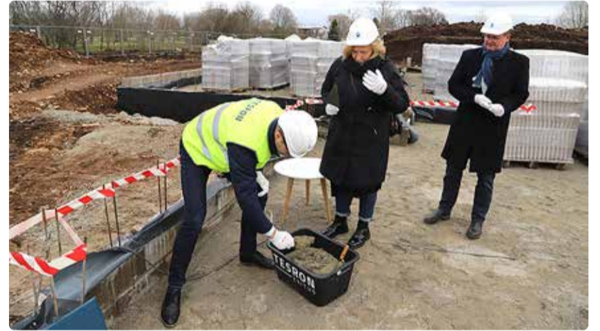
Pärnamäe lasteaial sai nurgakivi paika.

kui ka nende vanemate vajadustele ja ootustele: "Pärnamäe lasteaia rajamine on oluline samm meie valla arengus. See mitte ainult ei laienda meie haridusvõrgustikku, vaid loob ka uusi võimalusi meie kõige noorematele elanikele haridustee alustamiseks keskkonnas, mis neid toetab ja on turvaline."