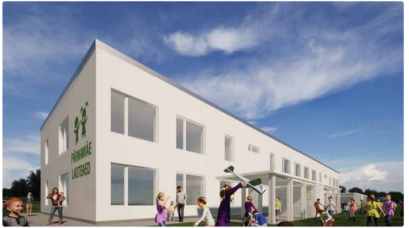
Planeeritav Pärnamäe lasteaed. Eskiis: Toomas Mägi

Heiko Leesment avalike suhete osakonna juhataja