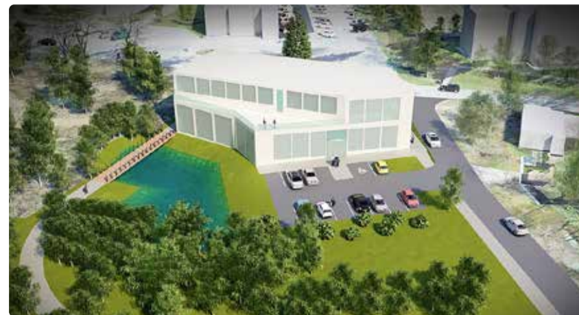
Detailplaneeringu illustatsioon. Eskiis: AB Artes Terrae OÜ

Detailplaneeringut on nelja aasta pikkuse menetluse vältel korduvalt muudetud ning vastuvõetud planeeringulahendus arvestab suurel määral ka kogukonnalt saadud tagasisidet. Selle tulemusena on detailplaneeringus vähendatud hoone mahtu, samuti kõvakattega pindade ulatust ning maa-alal on säilitatud enam rohelist. Vastuvõetud detailplaneeringu lahendus aitab elavdada ettevõtluskeskkonda, muuta alevikukeskuse ligiõmbavamaks ja suurendada mitmesuguste