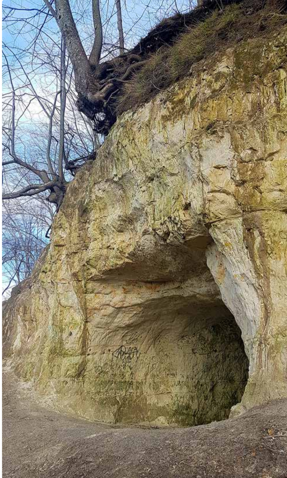
Röövlikoobas liivakivi paljandis.

taja ka varem kirjutanud. Näiteks leiab 2018. aasta 26. jaanuari numbrist koopast põneva foto, mis pärineb Rannarahva muuseumi kogudest. Artikkel on ka veebist leitav. Siit lugejale kodune ülesanne see üles otsida ja uurida.