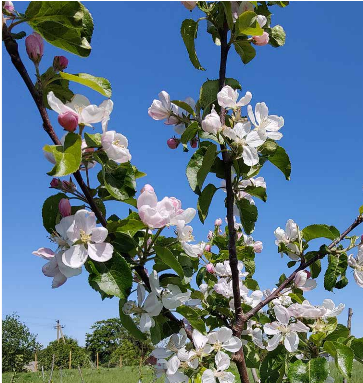
Õunaaia õite-meri.

Praktilised teadmised on Kaspar saanud aga teadlasena pärmiprojektidega töötades. "Ma töötasin ühes maailma suurimas pärmiettevõttes, kus minu ülesandeks oli välja uurida, millised pärmid, mida portfoolios oli tuhandeid, sobivad siidri tootmiseks," selgitas Kaspar. Nii sai ta hulgaliselt teadmisi sellest, kuidas pärmid siidri käärivust mõjutavad. Ühel hetkel tundus tal-