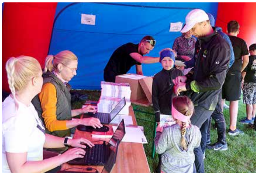
Viimsi Jooksule saab end registreerida kuni 8. maini.

11. mail toimuv 36. Viimsi Jooks toob kaasa ka liiklusmuudatusi. Seoses