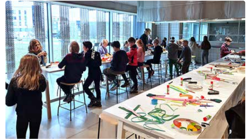
Viimsi kunstikooli õpetajate poolt läbiviidud töötuba Viimsi Artiumis.

tubades avastasid õpilased põnevaid teemasid, alates aerodünaamikast kuni DNA eraldamiseni välja.