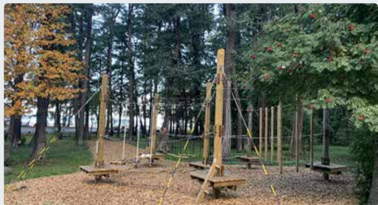
2021. aasta kaasava eelarve häälituse võitnud madalseiklusrada.