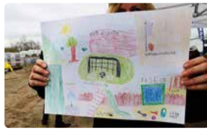
Laste nägemus uuest lasteaiahoonest.