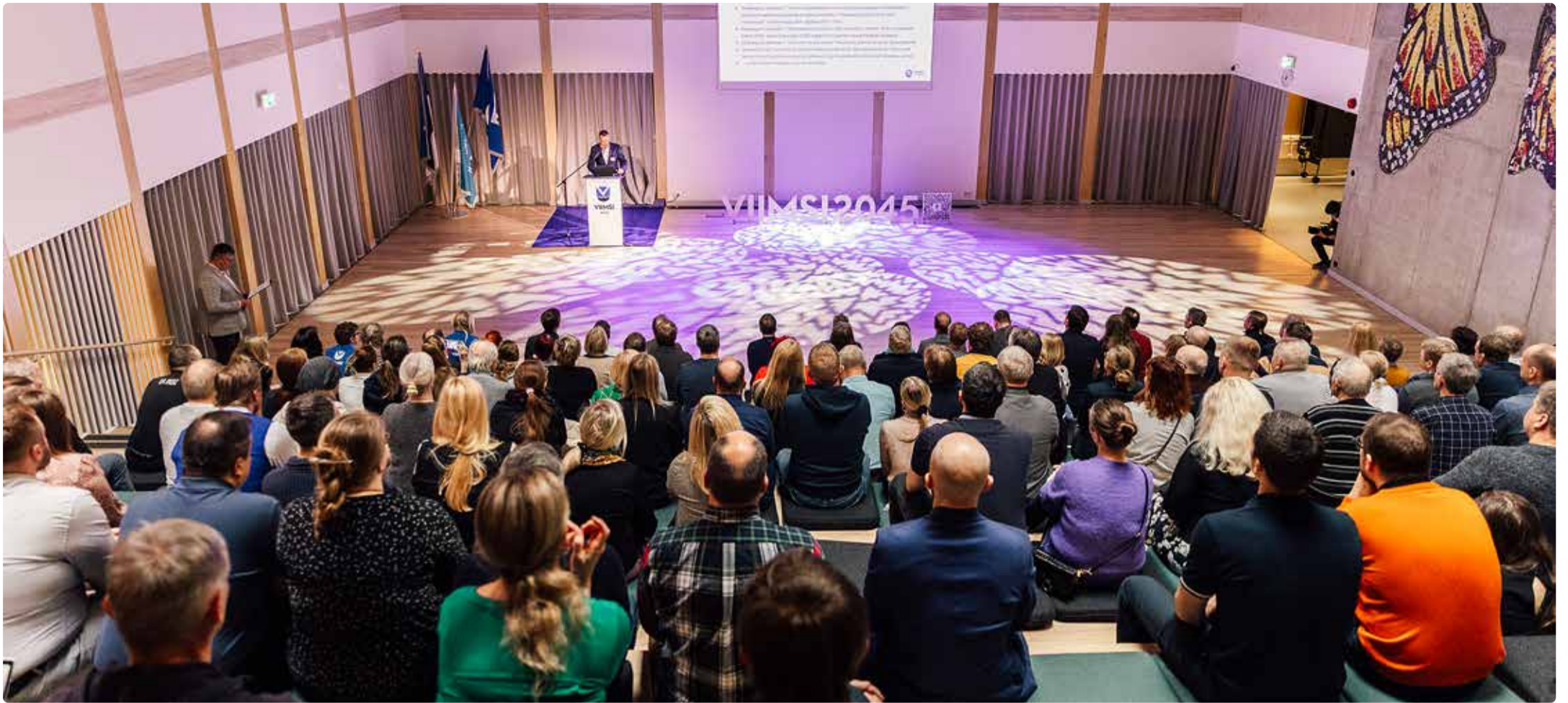
Viimsi visioonipäev tõi kokku peaaegu 200 huvilist.