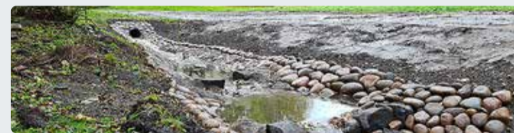
Projekti üks näidisaladest Viimsi mõisa pargis.