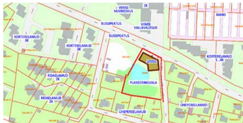
Detailplaneeringuala asukoht. Joonis: AB Artes Terrae OÜ

Lähiajal korraldab vald detailplaneeringule avaliku väljapaneku, selle aja jooksul saavad kõik soovijad esitada uuendatud planeeringulahendusele oma ettepanekuid ja arvamusi. Info detailplaneeringu avaliku väljapaneku toimumise aja ja koha kohta avaldatakse ajalehtedes Viimsi Teataja ja Harju Elu ning valla kodulehel.