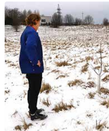
600 õunapuuga õunaaed.