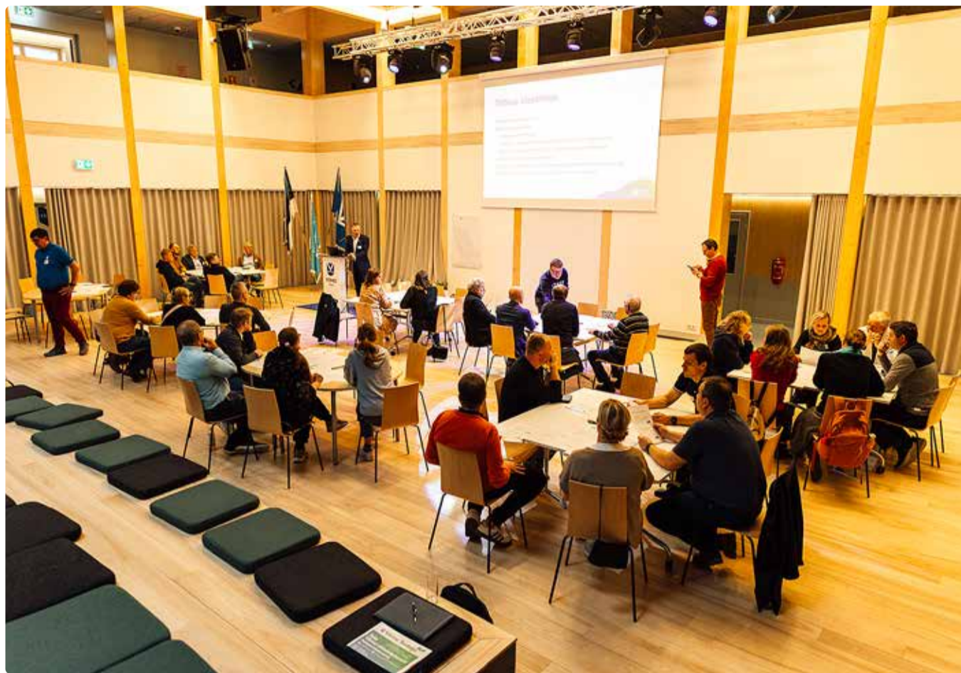
Ettevõtluse töötoas osales suur hulk viimsilasi.

• A-stsenaariumi kohaselt ammentub piirkondlikult ühtlasem konservatiivne rahvastikukasv 2036. aastaks ja ettevõtteid ning töökohti lisandub valla territooriumile hajusalt üksikute kinnistute kaupa. Püsib tugev igapäevaelu loimetus pealinnapiirkonnaga, säilib suur tööränne.