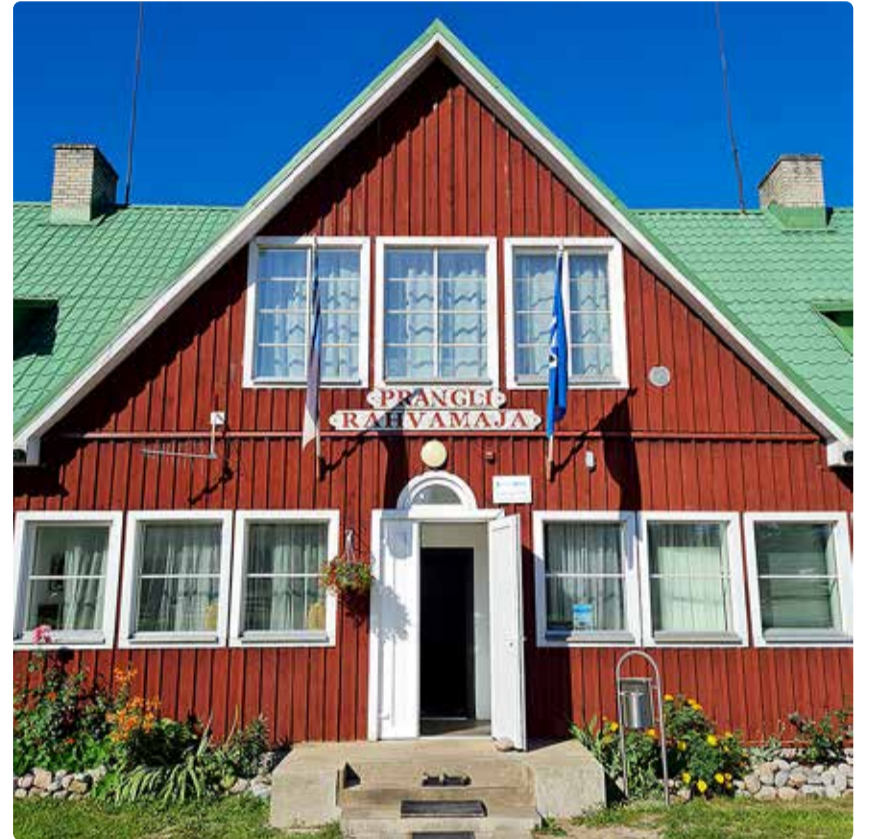
Prangli rahvamaja.

Rahvamajas toimub aastas üle 40 ürituse – talvel vähem, suvel rohkem. Koos tähistatakse tähtpäevi ja teisi traditsioonilisi üritusi. Näiteks on Prangli spordipäev iga-aastaselt erilisel oodatud ja väga populaarne nii saare rahva kui ka nende sõprade seas ning seda juba aastast 1961. Nagu ikka käivad meil esinemas ka armastatud lauljad ja muusikud, korraldatakse las-