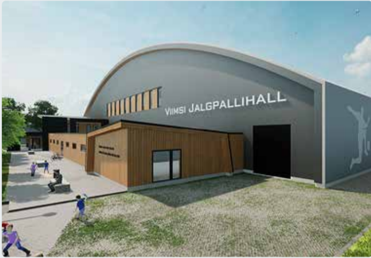
Planeeritav jalgpallihall.