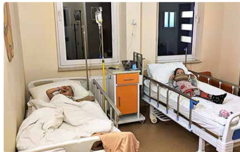
“Puhkus” puhkuse sees – paar ööd Poola lastehaiglas.

Tunnistan, et haagisega reisimine pole igaühe jaoks. Meie oleme pikad reisid teinud kõik kämpingupeatustega, sest vähemalt esialgu pole me Arvisse ehitatud mingit dušisüsteemi. Ka meeldib mulle tualetis vett peale tõmmata, mida kämpinguta eriti teha ei saa... Kolm päeva mõne järve ääres Eesti metsas olla pole muidugi mingi probleem, kui tead, et pärast koju sauna ja duši alla saad. Mõne jaoks on selline eluviis kindlasti ületamatu ebamugavus, aga mitte meile. Leia-