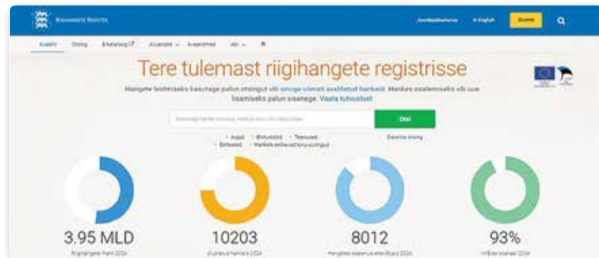
Riigihangete kohta leiab infot veebilehelt riigihanked.riik.ee/rhr-web/#/

Riigihangete protsessi edukas läbiviimine nõuab hankijatelt ja pakkujatelt pühendumust, läbipaistvust ja vastutustundlikkust. Riigihangete protsess algab tavaliselt hanketeate avaldamisega riigihangete registris, millele järgneb pakkumuste esitamine, hindamine ja lepingu sõlmimine eduka pakkujaga. Hankemenetluse käigus tutvuvad pakkujad hankija poolt hankeesemele ettevalmistatud dokumentidega, milles on kirjeldatud tööde või asjade omadused, nõuded, tingimused, vaja-