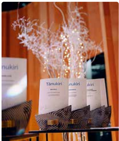
Tunnustamise tänuõhtu toimub 20. detsembril.

Aasta spordipreemia. Viimsi valla spordi aastapreemia eesmärk on tun-