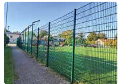
Mõisapargi staadioni piirdeaed.

Mõisapargi staadioni piirdeaiaid, mis olid ajas pallilööjate tõttu kahjustada saanud, asendati tugevda-