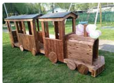
Leppneeme lasteaia uus mängurong.

Kooliesise piirdeaia värvimine oli samuti üks suveprojektidest, mis andis territooriumile värskema ja hoolitsetud ilme. Kooliala välivalgustite vundamentide taas-