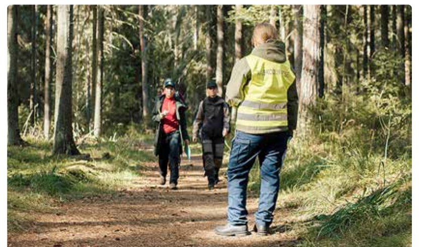
Võistkonnad läbisid 15 kontrollpunkti, mis paiknesid 12 kilomeetri pikkusel rajal.

Täname kõiki, kes ürituse õnnestumisele kaasa aitasid.