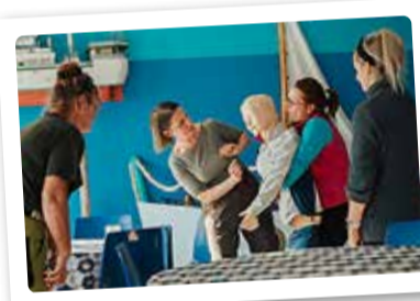
Ühes kontrollpunktis tuli end proovile panna elustamisprotseduuride läbiviimises.

teadmisi Eesti looduses elavate loomade pealuude, nahkade ja sulgede määramisel ning NATO tähestiku ja relvade tundmisel. Samuti tuli kaudsete meetodite abil mõõta rändrahu ja vaenlase kaugust, panna püsti telkmantel, läbida sportlik distants Püüsi kooli staadionil, laduda padrunikesti, demonstreerida laskmistäpsust ning merepäästevahendite kasutamist. Kasutada tuli nii loovust, taiplikkust kui ka keskendumisostust pingelises olukorras.