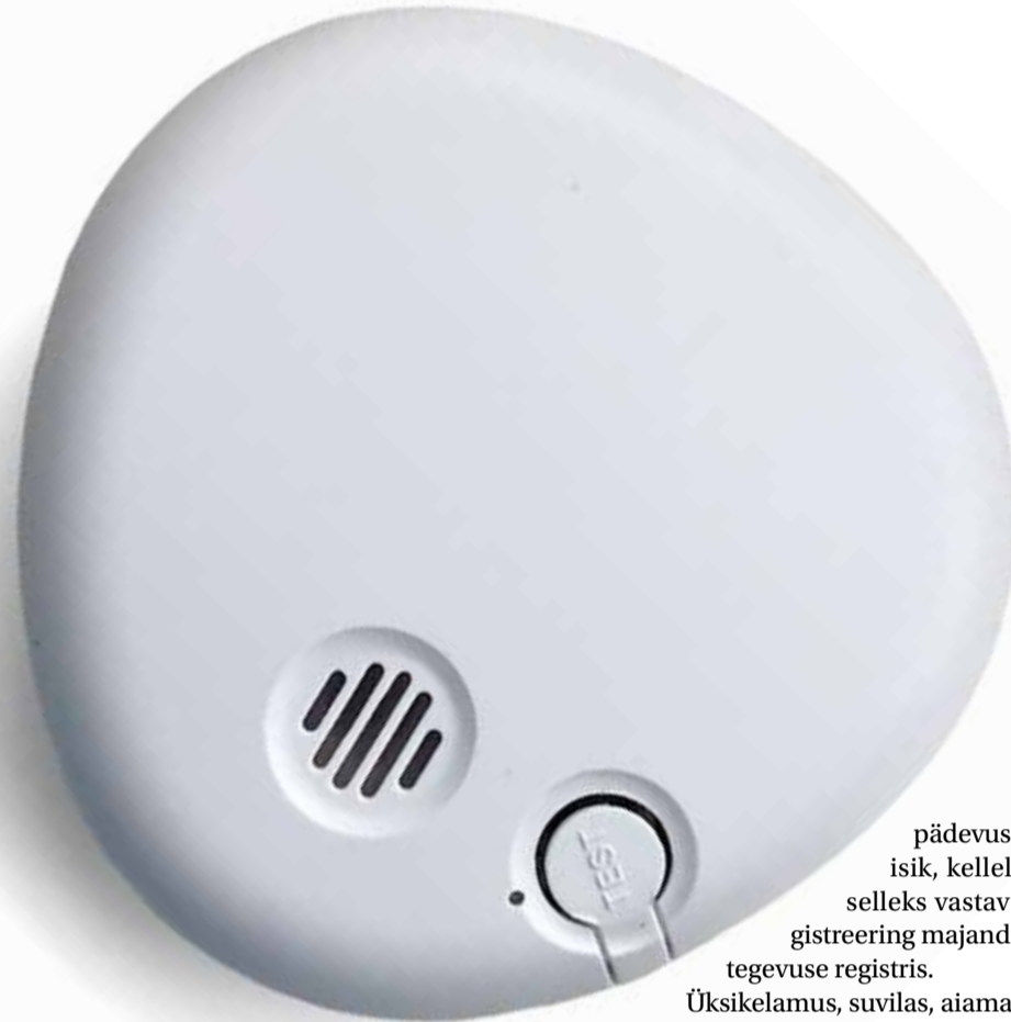
Igas kodus on kohustuslik vähemalt üks suitsuandur.

Ehitatud küttesüsteemi seisukorda, selle nõuetekohasust ja ohu-