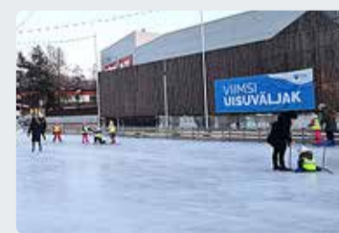
Ka tänava tuleb Viimsisse uisuväljak.

■ Vallavalitsus kinnitas 18. septembri istungil Viimsi uisuväljaku järgmise kolme aasta teenusepakkujaks Ice Cycle OÜ.