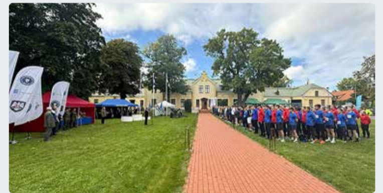
Kindral Laidoneri XXV olümpiateatejooksul osales 44 võistkonda.