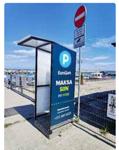
Leppneeme sadama makseautomaat.

Viimsi Halduse suvi oli täis suuremahulisi töid, mille eesmärk oli tõsta valla avalike hoonete ja rajatiste funktsionaalsust ja turvalisust ning teostada hoonetes viibivate inimeste heaolu ja tervist. Koolid, lasteaiaid ja muud objektid on saanud värskendusi, mis loovad paremad tingimused nii õppimiseks kui ka vaba aja veetmiseks. Viimsi Halduse südameasi on meie unikaalse elukeskkonna parendamine ja meie kogukonna heaolu suurendamine.