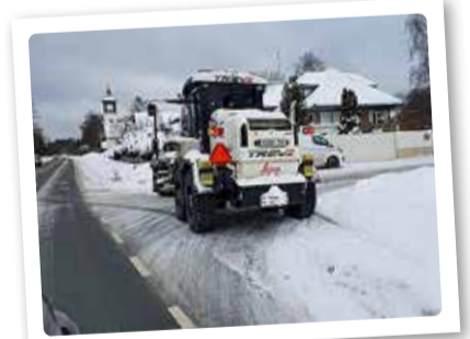
Talihooldel periood on kokku 5 kuud ehk 16. novembrist 15. aprillini.

Valla teehooldajat on võimalik saada kätte ööpäevaringselt telefonil 5301 5855 ning e-posti teel teehooldus@viimsi.ee.