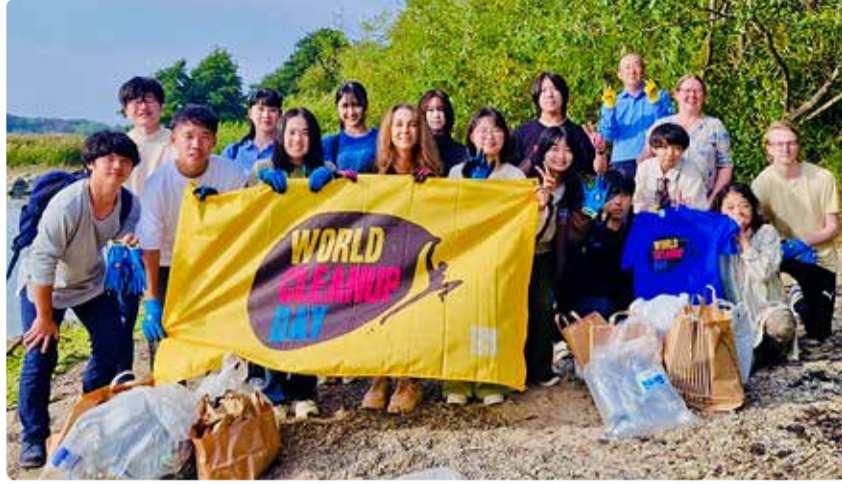
Maailmakoristuse aktsioon Viimsis koos jaapanlastega.

Jaapani N/S High Schooli õpilased külastasid Eestit õppekursiooni raames ning osalesid vabatahtlikult koristusaktioonis. Sündmuse korraldajaks oli MTÜ Let's Do It World (LDIW), kes juhib ülemaailmset koristuspäeva kampaaniat, mis on saanud inimkonna ajaloo suurimaks kodanikualgatuseks ning oli sel aastal kantud ka ÜRO kalendrisse. Liikumine ühendab 211 riiki ja territooriumi (95% ÜRO liikmesriikidest) ning üle 100 MIO miljoni vabatahtliku, kes kõik püüdleavad puhtama planeedi poole.