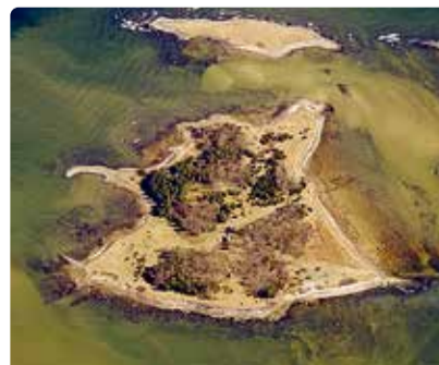
Vaade Kräsuli saarele.

Vald nõustub, et kõnealuses menetluses on esinenud puudusi. Vald ei kaalu otsuse edasikaebamist ning jätkab menetlusega, juhindudes kohtuotsusest.