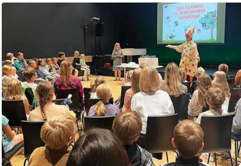
Suvelugemise lõpupeole kutsuti tänavu lausa 80 last.

Agas see polnud veel kõik. Nimelt tekkis juba kolmandat korda raamatukokku just juuniku alguseks üks väärrikas lugemispuu, millel tugev tüvi ja võimsad oksad, aga puudusid lehed ja viljad. Mida teha? Muidugi lapsed appi kutsuda! Ja nii oligi, et igaüks kirjutas loetud raamatu autori ja pealkirja lehe- või viljakujulisele paberile ning riputas selle puu külge vastava teemaga oksale. Kui küsimustele vastatud ja paberid puule riputatud, löi raamatukogutöötaja iga loetud raamatu kohta lugemispassi naeruseise näoga templi, mis tõi naeratuse ka meie väikeste lugejate nägudele. Sest oli ju teada, et kui