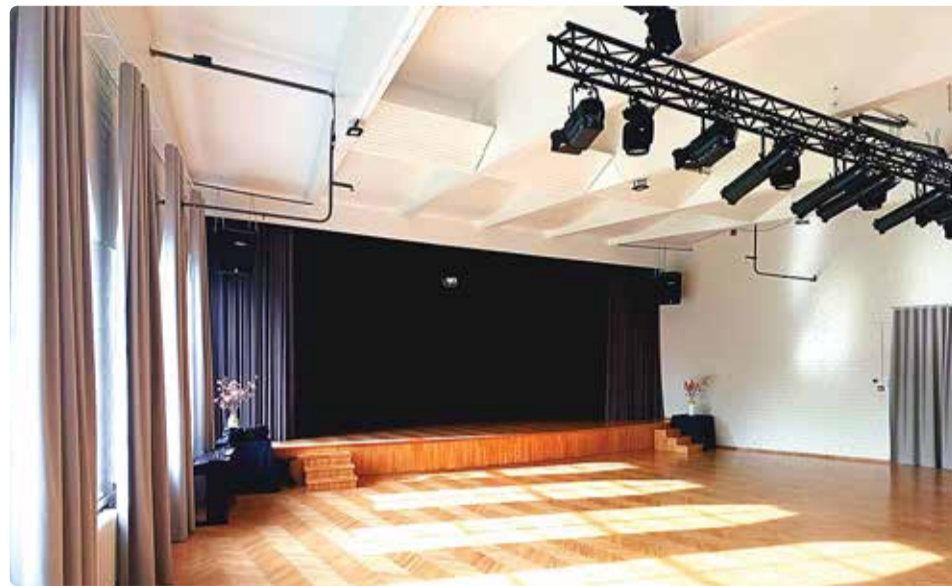
Värskenduse saanud Viimsi huvikeskuse suur saal.