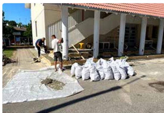
Värskendati Püüsi kooli välitreppe.