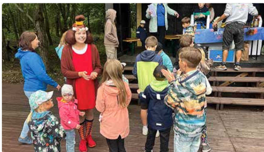
Laste rõõmuks oli kohale tulnud ka koeratüdruk Lotte.

Seekord toimus üritus septembri kesk- ja lõpus. Pilvine taevast ja veidikeseks ka väike seenevihm peresid ei heidutanud ning kohale tulnud lapsed ja nende vanemad said Lubja külaplatsil lõbusalt toimetada.