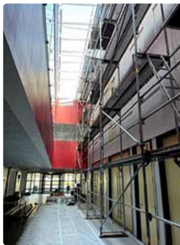
Remonttööd toimusid ka Haabneeme koolis.

tustöö oli vajalik, et tagada püsiv ja ohutu valgustus õhtustel aegadel. Värskenduse said ka koolimaja ümbruses asuvad õuepingid, mis muudavad puhkealad õpilastele meelepärasemaks.