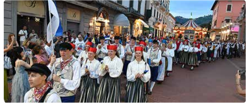
Rongkäigus Montecatini Terme peatänaval.

Toimus kaks kontserti ja rongkäik, kuid jäi ka piisavalt aega tutvuda linnaga: sõita köisrongiga mäe otsa, kust avanes imeline vaade, käia ujumas, nautida kohalikku toitu. Ühel päeval tehti käik Pisasse, mõned jõudsid ka mereranda. Seltskond oli tubli ja usume, et vaatamata harjumatu temperatuuridele (+35 °C ringis), tagasilennu tühistamisele ning sellega seotult ühele lisapäevale Bolognas meie tantsijad ei heitunud ja igatüüli kaasa võtta kuhjaga toreid mälestusi ja kogemusi.