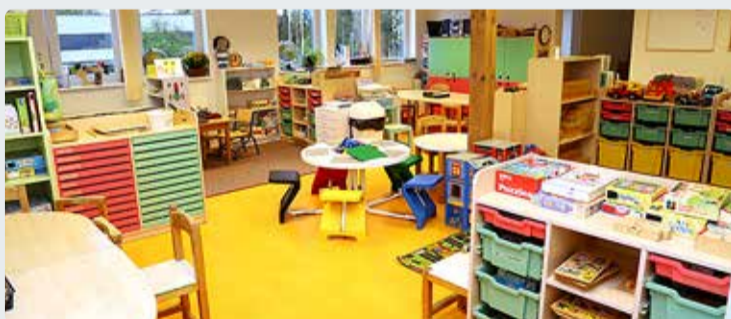
Viimsi elanikele on lasteaia kohatasu endiselt 73 eurot.