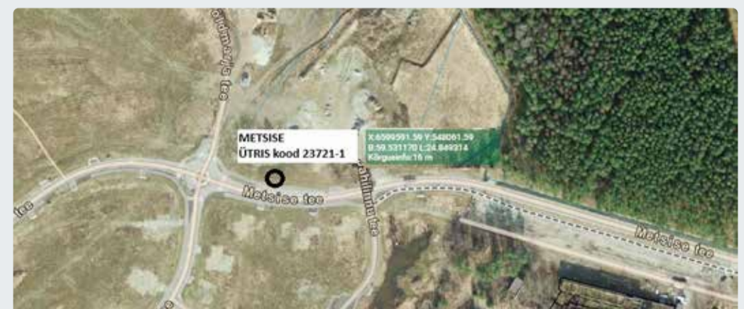
Joonis 4. Uus kohanime: Metsise.

Lubja külas Metsise teele ehitatud uuele bussipeatusele kohanime määramine. Uus kohanime: Metsise (joonis 4).