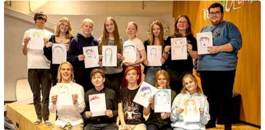
Viimsi noortevolikogu hetkekoosseis.

Kui sa tunned, et soovid kaasa lüüa noortevolikogu töös, siis nüüd on selleks hea võimalus. Nimelt on avatud kandideerimine Viimsi noortevolikogu uude koosseisu. Kandideerida saab ajavahemikus 2.–15. septembrini.