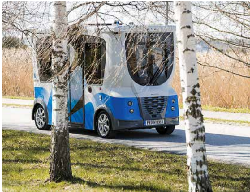
16. septembrist 11. oktoobrini võib Haabneeme alevikus märgata sõitmas ilma juhita busse.

Vallavalitsus kinnitas plaani alustada 16. septembrist isesõitva bussi katsetamist Haabneeme alevikus.