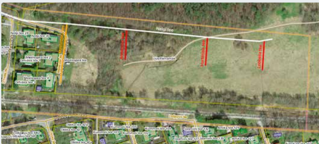
Joonis 1. Uued kohanimed: Anemooni tee, Hortensia tee, Lobelia tee.

Viimsi alevik, Uus-Pärnamäe kinnistu detailplaneeringuga planeeritud liikluspindadele ja teravteedele kohanime määramine ning detailplaneeringu alusel moodustatavatele uutele katastriüksustele aadresside määramine. Uued kohanimed: Anemooni tee, Hortensia tee, Lobelia tee (joonis 1).