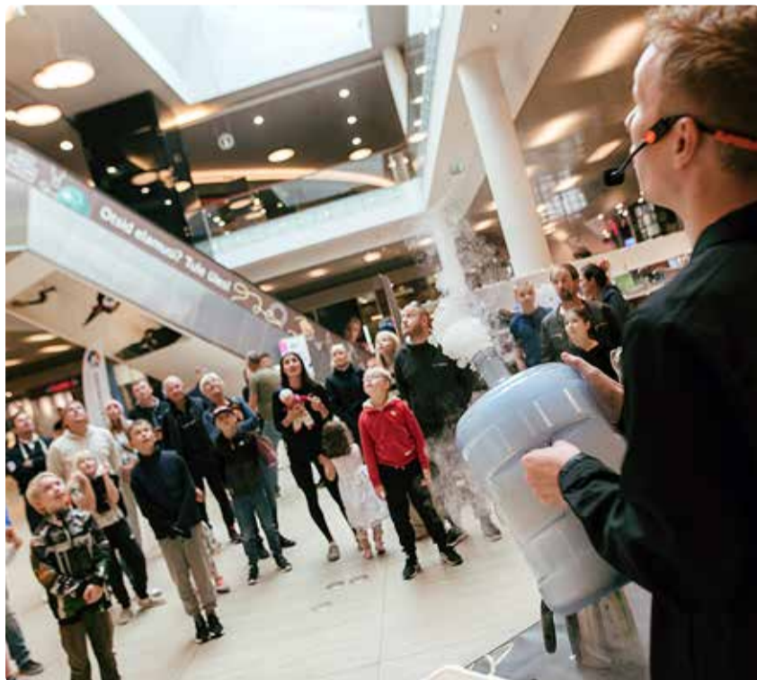
Koolialguse peol loovad meeleolu erinevad esinejad.

Virtuaalreaalsuse korvpall, reaalsioonisein ja muud atraktsioonid on suurepärane võimalus oma oskuste proovilepanemiseks ja lõbusa mängurõõmu nautimiseks. Korvpalli- ja jalgpallivõistlusi aitavad läbi viia Viimsi korvpalliklubi ja jalgpalliklubi.