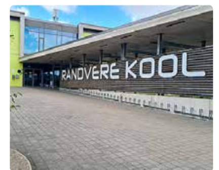
Randvere kool.

Meie kavandatud tegevusega saab tutvuda ja meile annetusi teha veebilehel www.randvereharidus.ee , samuti oleme leitavad Facebookis ja Instagramis.