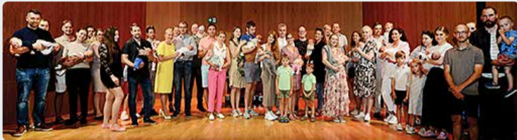
Ühispiilt 14. augustil toimunud uute vallakodanike vastuvõtt.