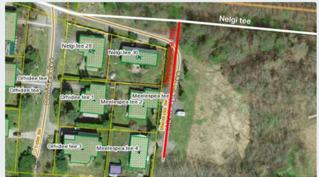
Joonis 3. Meelespea tee liikluspinna ruumikuju muutmine.

Meelespea tee liikluspinna ruumikuju muutmine nii, et see saab alguse muudetavast osast Nelgi tee liikluspinnast (vt eelmine punkt) ja kulgeb vastavalt Viimsi alevik Uus-Pärnamäe kinnistu detailplaneeringule ja joonisele (joonis 3).