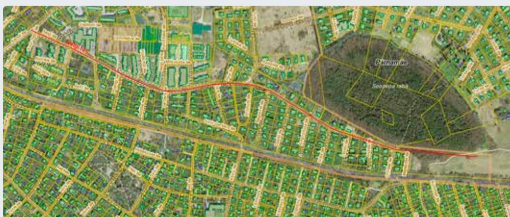
Joonis 2. Nelgi tee liikluspinna ruumikuju muutmine.

Nelgi tee liikluspinna ruumikuju muutmine nii, et see saab alguse Aiandi tee liikluspinnast ja lõpeb Uus-Pärnamäe katastriüksusel vastavalt Viimsi alevik Uus-Pärnamäe kinnistu detailplaneeringu ja joonisele (joonis 2).