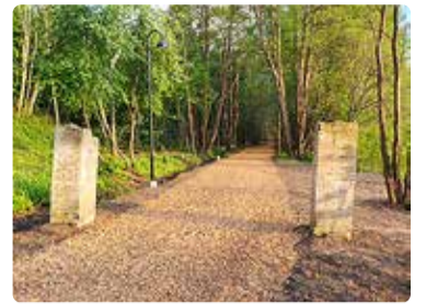
Keelatud tsooni sisenemise värvapunkt ja kunagine aedade vahel kulgenud autotee.

Kui 1994. aastal Vene väed Eestist lahkusid, võeti üle nn korrastatud sõjaväeobjekt, mis ei olnud aktiivses kasutuses alates 1988. aastast. Mahutite ümbrusest tuli likvideerida masuuti ja naftaprojekte. Kütuse metallmahutid likvideeriti toonaste reostusuuringute