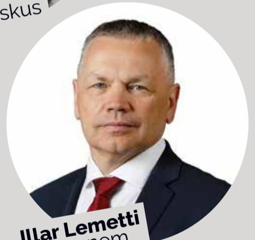
Illar Lemetti vallavanem