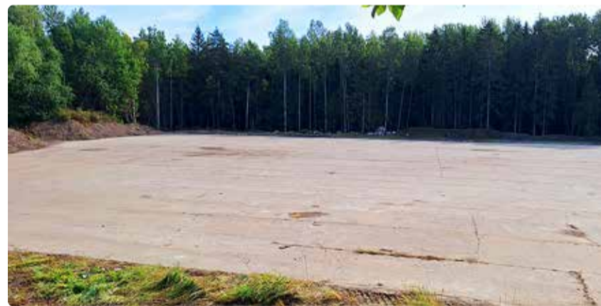
Vaade korrastatud Kompostiväljaku platsile.

Tööde eesmärk oli ala korrastada, muuta ohutuks ja avada üldsusele, et tekiks võimalus liikuda erinevate rekreatsioonialade vahel.