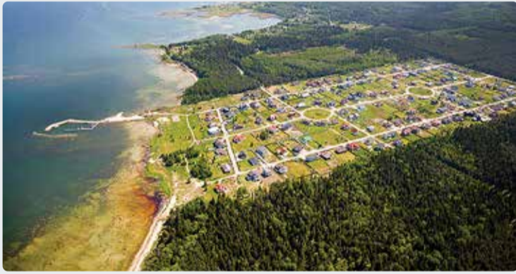
Kelvingi küla linnulennult.