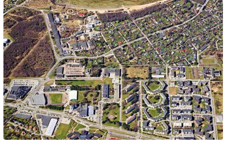
Alusuuring keskendub valla keskusala arengule.

Sotsiaal-majandusliku alusuuringu ettepaneku lähtekohaks võetud üldplaneeringu protsessi raames läbi viidud valla visioonipäeval enamuse osalejate eelistuse pärvinud mõduka rahvastikukasvu ja koduläheduse põhimõtteid kõige tugevamalt esile tõstnud stsenaarium B. See on enim koos-