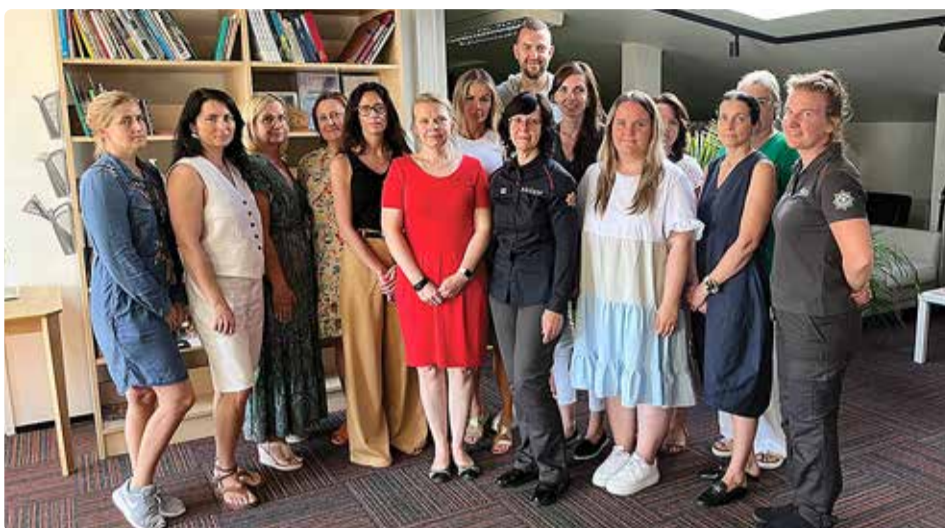
Vallavalitsuse sotsiaaltöötajad osalesid päästeameti korraldatud koolitusel.

Koolituse käigus selgitati erinevaid ohte ning anti juhiseid, mida kodudes (era- ja kortermajades) märgata, et tuleohtlike või