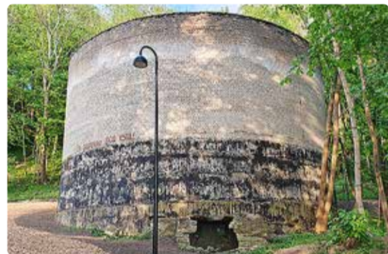
Kütusetünn – seinal olev hoiatus tuletab meelde möödunud aegasid.

Kütuselao ehitus algas 1950. aastate alguses, kui poolsaare keskel oleva Viimsi klindiasangu Haabneeme-poolsele jalamile rajati teed, kraavitus ning ehitati seitse