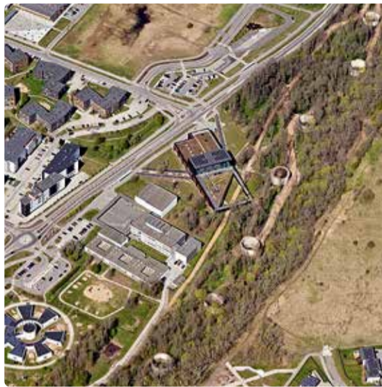
Vaade mahutite ja Karulaugu terviserajale 2024. aastal.

silindrikujulist kütusemahutit. Iga rajatud mahuti kõrgus oli 10 m ja välidiameter 18 m. Arhitektuurilt meenutavad need lai lossi kaitsetorne, mille betoonist või paekivist vundamendi paksus on 60–70 cm ja silikaattelistest ülaosa paksus 51 cm. Ringmüürid peitsid endas 15 m diameetriga metallmahuteid, mille igähe maht oli ca 1800 m 3 . Mahuti esiküljelt väljus kütusetorustik. Kokku mahutasid seitse kütusetorni 12 500 m 3 kütust. Mahutite juurde kaevati tuletõrjete tiik ja rajati pumbajaama hoone, veemahutid – see moodustas koos kustutusseadmetega kütusebaasi tuletõrjelinnaku. Linnakut opereeris kütusebaasi juures tegutsenud tuletõrje- ja päästekomando. Ühe kütusebaasi hoone katusele oli rajatud mere-