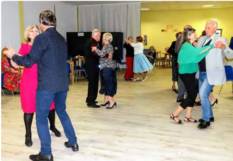
Tantsutuuriid hoogsas rütmis.

Ka kultuurisündmustel on päevakeskuses oma koht. Enamus tähtpäevi saavad tähistatud ja oma