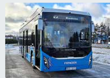
Elektribuss Viimsi teedel.

AS Hansabuss katsetab 5. veebruarist kuni 12. veebruarini Viimsi valla siseliinidel Scania Fencer elektribussi.