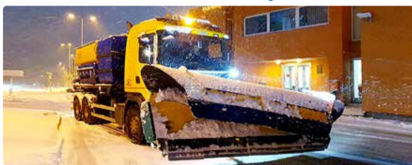
Uue hooldelepingu sõlmimine toimub enne talihooldeperioodi algust.

Möödunud aasta novembris esitas teehooldaja järjekordse taotluse tööde kallinemise kompenseerimiseks, mida vald ei pidanud aga piisavalt põhjendatuks. Arvestades stabiliseerunud ja kohati langenud sisendhindu, mitu kvartalit toimunud majanduslangust ning valdkonna tööpuuduse tõusu, ei