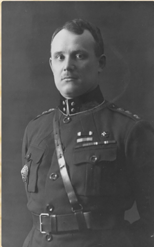
Kindral Johan Laidoner.

Eestisse pöördus Laidoner tagasi detsembris 1918, mil vabadussõda juba käis. Esimene suurem teene Eesti jaoks vabadussõja ajal, mis Laidoner tegi, oli see, et tänu temale jõudis Tallinnasse kohale