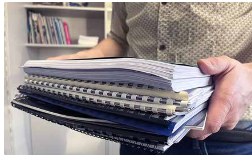
Viimsi vallavalitsuse korraldusega lõpetati kuue detailplaneeringu menetlus.