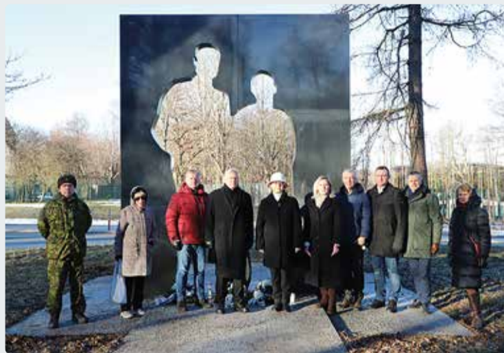
Üritusel osalenute ühisfoto.