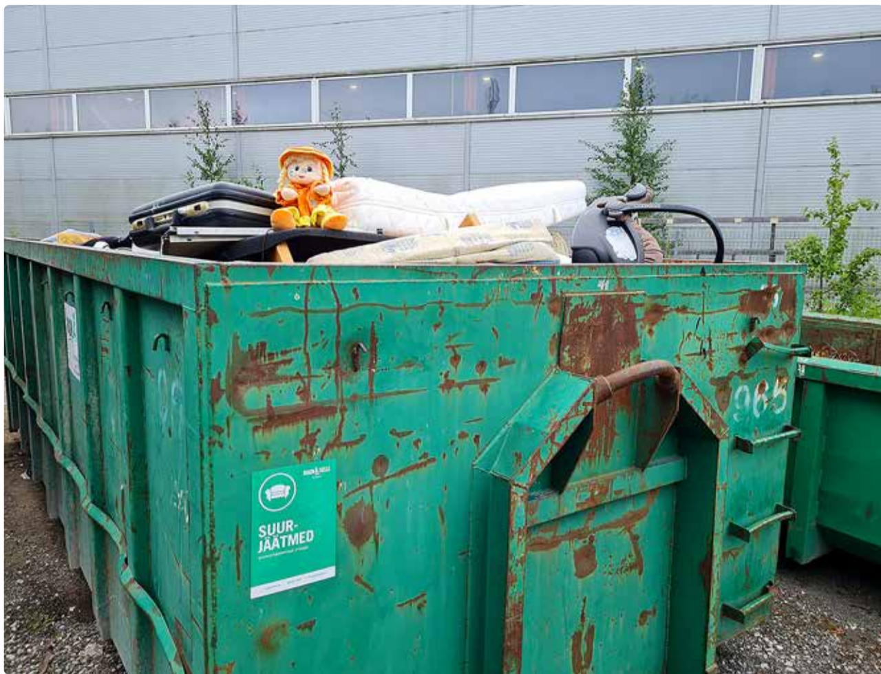
Uus süsteem annab parema ülevaate jäätmete kogustest ja liigist.