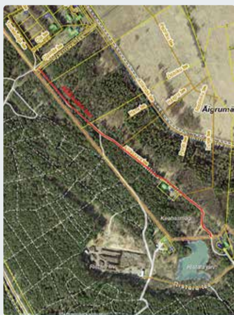
Alliksaare tee liikluspinna ruumikuju muutmine.