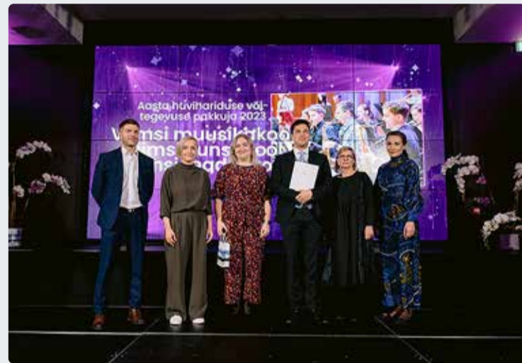
"Noorte Heaks Tänu" tunnustusüritusel.