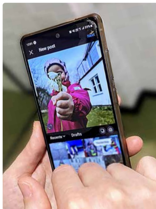
Emotsioonide ajendil tehtud sotsiaalmeediapostitusel võivad olla soovimatud tagajärjed.

Lastega seotud info salvestamine ja jagamine on tundlik ja võib mõjutada otseselt lapse heaolu. Kuigi avalikus kohas võib salvestada ja filmida ilma luba küsimata, ei tohi nõnda saadud materjali hiljem avalikustada ilma nõusolekuta. On muidugi erandeid, mis tulenevad enamasti ametnikest, kes täidavad avalikke ülesandeid, kuid ka see ei anna automaatselt õigust avaldada lastekaitse tegevusega seotud materjali sotsiaalmeedias või muul avalikul platvormil.