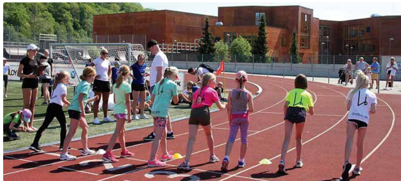
Toetusi eraldatakse 1582-le noorele spordiharrastajale.

TOETUS 31. jaanuaril Viimsi vallavalitsuses vastu võetud otsusega suurendati valla eelarvest spordiklubides treenivate Viimsi 7-19-aastaste harrastajate sporditegevuse toetuse baassummat.