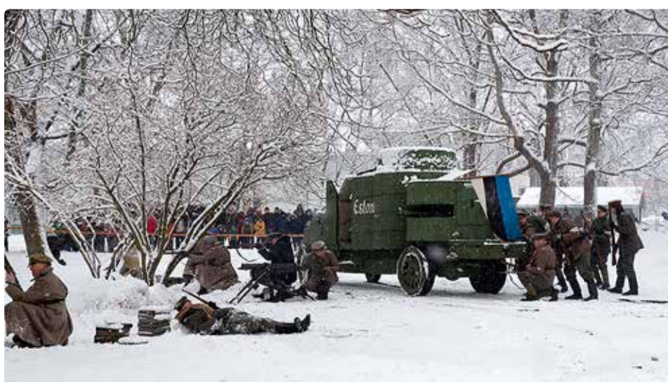
Vabadussõja näidislahing möödunud aastal.