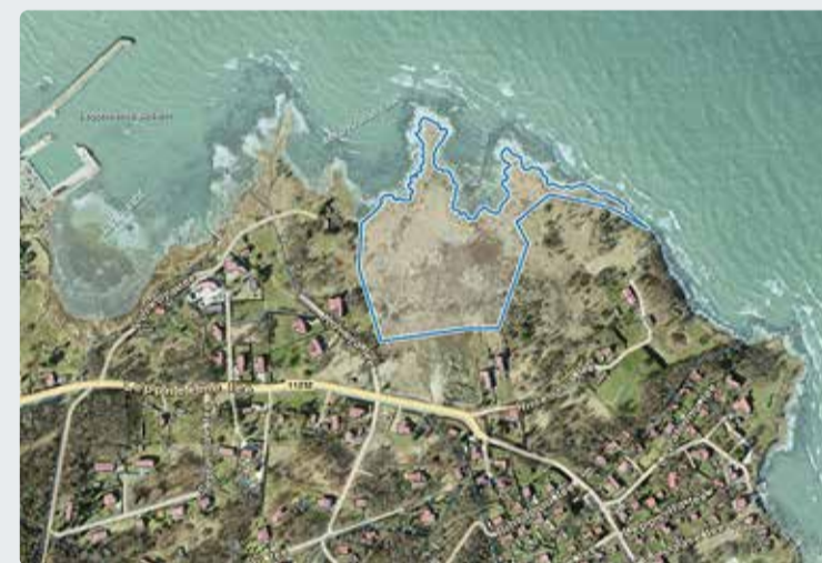
Leppneemes asuv Võrkaia maaüksus. Maa-ameti ortokaart