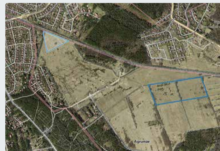
Metsavahi ja Liiva kinnistute paiknemine. Maa-ameti ortokaart