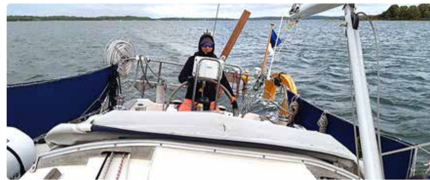
Just purjetamas olles jäi Merilinile silma Viimsi Teataja toimetaja töökuulutust.

Kui seda siin kirjutan, siis tuleb see tunne jälle väga ehedalt meelde, milline metsik töötempo kogu aeg peal