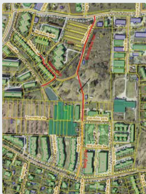
Kannikese tee ja Nelgi põigu ruumikujude muutmine ning uue kohanimega Roos'i põik liikluspinna ruumikuju.