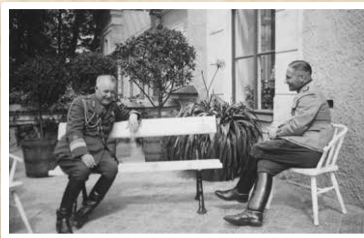
Kindral Johan Laidoner ja Soome sõjavägede juhataja kindral Hugo Österman Viimsi mõisa härrastemaja terrassil 1938. aasta suvel.

Pärast vabadussõja lõppu järgnes Laidoneril poliitiline elu ja ta andis nõusoleku kandideerida riigikogu I koosseisu Põllumeeste Kogude nimekirjas. Järgnevalt osutus ta riigikokku valituks ja tuleb mainida, et Laidoner oli ka riigikogu II ning III koosseisu liige. Parlamendis jõudis ta olla nii riigikaitse-, välis- kui ka rahanduskomis-