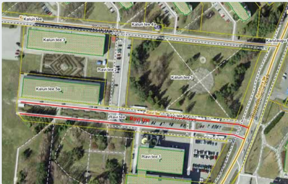
Ravi tee liikluspinna ruumikuju muutmine. Kaardid: Maa-amet

Vt lisainfot ja korralduse eelnõud Viimsi valla kodulehel www.viimsivald.ee/aadressiandmed .