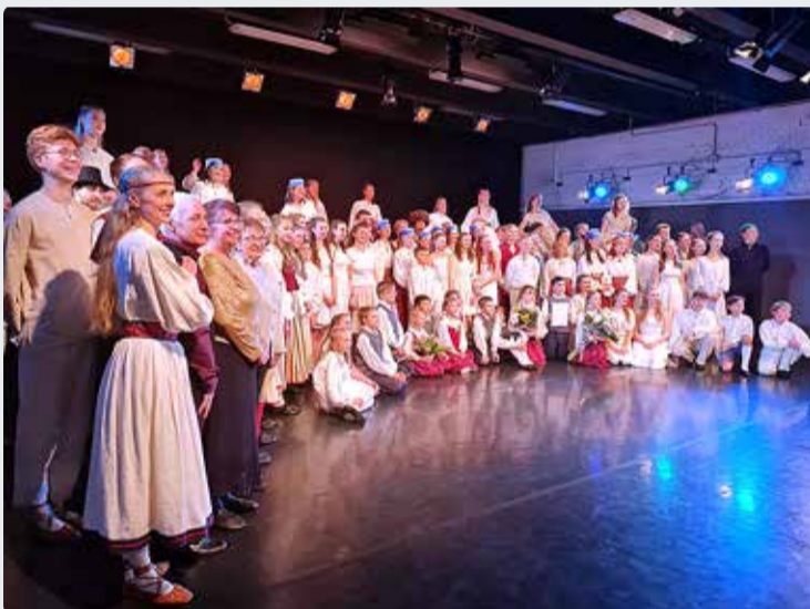
Kontserdil astusid üles kõik Lee tantsurühmad.