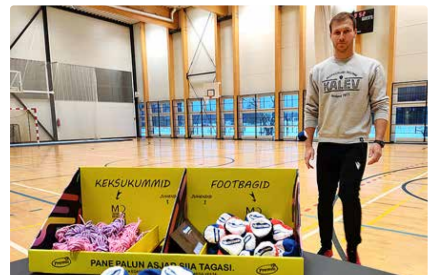
Jalgpallur Ragnar Klavan nüüd juba Haabneeme koolile kuuluvate keksukummide ja footbagidega.

Haabneeme koolipere on tänulik nii Tallinna Moon Rotary klubile, projekti eestvedaja Allan Ameljušenkole ning muidugi kõikidele suure südame ja hooliva meelega annetajatele, kelle ta meil täna koolis selliseid võimalusi vahetunde liikumismängudega sisustada ei oleks. Ühtlasi kutsume kõiki meie valla kooli üles kaaluma võimalust sarnaste projektidega liituda.