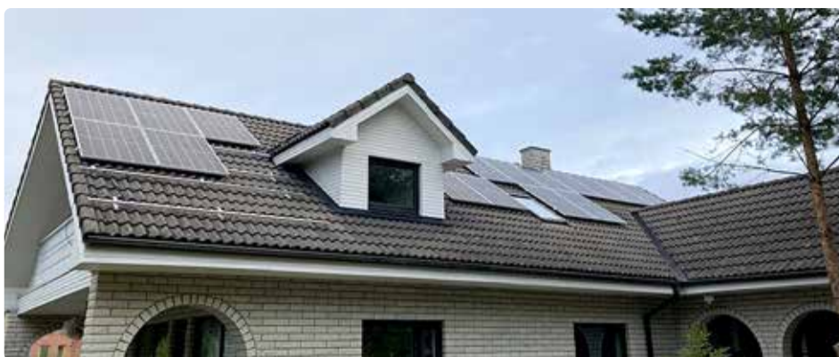
Viimsi vallas menetleti eelmisel aastal päikesepaneele kokku 193 korral.

Eraldi maapinnal seisvad päikesepaneelid on ehitusseadustikust tulenevalt eraldiseisev elektritootmisrajatis ja selle rajamiseks