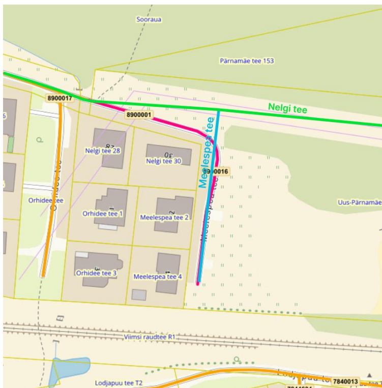
Joonis 3.2. Meelespea tee terviktee uus ruumikuju on tähistatud sinise värviga.