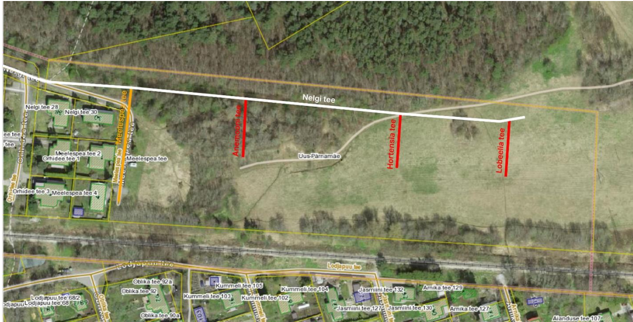
Joonis. Uute kohanimedega Anemooni tee, Hortensia tee ja Lobeelia tee liikluspindade ruumikujud on tähistatud punase värviga. Teiste muudetavate liikluspindade ruumikujud on tähistatud valge ja oranži värviga.