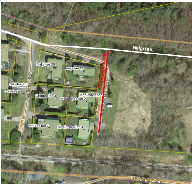
Joonis 1.2. Meelespea tee liikluspinna uus ruumikuju on tähistatud punase värviga.