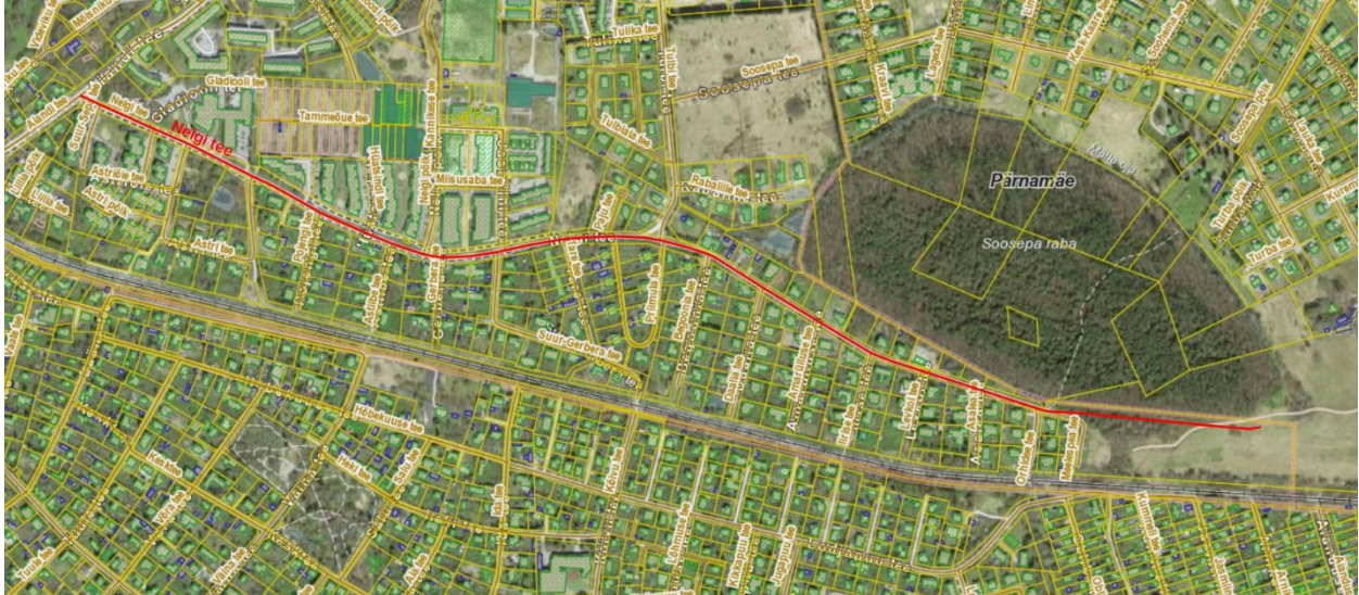
Joonis 1.1. Nelgi tee liikluspinna ja terviktee uus ruumikuju on tähistatud punase värviga.