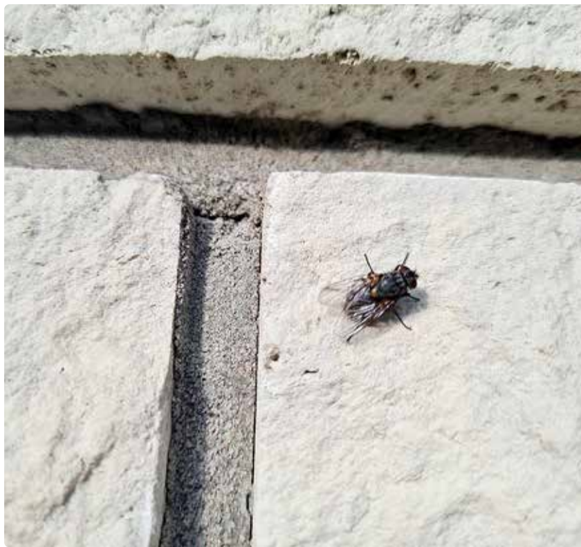
Ka kärbes võib jätta endast maha sügeleva tursega hammustuse.

Välgi aktiivseid hammustusaegu. Sääsed on kõige aktiivsemad päikesepäevade ajal, seega planeeri välitegevused vastavalt.