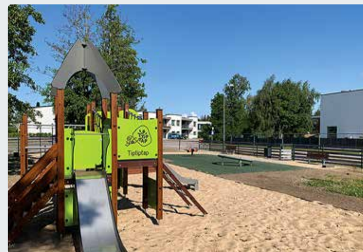
Värskest avatud Kuldkinga haljaku mänguväljak.