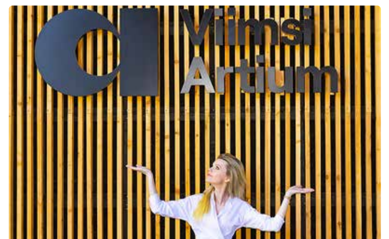
Üks viis puhkamiseks on kultuurisündmuste küllastamine.

Sa töötad pea pool aastat Viimsi vallavalitsuses juristina. Milliste teemadega igapäevaselt tegeled?