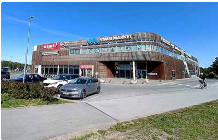
Viimsi Marketi väliparkla.

Kamberg Loodame, et saame pakkuda keskuse külastajale võimalikult mugavat külastuskogemust, nii raamatukogu külastusel kui ka igapäevaostude sooritamisel.