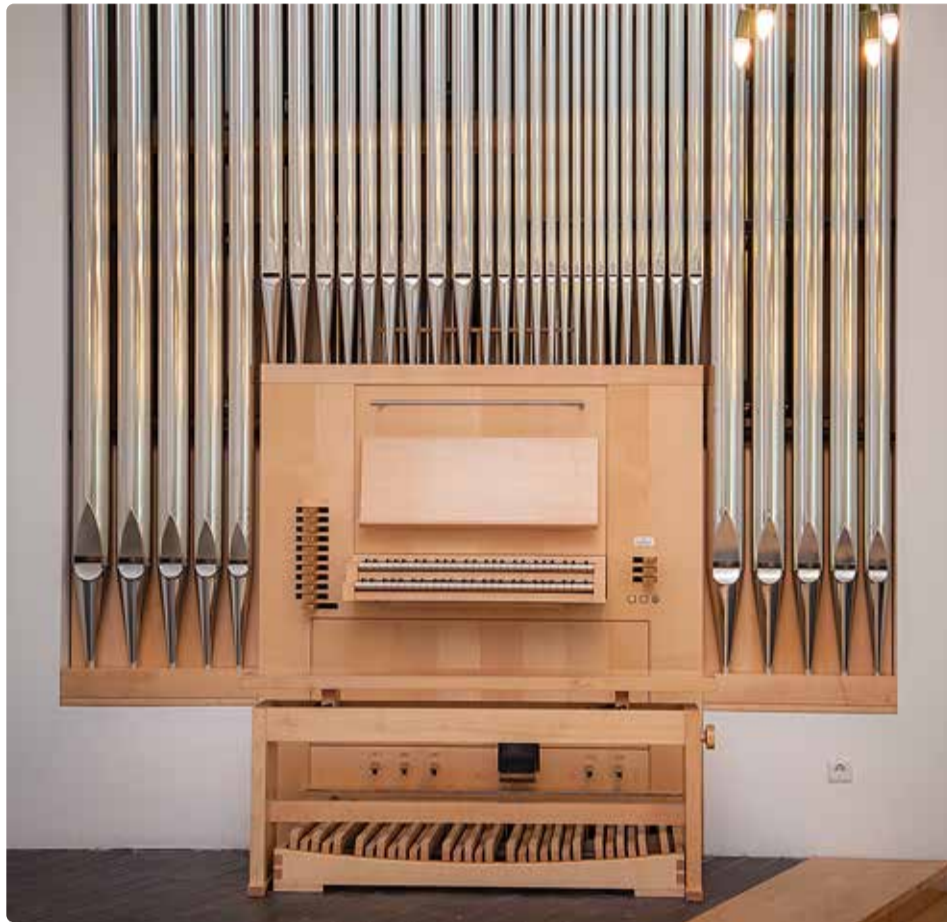
Juba kuus aastat on see orel meid rõõmistanud.