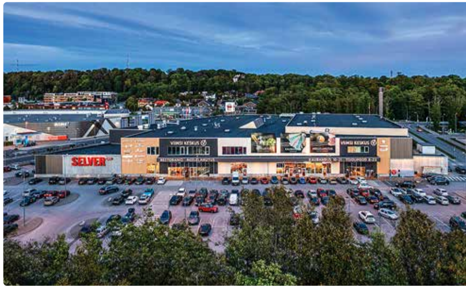
Viimsi Keskuse parkla.

Kamberg Viimsi Marketi puhul tuleb eristada kahte parkimisala: maja ees asuv väline parkla ja 0-kor-