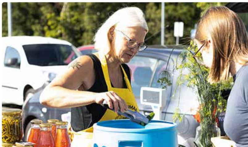
Üha rohkem viimsilasi leiab tee OTTile.