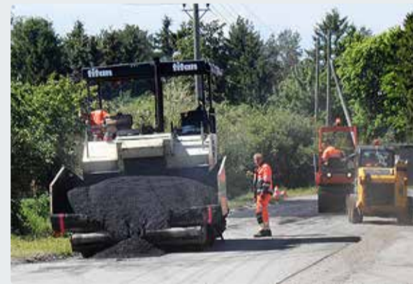
Algavad iga-aastased asfalteerimistööd.