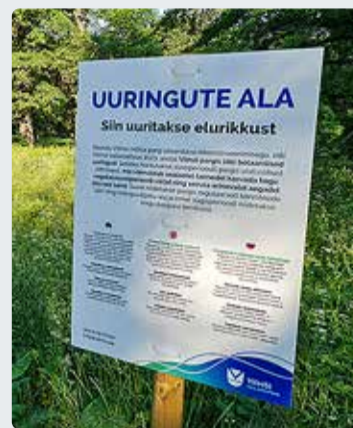
Käesoleval suvel uuritakse mõisapargi elurikkust.

■ Viimsi mõisa pargi rekonstrueerimisprojekti koostamisega alustati käesoleva aasta alguses. Täna on läbi viidud mitmed uuringud – dendroloogiline hinnang, maastikuanalüüs ja ajalooline ülevaade –, lisaks on väljastatud keskkonnameti poolsed lähtetingimused ja muinsuskaitse eritingimused.