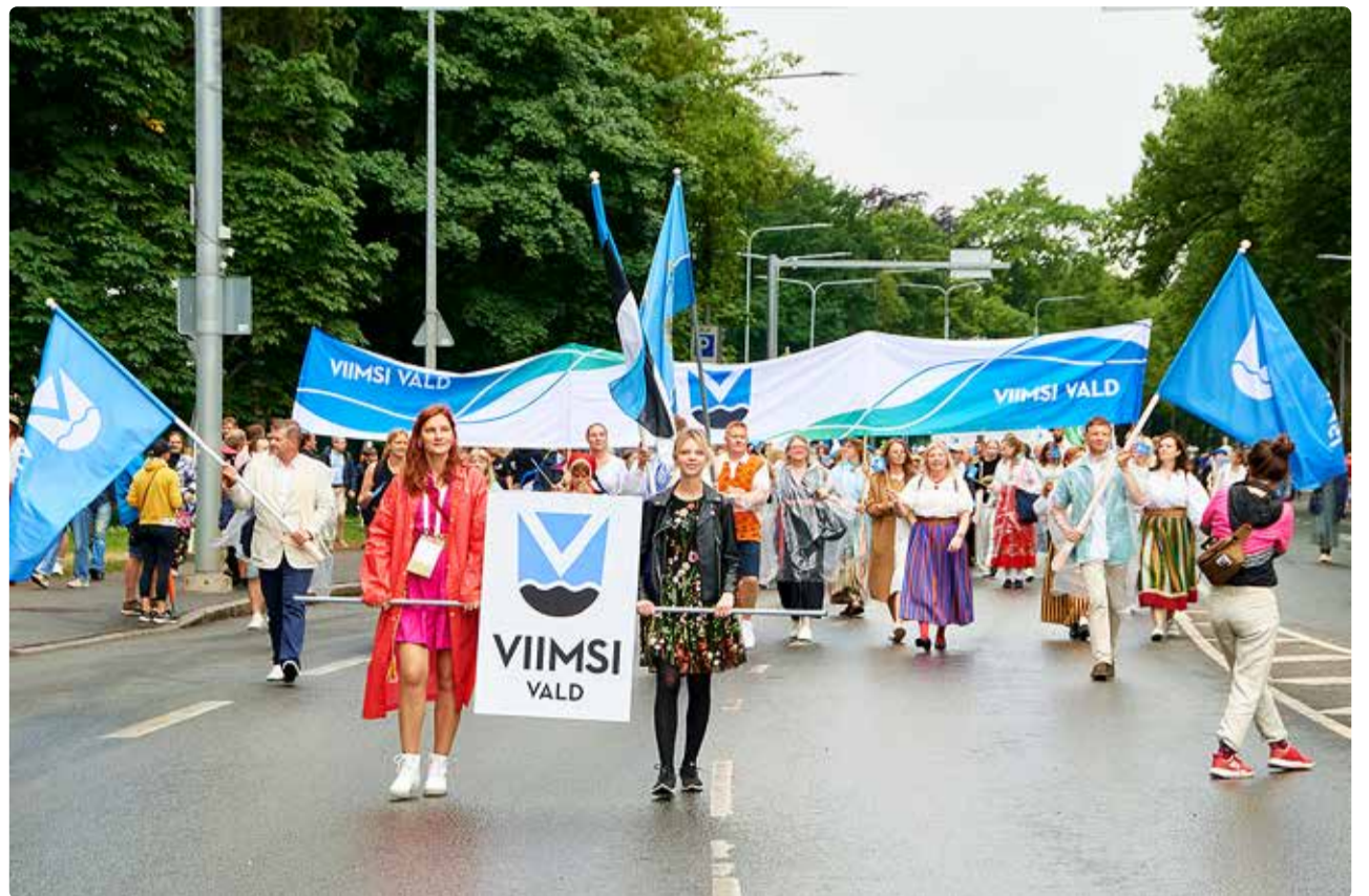
Viimsi valla esindajad laulupeo rongkäigus.