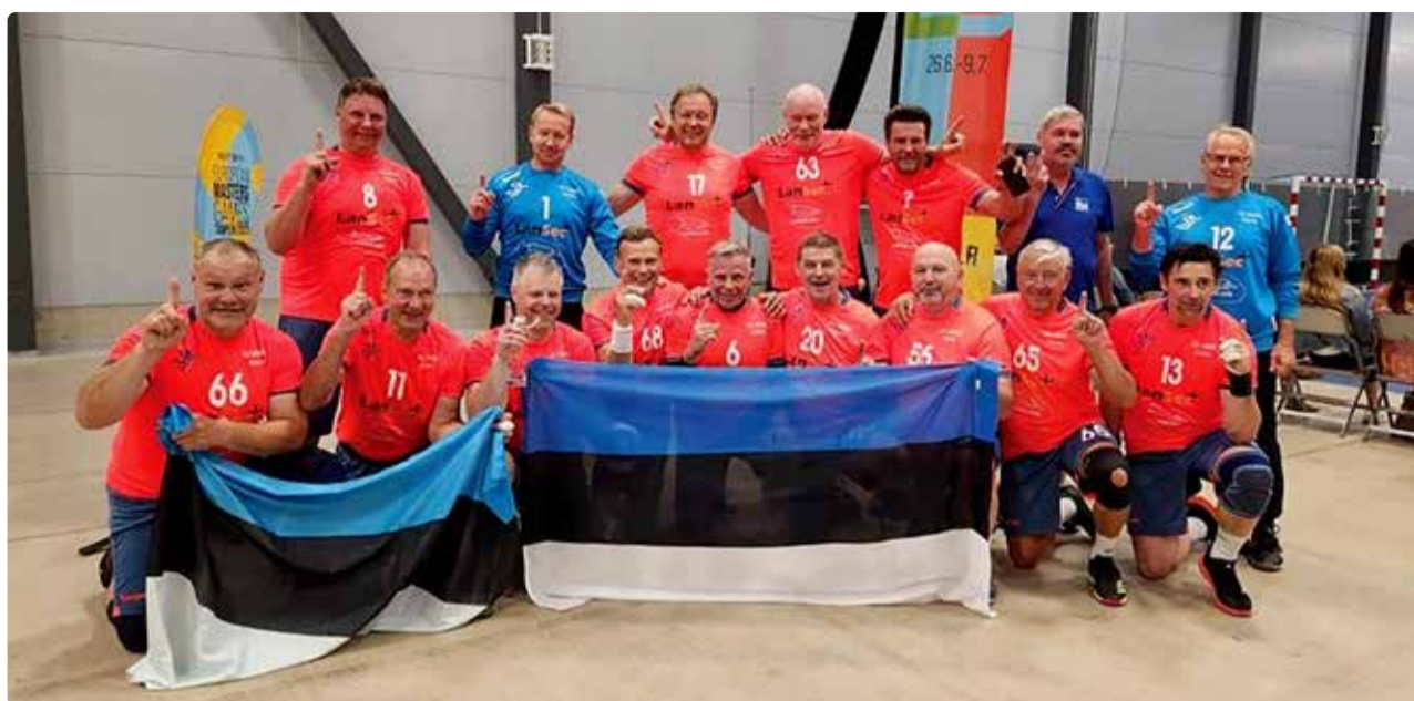
Võidu koju toonud meeskond.