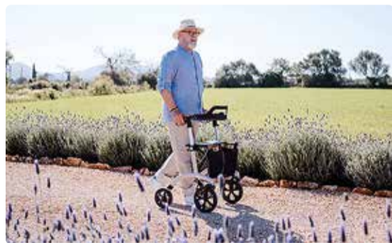
Liikumis-abivahend rulaator.

Pesemistoimingutel võivad olulist abi pakkuda erinevad tugikäpidemed, dušitoolid ja vannistmed, aga ka pika varrega pesunuustikud.