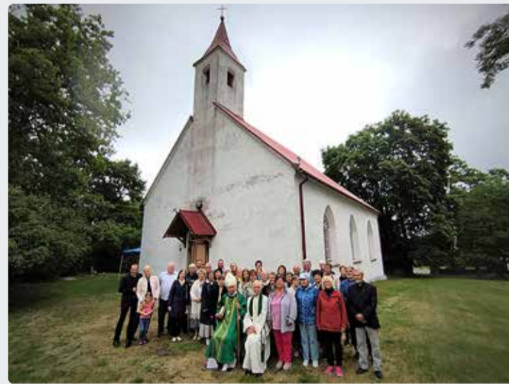
Aastapäeval osalenud kirikulised.