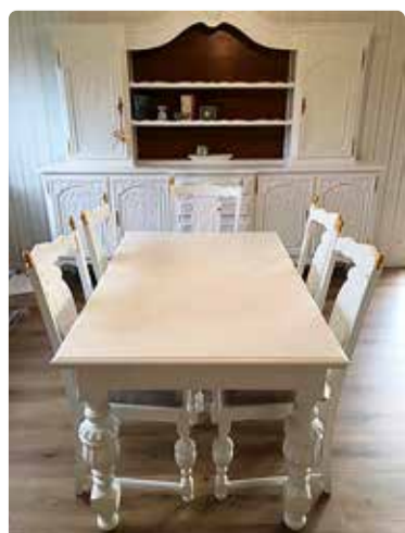
Hele värv annab uue ilme.