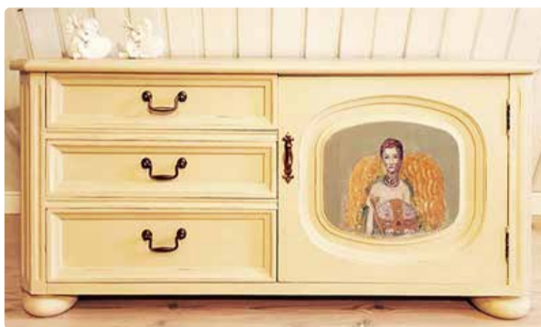
Ilus tulemus pakub rõõmu aastateks.

saab neid soovi korral ka osta. "Vanamööblile uue välimuse andmine on siiski rangelt hobi ning müügitulu läheb uute esemete ning materjalide peale. Pealegi poleks mul kõiki neid valminud projekte küsil väga pikalt hoidagi."