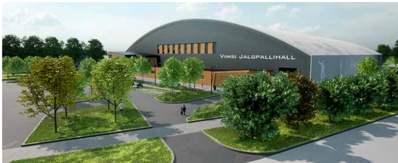
Planeeritav Viimsi jalgpallihall. Eskiis: Arhitektibüroo Tava OÜ

Kui see teema sind huvitab, siis tule kohale ja ma usun, et arutelul saavad kõik küsimused ka vastused. Usun, et avalik arutelu on ka koht, kus esitada omi mõtteid, kuidas lisaks jalgpallile ja kergejõustikule tulevikus seda halli kogukonna jaoks kasutada.