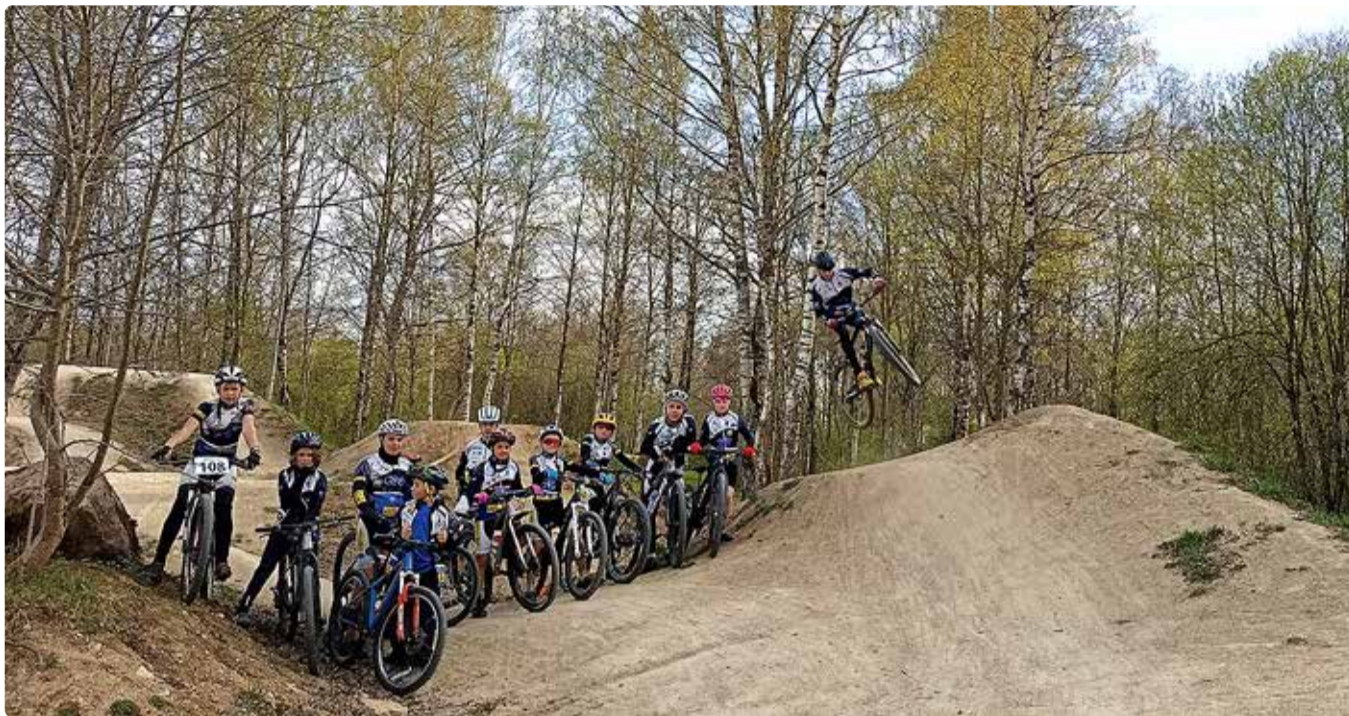
Kalevi Jalgrattakooli kevadlaager Põltsamaal.

Täna on hea meel tõdeda, et Kalevi Jalgrattakooli üks osakond on ka Viimsis, Forus Spordikeskuses Haabneemes, kus on loodud tingimused lastele jalgrattasportiga tegelemiseks ja mitte ainult. Meie koolis õpivad lapsed eelkõige