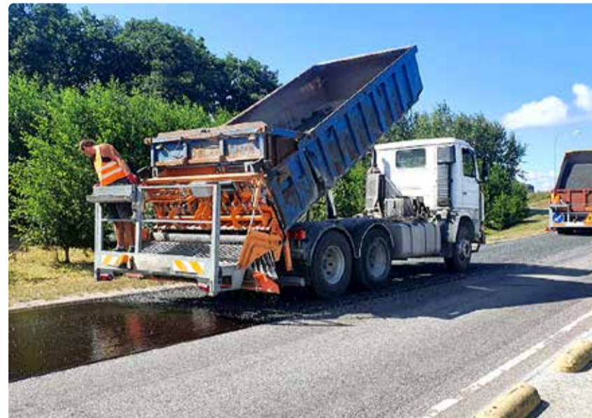
Ühekordse pindamise käigus laotatakse teekate üle bituumeni ja graniitkillustiku kihiga. Pooleteisekordse ja kahekordse pindamise korral kaetakse tee ka teise peenema graniitkillustiku kihiga.

Osaliselt või täielikult saab pinnatud 23 teed, mis moodustavad ligikaudu 21 500 ruutmeetrit teepinda. Pinnatud saavad Suur-Gerbera tee freespurukattega teelõik, Vardi tee 13, 13a põik tee, Viieaia tee, Kaevuaia tee freespurukattega lõik, Rannakalda tee tupik, Riiasõõdi tee ühendus uue arendusalaga, Nelgi põik lõpp, Kesk-Kaare tee freespurukattega lõik ja Linnakumetsa tee tõus.