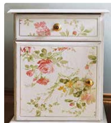
Mööblit ümberdisainides võib ideedega julge olla.

inimeste suured lemmikud. Samas on võimalik seda kõike väga lihtsate vahenditega muuta. Julgustan inimesi Pinterestist inspiratsiooni ammutama ning olen vajadusel olemas nii nõu kui ka jõuga."