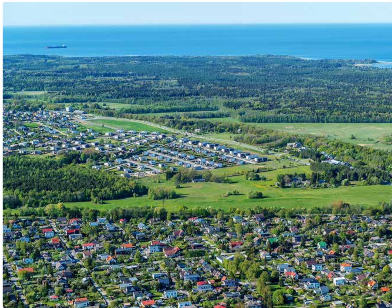
Volikogule üle antud analüüsiga tehakse ettepanek rakendada ajutist ehituskeeldu valla maismaa osas ning see hõlmab 161 kinnistut.