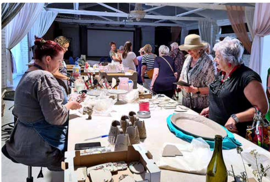
Viimsi seenioride külaskäik Rapla keraamikastuudiosse TaevaniMaani.