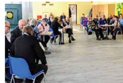
Mängudepäev tõi kohale palju huvilisi.

Klubi, neile järgnes bowlinguklubi ja Randvere päevakeskus, aga ka kõik ülejäänud meeskonnad oli tasavägiselt tublid.