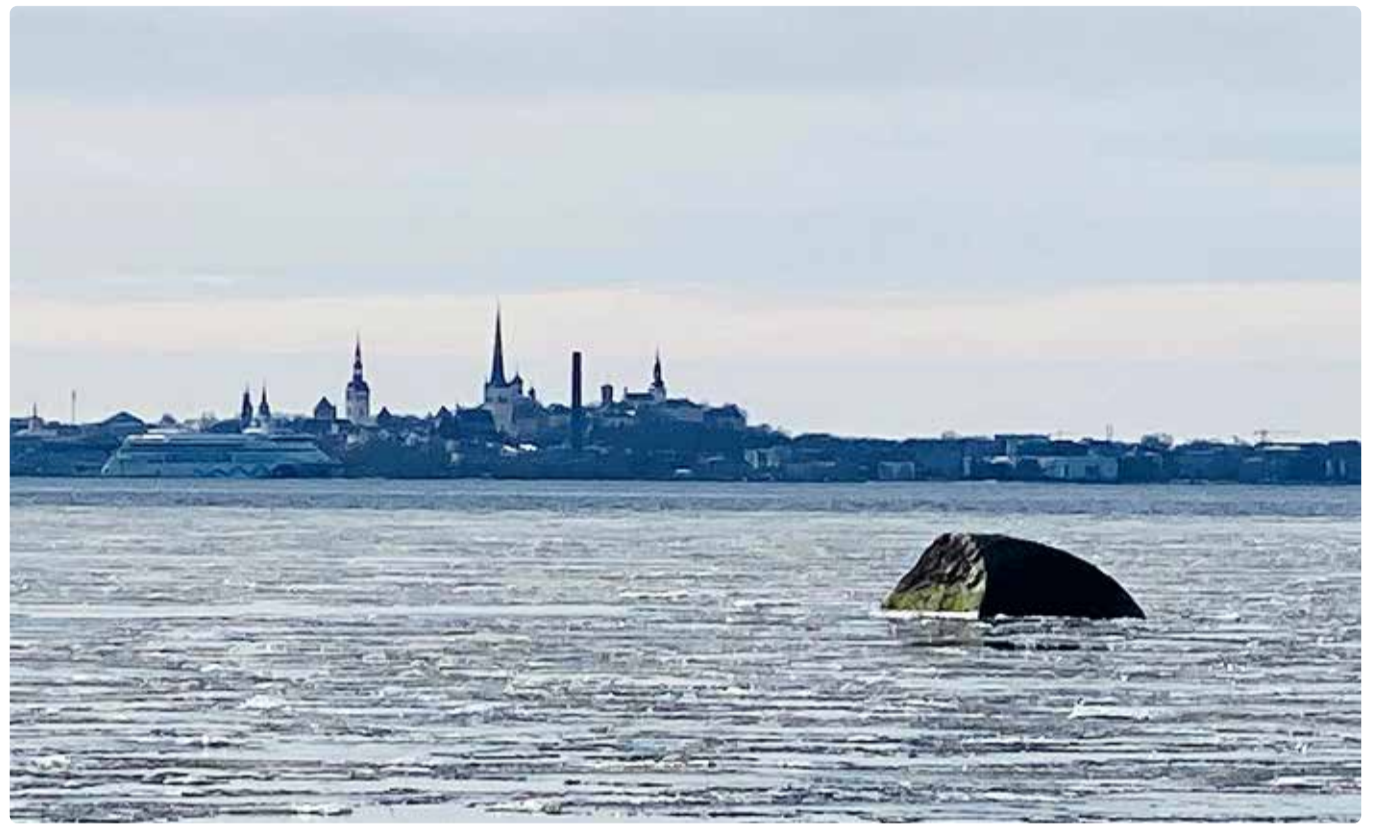
Miiduranna Hülgekivi, taamal Tallinna vanalinn.

Laiaka veealused uuringud suvel 2020.