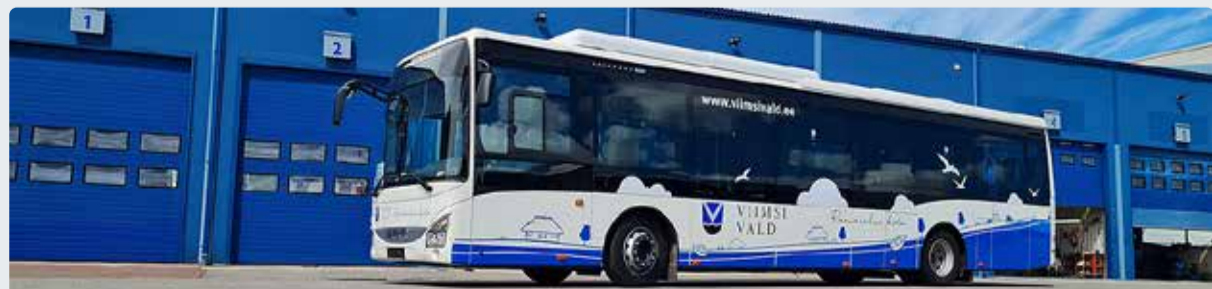
Alates 1. aprillist muutuvad V2 ja V9 sõiduplaanid.