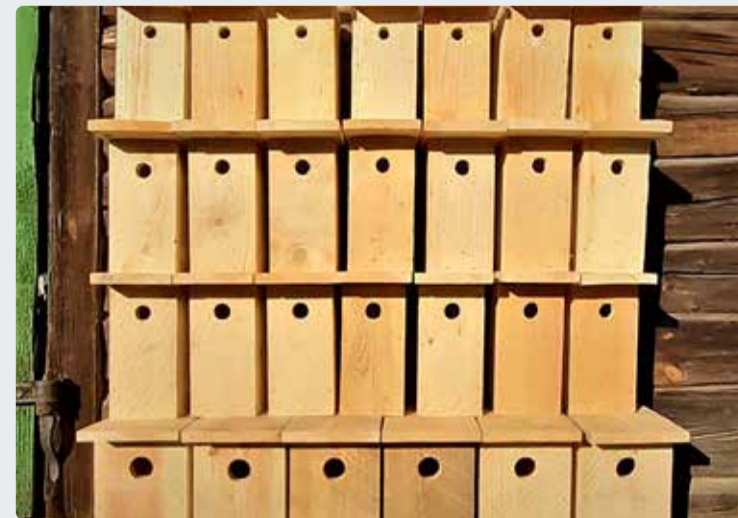
Iga paigaldatud pesakast muudab vallaelaniku aia või koduümbruse elurikkamaks.