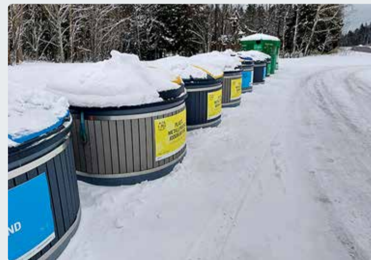
Viimsi vald on probleemsetesse pakendipunktidest paigaldanud valvakaamerad ja tuvastatud rikkujate osas alustatakse menetlust.