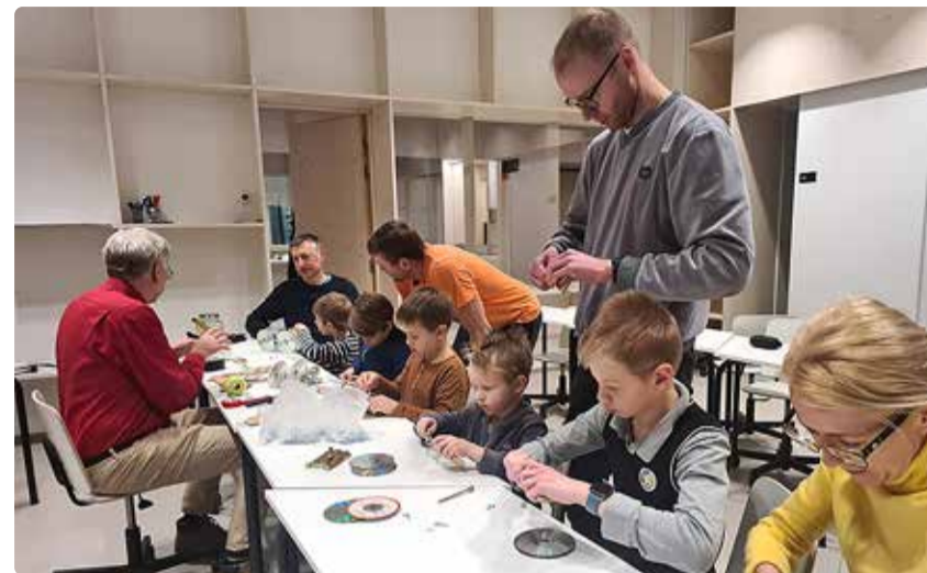
Hiirelõksuautode ühine meisterdamine.

raketi, millele iga leiutaja sai ise külge lisada nina, tiivad ja saba ning joonistada peale aknad. Suruõhk andis raketidele hoo sisse, aga avakosmos jäi siiski vallutamata, sest olime sunnitud piirduma teaduskooli ruumidega.