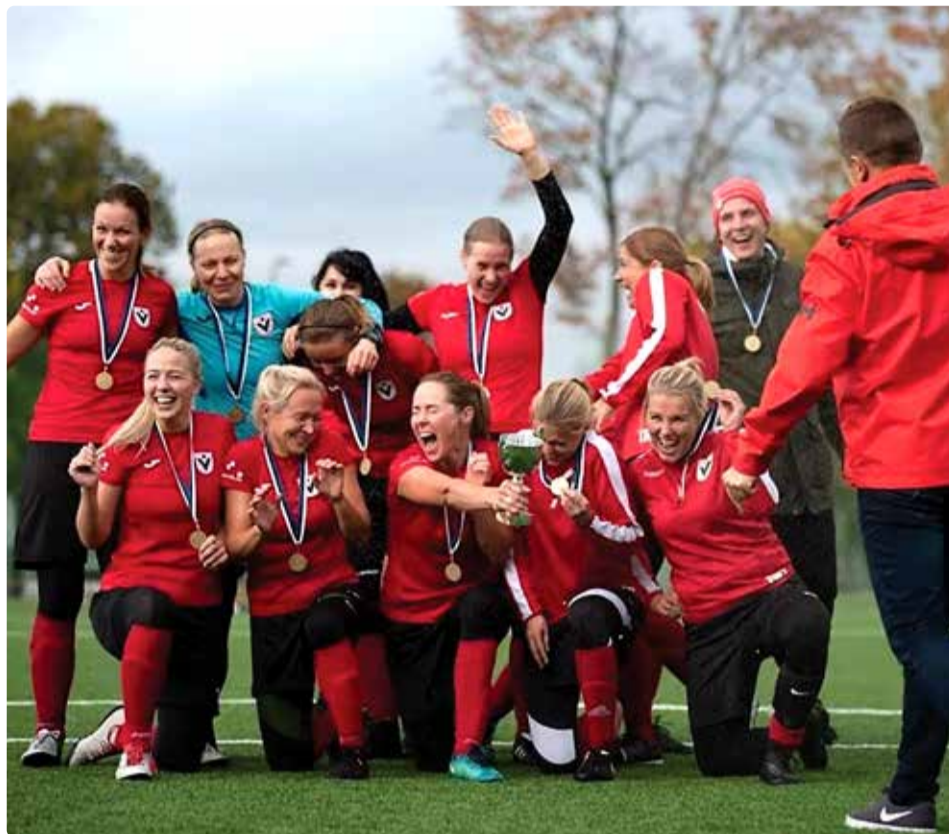
Naisharrastajate siiras rõõm võidu üle.

Esindus mängis esiliigas möödunud hooajal esimest hooaega ja saades sinna esiliiga B võitjateks. Esimene hooaeg kõrgemal tasemel päädis auväärse neljanda kohaga, samas oli nii käega katsutav ka võimalus end sellel hooajal Premium liigas leida, aga ju me polnud selleks veel päris valmis.