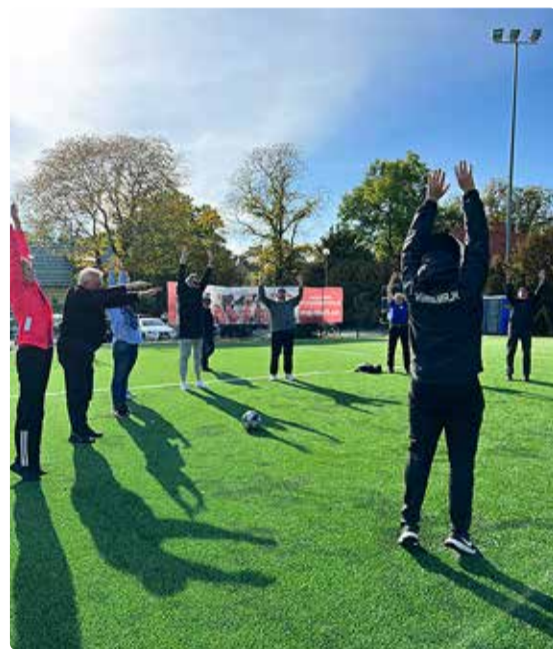
Kõnnijalgpalli on oodatud mängima igas vanuses huvilised.

Jalgpallureid oleme kasvatanud aastast 2007 ja esimesed tulemused on näha ka meie esindusvõimkonnas, kes mängib Eesti jalgpalli meistriliiga seisukohalt tasemel teisel raskusastmel. Samm edasi on vaid Premium liiga, alla on veel tulla küll. Samas on äärmiselt uhke tunne vaadata protokollid ja näha seal enamuse mängijate taga märget KTM, mis tähendab klubis treenitud mängijat. See näitab, et mängija alustas oma treeninguid Martin Reimi jalgpallikoolis ja on siin senini.