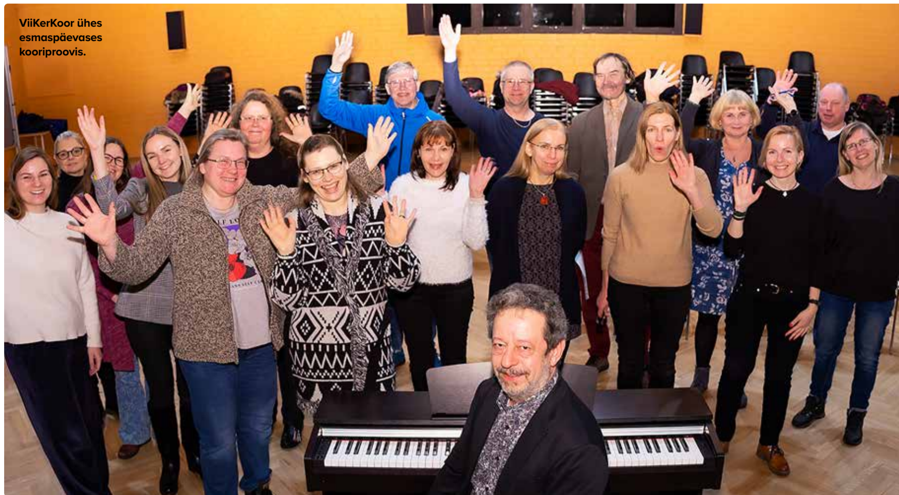
ViiKerKoor ühes esmaspäevases kooriproovis.