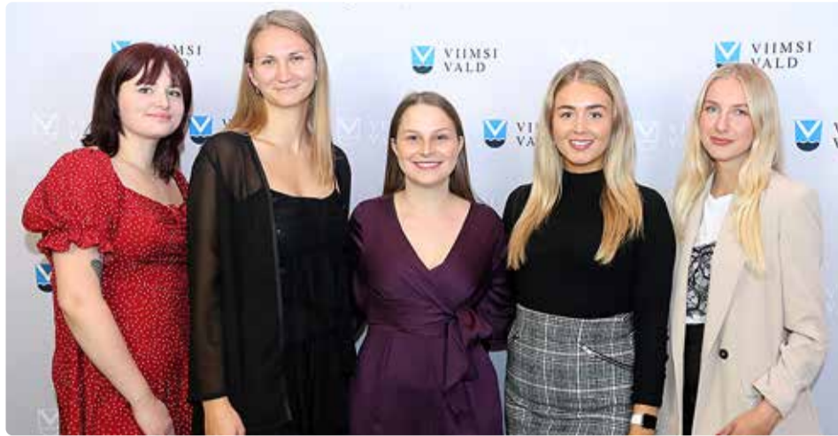
Noorsootöötajad õpetajapäeva tänuüritusel aastal 2022.

Keskustes kasutatakse avatud noorsootöö meetodit ning lähtutakse noorsootöö kutse-eetikast. Lisaks avatud noorsootööle korraldatakse huviringe ning toimuvad erinevad projektitegevused. Viimsi noortekeskuses on kokanduse, di-