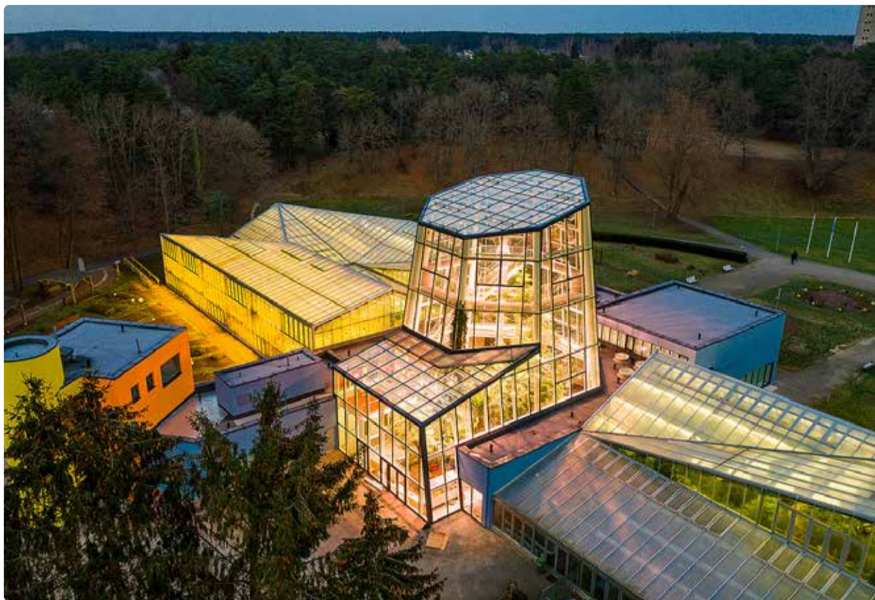
Tallinna Botaanikaia palmimaja.