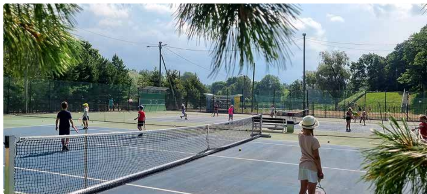
Linnalaagrid on treeningute üks osa.