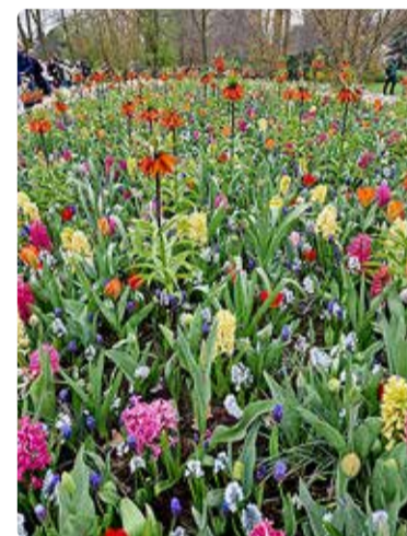
Värvimäng krookustest, hüatsintidest, tulpidest ja püvililledest.

Keukenhofi kevadet peab ise kogema ning soovitan seda kõigile aiandushuvilistele!