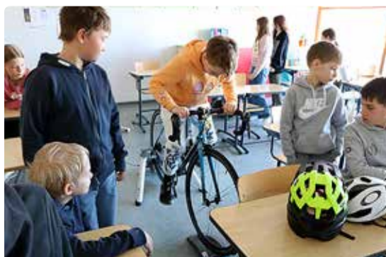
Rattasõit on ajavõit.

erineva tegevuse ja töötoa. Koostööpartneritena olid kaasatud näiteks Tallinna ülikool, TalTech, sisekaitseakadeemia, Swedbank, häirekeskus, kaitseresursside amet, töötukassa, Braingames, HK Unicorn Squad, Suukool, Viimsi noortekeskus, erinevad kohalikud