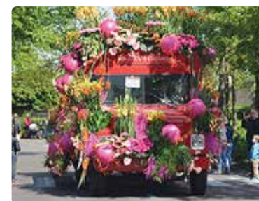
Hollandi suurim kevadefestival.

Lilleaedu külastab aastas umbes miljon inimest.