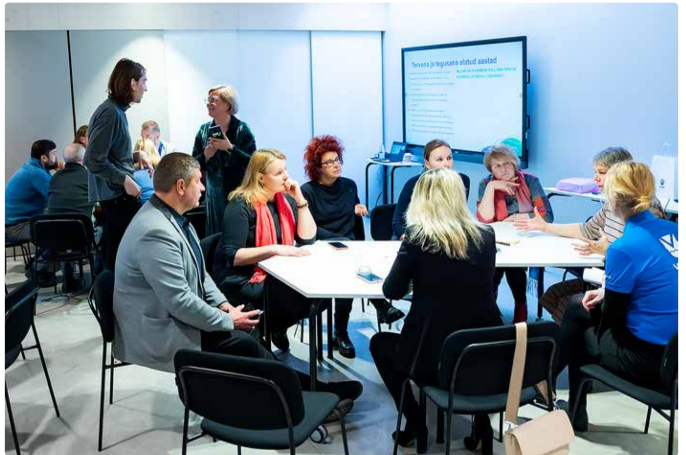
Töötoas käis aktiivne arutelu.

(ca 25,6% rahvastikust). Easõbraliku lähenemisviisiga on vaja arvestada kõigis valdkondades (ruumiplaneerimine, huvitegevus, kultuur ja sport, haridus jne).