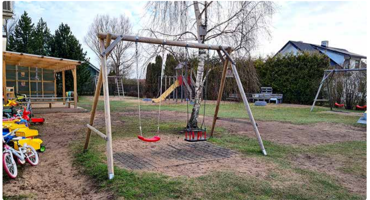
Maikuu lisanduvad pakutavate hulka ka eralasteaedade kohad. Fotol Kelvingi lasteaias õueala.

Soovi korral võib tutvuda eralasteaedade ja -hoidude poolt pakutavate võimalustega. Täpsemat infot ning partnerite nimekirja leiab valla kodulehel www.viimsivald.ee/teenused/haridus-ja-noorsootoo/lasteaiad/eralasteaiad-ja-hoidu .