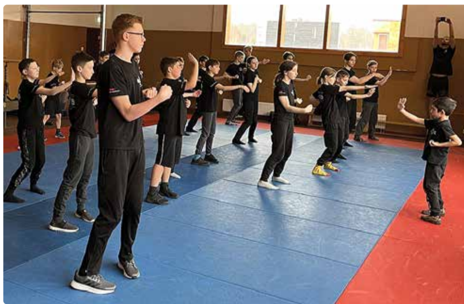
Lapsed treeningul.