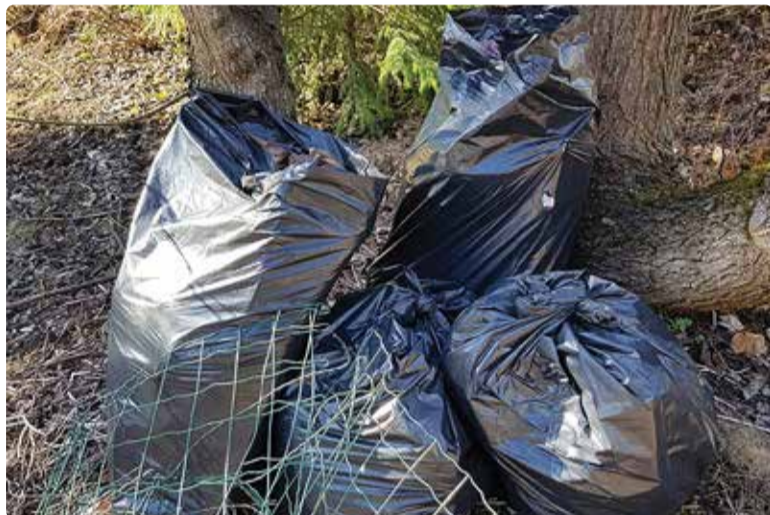
Talgutel tekkinud jäätmed saab viia jäätmejaama.

Lisaks tuleb vallavalitsus järele ja viib ära kõik kotid ja kogutud prahi, mille talgulised teede äärest, haljasaladelt ning mujalt kogu-