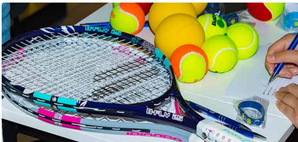
Projektifondi kaudu saab toetust taotleda noore huvihariduse ja -tegevuse jaoks.