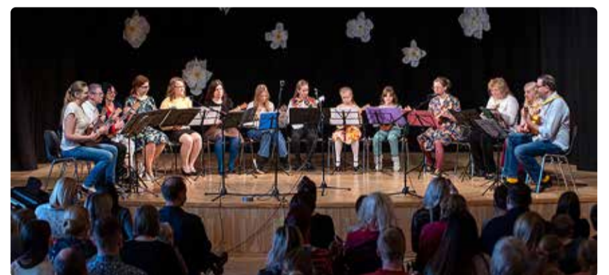
Mullune kevadkontsert.

Juba paar aastat usinalt tegutsenud Viimsi Ukuleleorkester on kollektiiv, kus musitseerivad kõrvuti igas vanuses mängijad algklasside õpilastest kuni pensionieani. Orkester on andnud juba mitu kontserti, aga erilise uhkusega