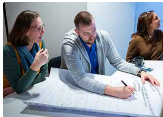
Iga mõte oli oluline ja pandi ka kirja.

Statistikaameti prognoosi kohaselt on 2040. aastaks iga neljas inimene Eestis vanem kui 65 eluaastat