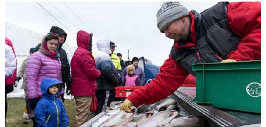
Kalasadamate päevalt võib leida ka oma “isikliku kaluri”.

Leppneeme sadama, nagu ka kõigi teiste osalevate sadamate programmid on leitavad kodulehelt agri.ee/avatud-kalasadamate-paev ja sotsiaalmeediast.