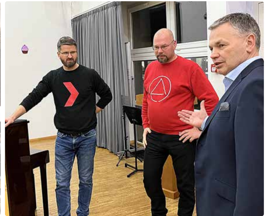
Koostöös kogukonnaga kaardistati valla varjumiskohti, millest valmis ka interaktiivne kaart.