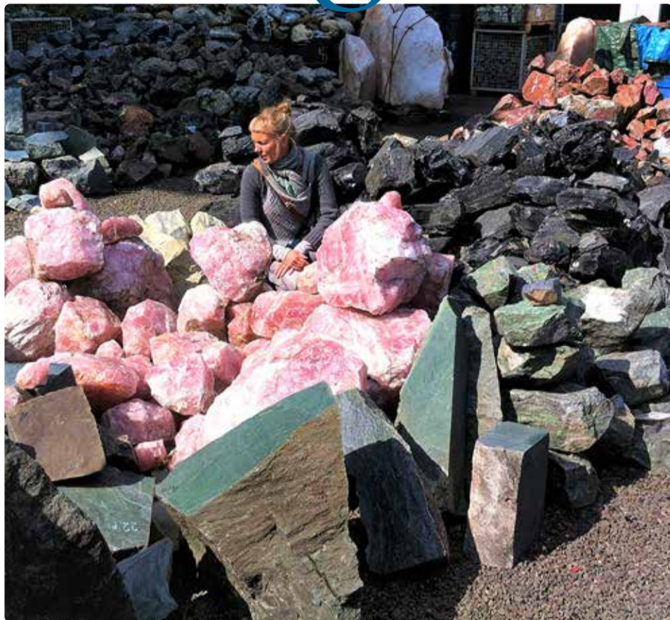
Leie Klaar Saksamaal.