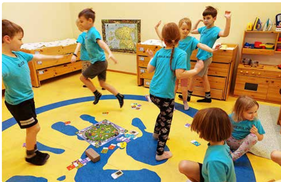
Lasteaia Väike Päike Helesinise rühma lapsed "Vigurliikurit" mängimas.