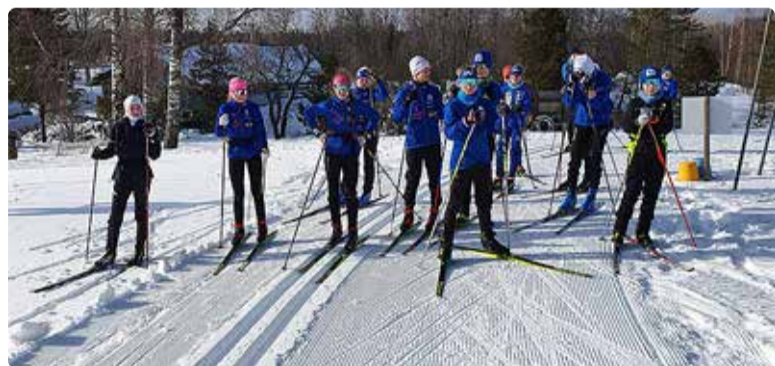
Suusakooli talvelaagri traditsioon – matk.