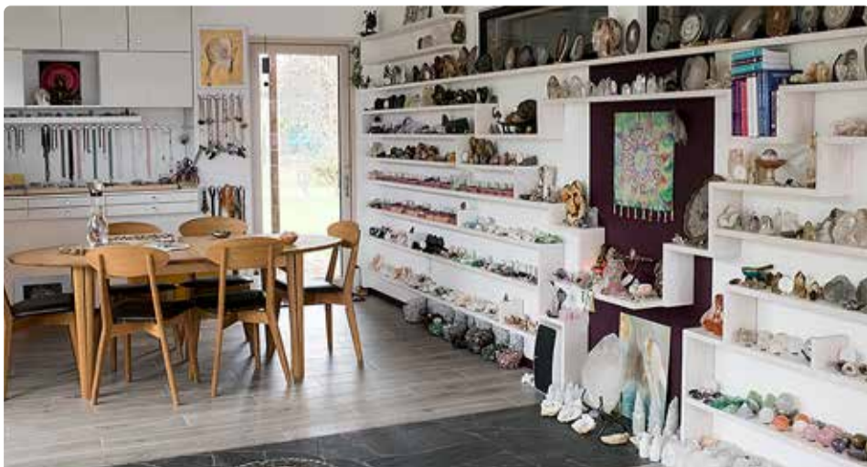
Klaarsuse studio sisevaade.

Rännak maiade astroloogias läbi isikliku sünnikaardi toimub 9. veebruar – 7. mai. Kohtume seitsmel korral Klaarsuse kristallistudios, et liikuda läbi oma enda maiade astroloogial põhineva sünnikaardi. Uuri lisa Klaarsuse sotsiaalmeediast.