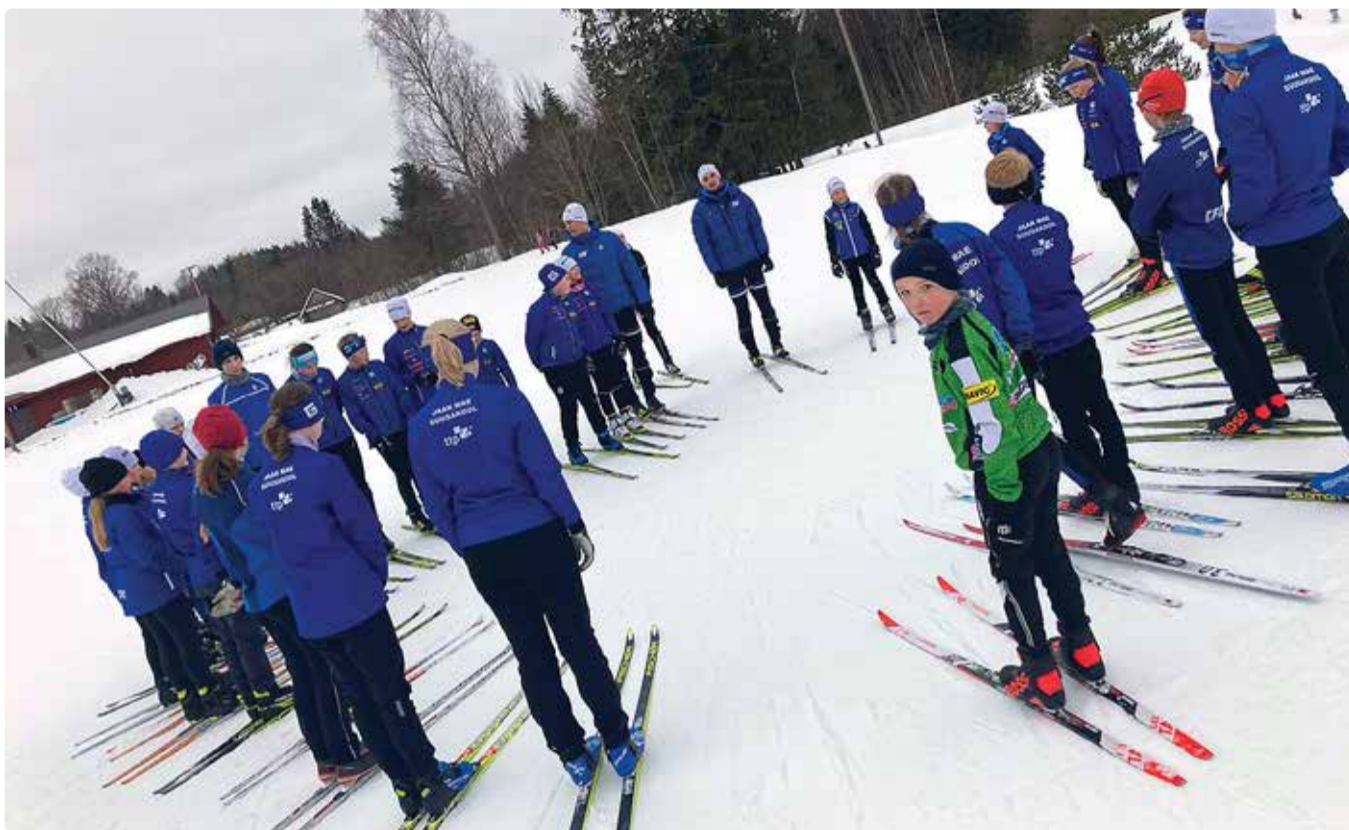
Kohe läheb suusamängudeks. Treeninglaager Haanjas.