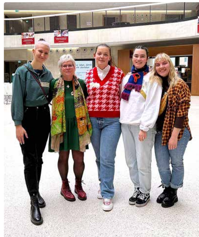
Ühisfoto seminaril osalenutest.

Loodame, et ka sel aastal on Viimsi võimalus pakkuda praktikakohti uutele noortele ning teha seda koostöös meie erinevate noorsoo- ja haridusasutuste esindajatega. Lisaks praktikantide vastuvõtule on plaanis taotleda rahastus Erasmus+ projekti "Lapsed, noored ja kliimakriis" läbiviimiseks.