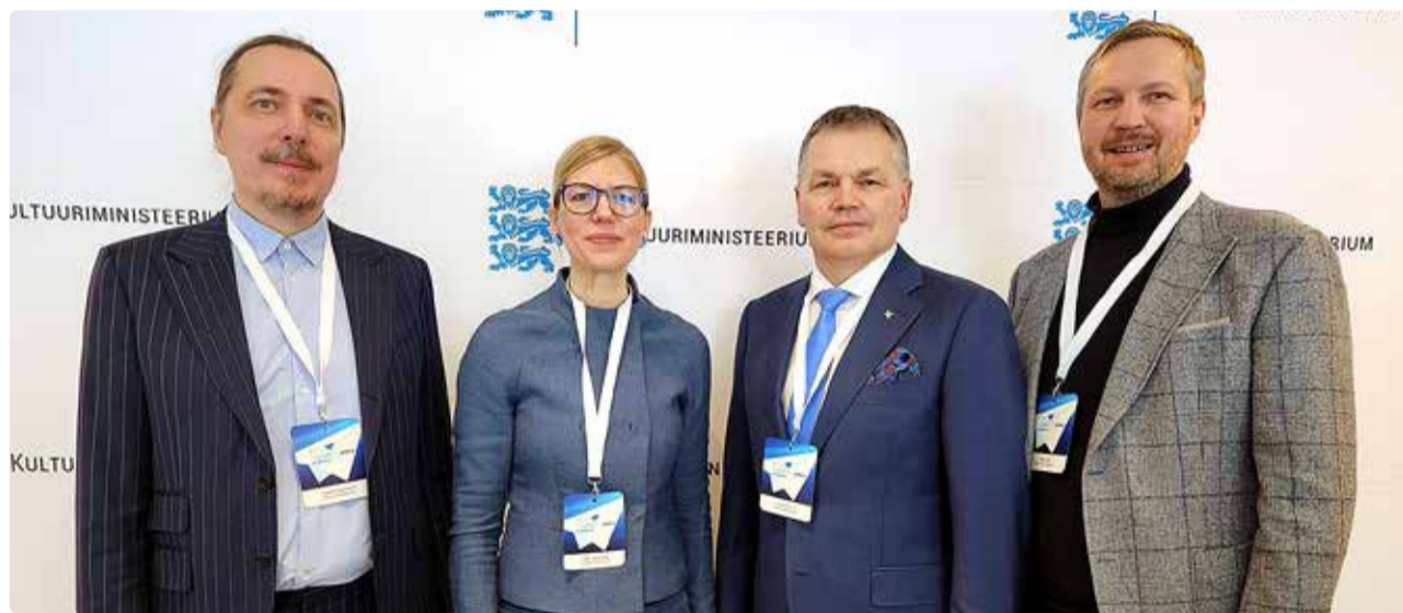
Riik ja omavalitsused peavad tegema tihedat koostööd nüüd ja tulevikus, et tagada kohaliku kultuuri jätkusuutlikkus.