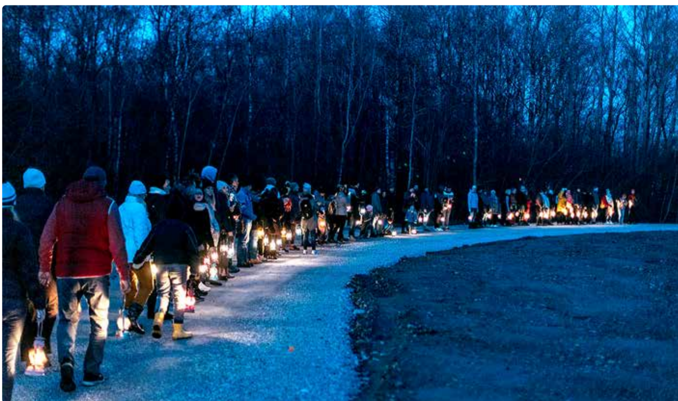
Laternamatk toimub juba 5. veebruaril.

asunud Viimsi vanimad kodud, kes olid nende asukad ning millist elu nad elasid. Räägime viikingite ja Piritaa kloostri aegsest Viimsist ning rannarootslastest. Kuid mitte ainult – põgusalt puudutame mõistagi ka tee peale jäävaid uuemaid põnevamaid objekte ja nendega seotud seikasid. Matka pikkus on ca 7 km ja ajaline kestvus umbes kaks tundi.