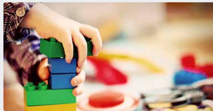
Erinevad võimalused klassiruumis ja puhkenurkades aitavad erivajadusega lastel paremini koolikeskkonda sulanduda.