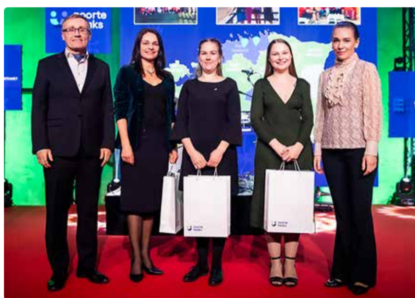
Viimsilased jõudsid kahes kategoorias kolme parima hulka.

Seekordsel tunnustusel jõudis laval välja hõigatud kolme parima sekka aasta noortemallevate ja laagrite kategoorias Viimsi õpilasmalev ning lisaks oli Viimsi vald noortesõbraliku kohaliku omavalitsuse kategoorias kolme parima seas. Aasta õpilasmaleva tiitel läks sellel korral Viljandisse ja noortesõbralikuks omavalitsuseks valis komisjon Tartu.