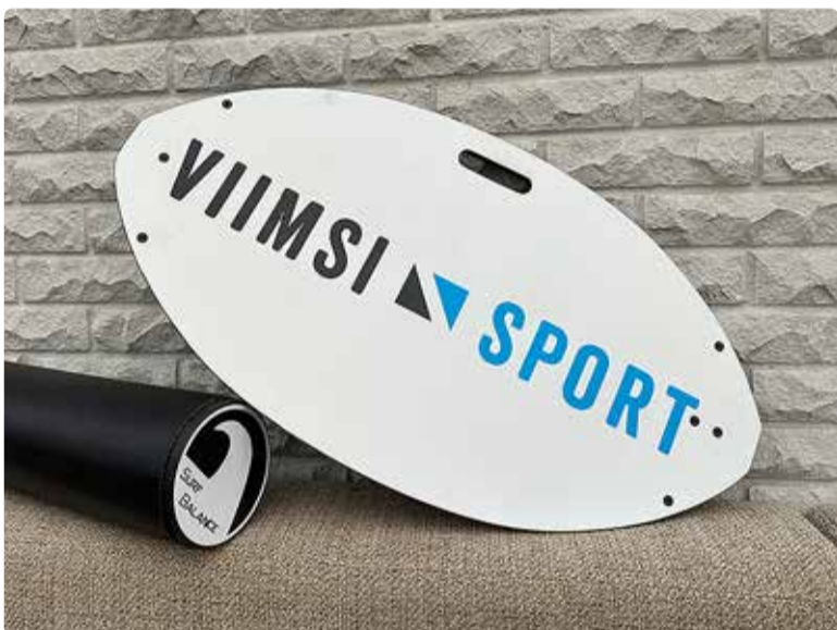
Tasakaalulaud sobib hästi nii keha süvalihaste treenimiseks kui ka tasakaalu harjutamiseks.