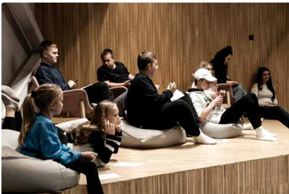
Viimsi noortekeskuse noored viktooriinil.

Noortekeskuse oluliseimateks põhiülesanneteks on avatud noorsootöö meetodil erinevate huvidega laste ja noorte (vanuses 7-26) ühistegevuse ja nen-