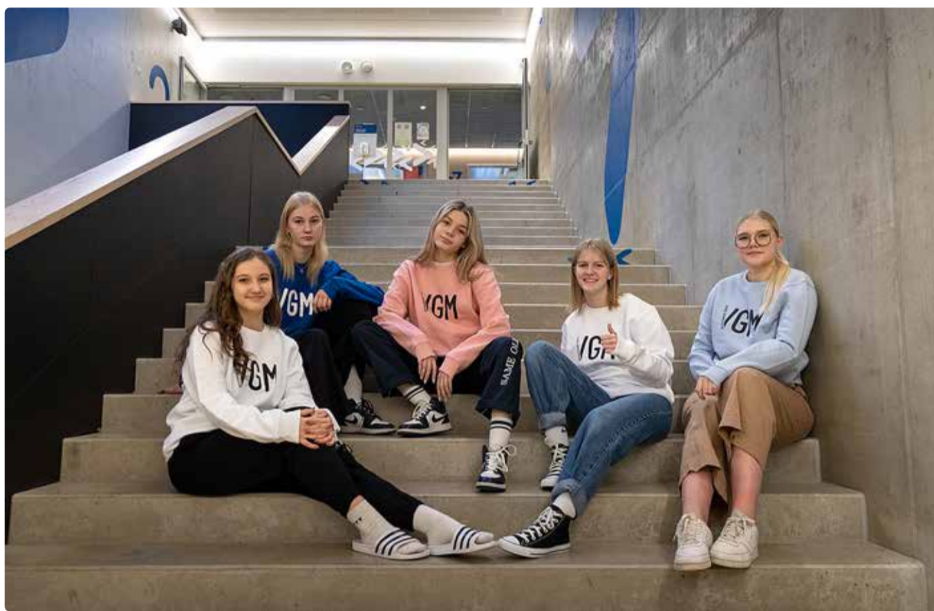
Pildil on Viimsi gümnaasiumis õppijad.

24.-26. aprillil toimub vastuvõtukatsete vestlusvoor. Eelmiste aastate kogemus veebis läbiviidavate vestlustega on saanud positiivse tagasiside nii sisseastujate kui ka läbiviijate poolt ning seetõttu jätkame