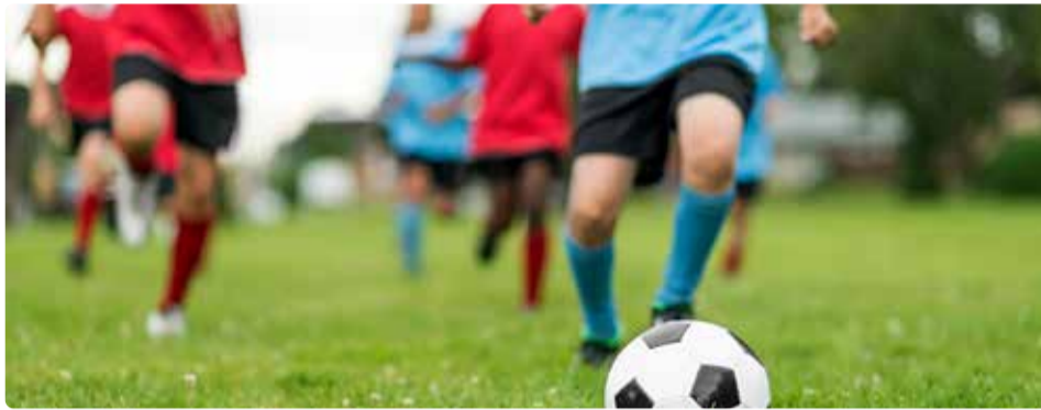
Jalgpallihall on kogukonnale oluline hoone.

26. oktoobri 2022 korraldusega nr 437 algatati jalgpallihalli detailplaneering Kannikese tee 1, Kannikese tee 1a, Kannikese tee 19 ja Kannikese tee kinnistutel, sest antud piirkonnas nägi Viimsi valla mandriosa üldplaneering ette üldkasutatavate hoonete reservmaa juhtfunktsiooni, kuhu on varasemalt kavandatud sportmängude halli ja väliväljakuid. Kuna üldplaneeringus on see ala ette nähtud üldkasutatavate hoonete reservmaana, on algatatud detailplaneeringu eesmärk üldplaneeringu üldiste kasutus- ja ehitustingimus-