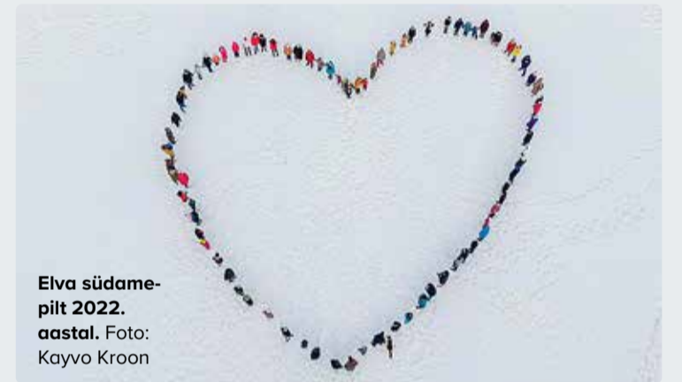
Elva südamepilt 2022. aastal.