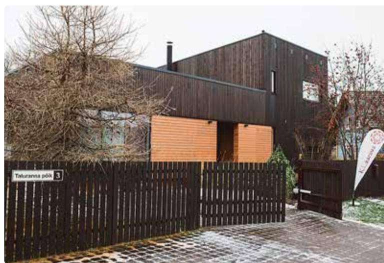
Klaarsuse studio väljast.