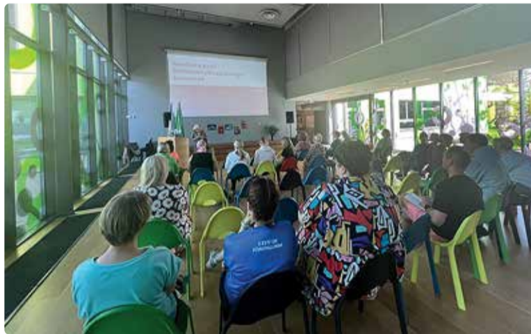
Juhtimiskultuuri uuringu tulemuste tutvustamine Randvere kooli töötajatele 12. juunil.

li mainega ja sellega, et nende laps õpib just Randvere koolis.