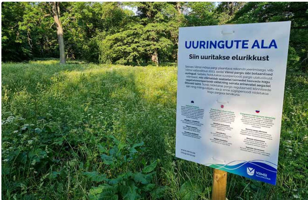
Infotahvlid annavad elurikkuse uurimisest kokkuvõtva ülevaate.