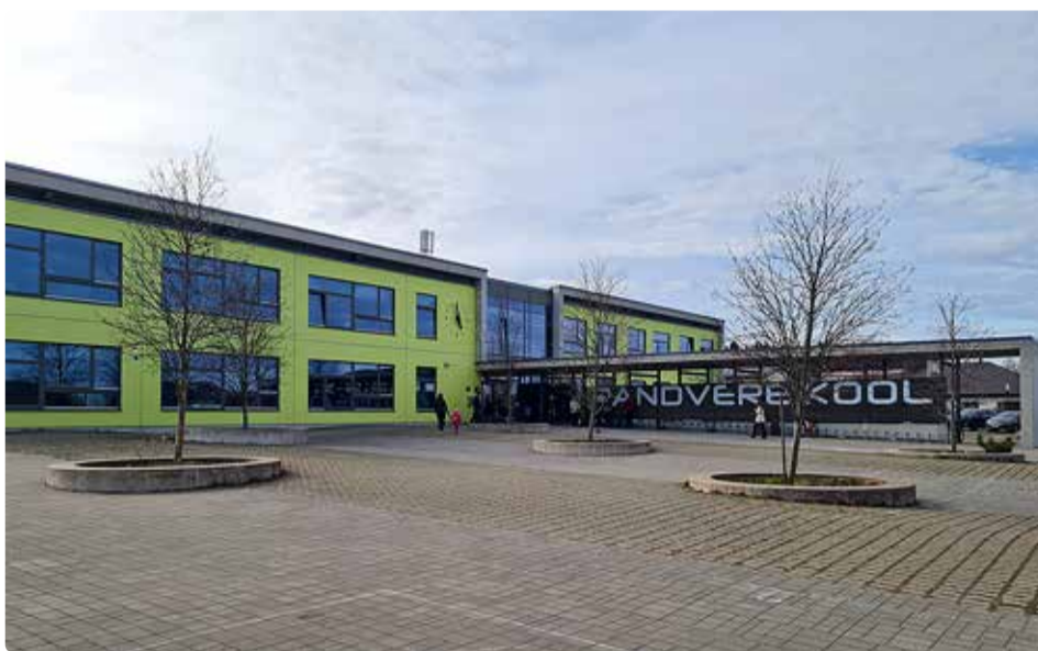
Randvere kooli.

Kokkuvõttes võib öelda, et 75% küsitlusele vastanud Randvere kooli lapsevanematest on rahul oma lapse edenemisega koolis, suhtlusega klassiõpetajaga. 70% ütlesid, et neil on piisavalt infot koolis toimuva kohta ning 62% on rahul koo-