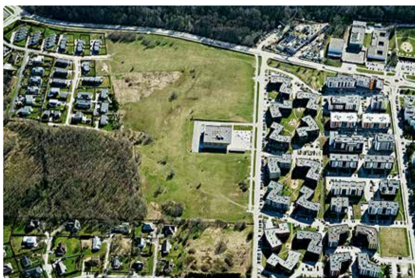
Vaade Tammede pargi alale 2021. aastal.

Vallavalitsus on käesoleval aastal algset projekti täpsustanud nii loodus-