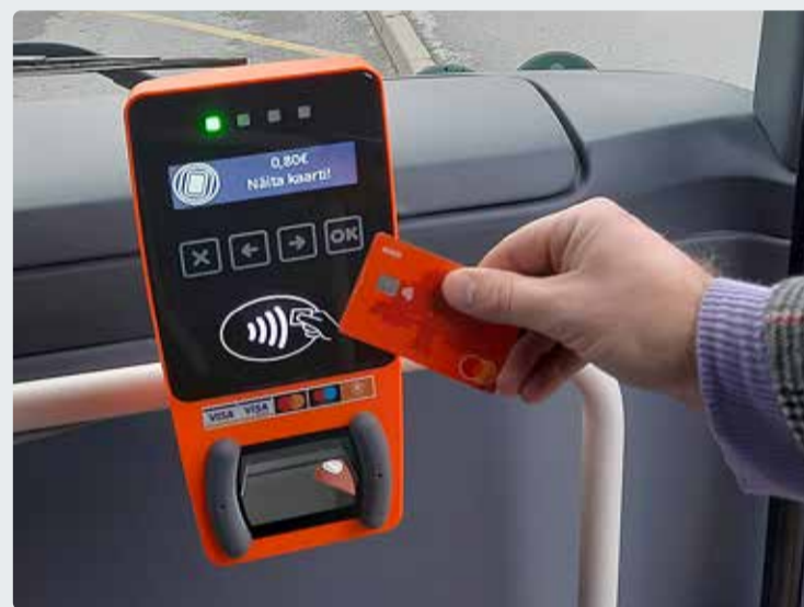
Viimsi siseliinidel hakkavad uued pileti hinnad kehtima alates 1. augustist.