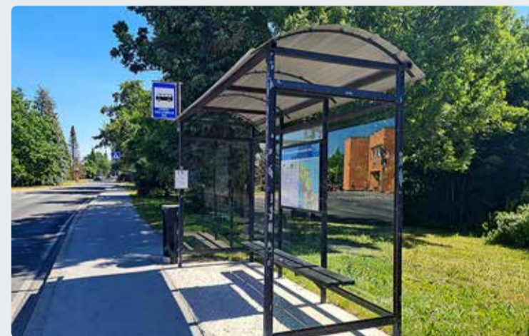
Bussid läksid üle suvisele sõidugraafikule.