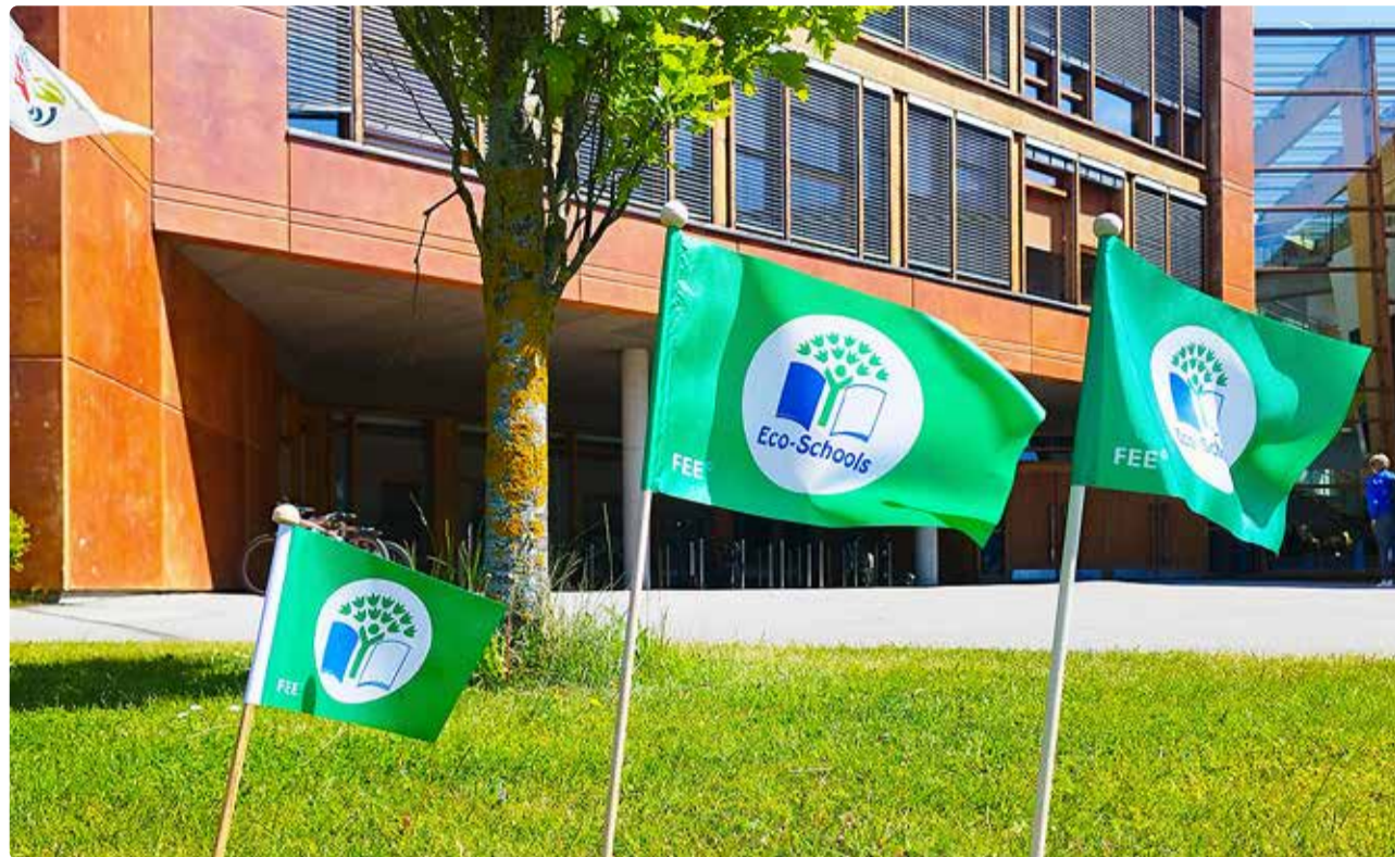
Viimsi koolis lehivad rohelipud kolmandat aastat.

ROHELINE LIPP Sellel kevadel omistati Viimsi koolile taaskord Roheline lipp. See on kolmas kord, kui meie kooli tunnustati Rohelise kooli programmis aktiivselt tegutsemise eest.