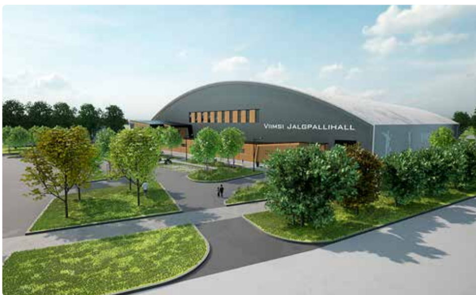
Tulevane Viimsi jalgpallihall. Eskiis: Arhitektibüroo Tava OÜ

Dendroloogilisest uuringust lähtuvalt on alal 11 kõrge haljastusli-