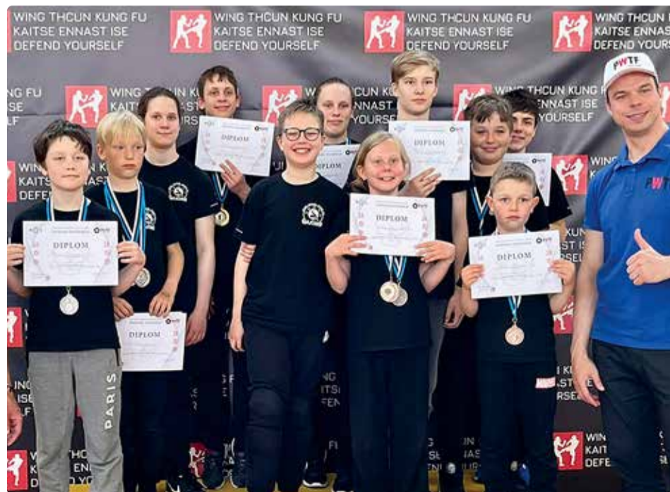
Viimsi noored tõid koduvalda 12 medalit.

Turniir oli pühendatud lastekait-sepäevale ning möödus deviisiga “Kaitse ennast ise!” eesmärgiga just pöörata suuremat tähelepanu las-te turvalisusele ja enesekindlusele.