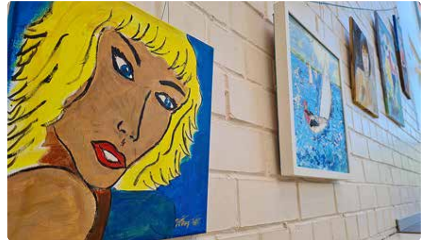
Mälestusnäitus on avatud Viimsi huvikeskuse fuajees.

Maalide temaatika on mul olnud mitmekesine ja võib öelda, et olen otsijaks jäänud siiani. Kuna värvid on alati olnud mu lemmikud, siis on loodus osutunud tänuväärseks aineseks. Eriiselt on mind kütkestanud soov kujutada loomi, võimalikult humoorikalt. Üldse olen unistanud, et igas pil-