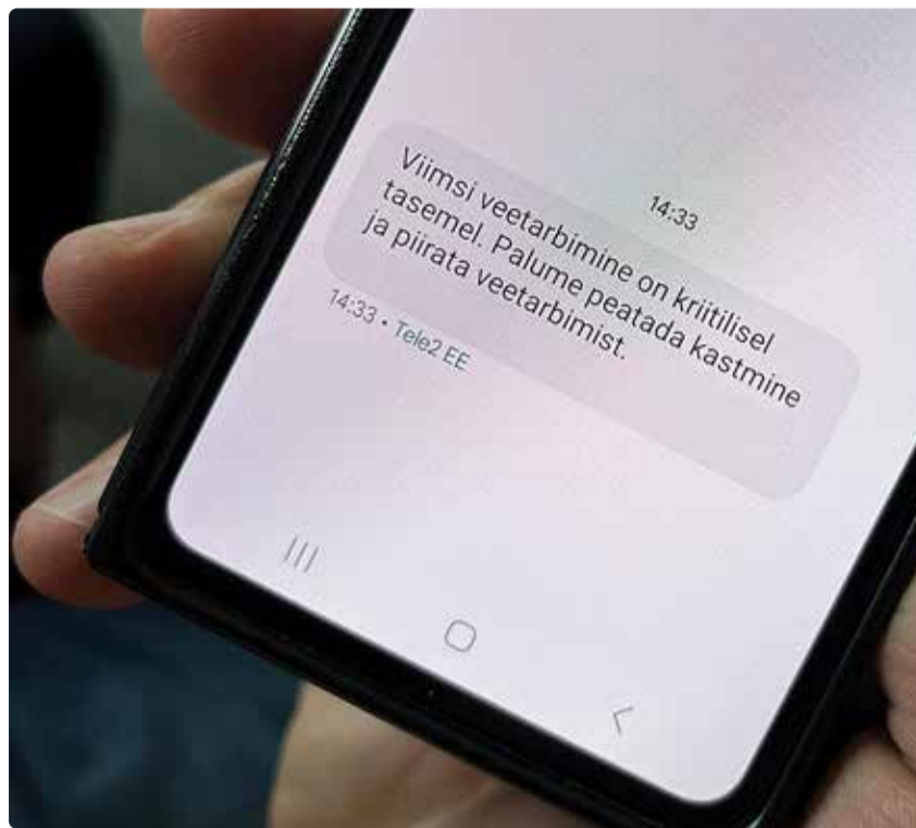
Kui vee tarbimine ületas kriitilise piiri, saatis Viimsi Vesi klientidele SMSi ja kutsus üles vett vähem tarbima.

Aastal 2020 valmis esimene veeühendus Tallinna veevärgiga ning 2023. aastaks on planeeritud täiendava veejuhtme valmimine. Selle kollektorite maksimaalse võimekuse kasutamiseks on vaja ehitada rõhutõste pumplad koos mahutitega, mis peaks Pärnamäele valmima paari aasta jooksul. Need vajalikud investeeringud on tehtud vastavalt Viimsi valla arengu-