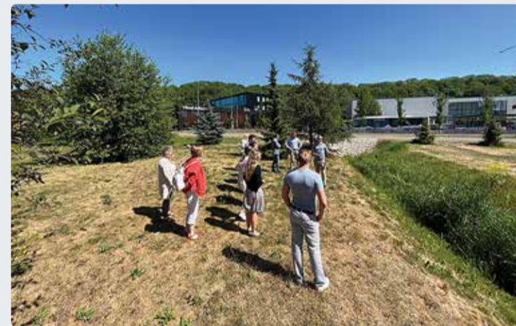
Viimsis toimus projekti avakoosolek.