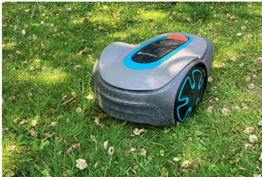
Mõistlik on põuaperioodil lasta oma ustaval robotil lihtsalt puhata.

Mis siis üldse on lahenduseks? Kindlasti tasuks suviste kastmist peale hakata mõtlema juba varakult ning