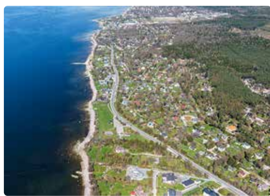
Vastu võetud määrus ei muuda koduomanike maksusoodustust.

Heiko Leesment avalike suhete osakonna juhataja