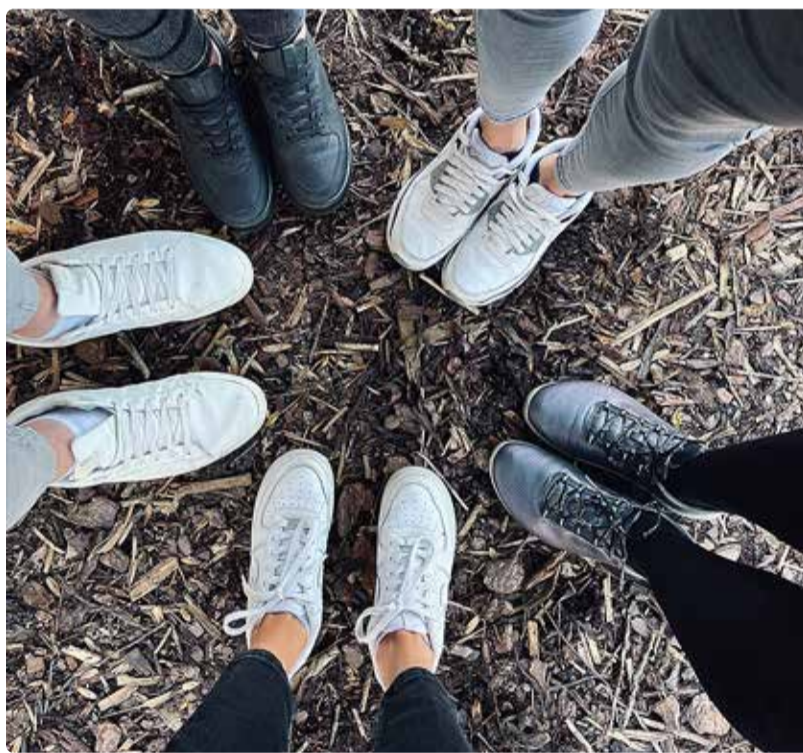
Kutsu sammuvõistlusest osa saama ka sõbrad.

Silva Sildmaa rahvatervise peaspetsialist