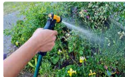
Kastmismist tasub koguda varakevadel, et vältida hilisemat joogivee raiskamist.

Kuigi tänaseks on loodus meile pisut kinkinud lisaks suvekuumale ka loodusele hädavajalikku ja kasutavad vihmavett, siis tuleks sellegipoolest mõelda, kuidas enda käitumisega toetada uue põua ajal meie loodust nii, et selleks ei peaks kasutusele võtma meie eluks vajalikku joogivett, et muru ei muutuks kollaseks või tomatitaimed ei närbuks.