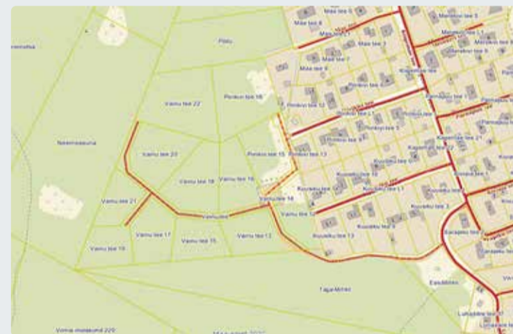
Põlendiku planeeringualale kavandatavad teed.