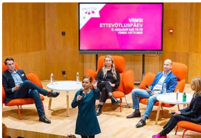
Viimsi ettevõtluspäeval.

70 elaniku, kes oma igapäevatoös just nendes valdkondades tegutsesid.