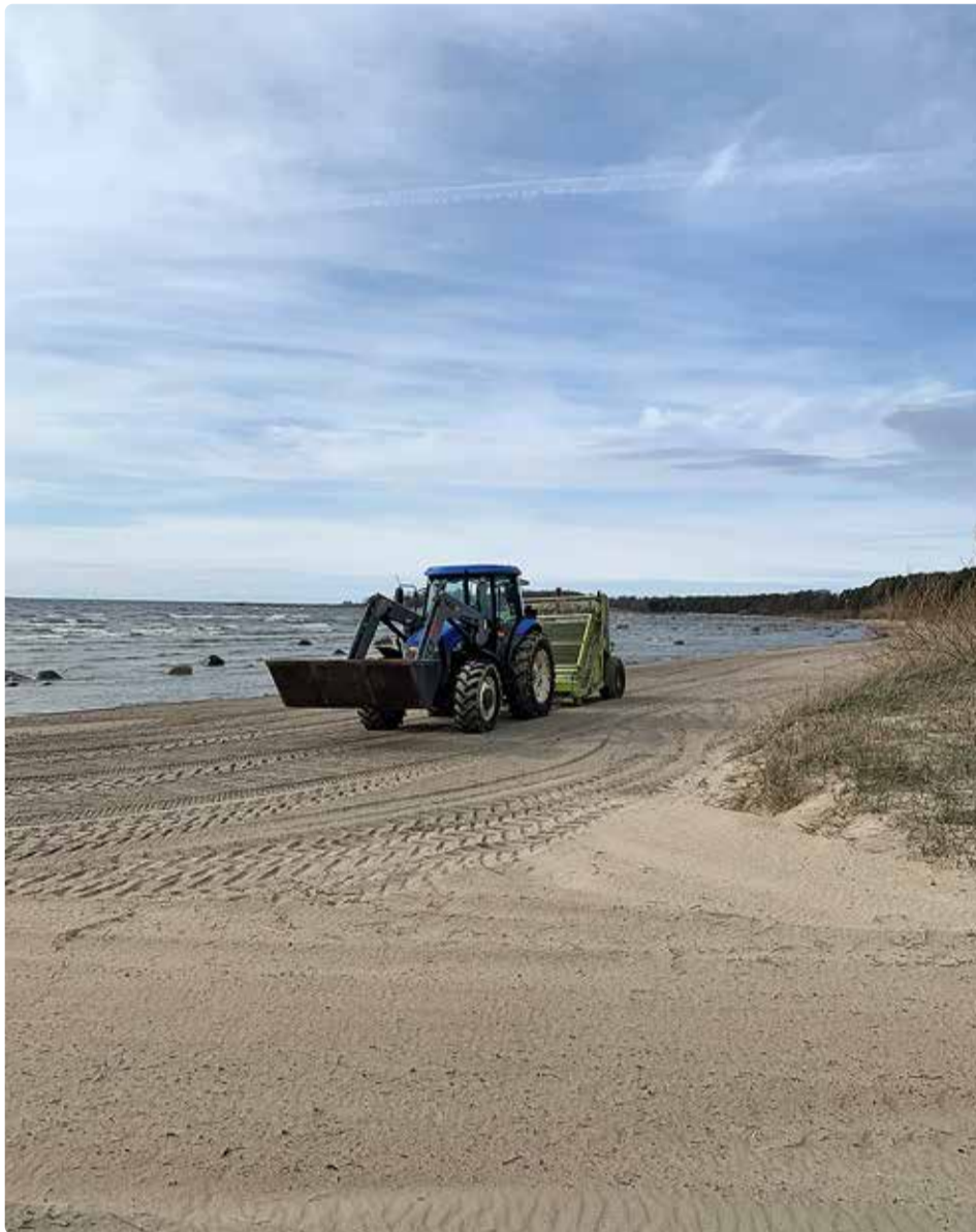
Haabneeme ranna liiva sõelumine.

2022. aasta suuremate alade (Tammede park, Haabneeme ran-