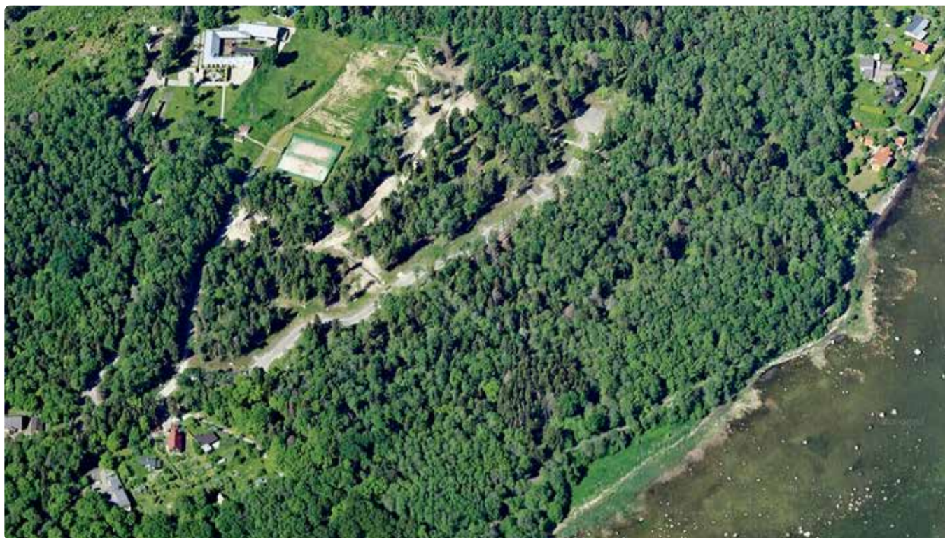
Vaade planeeringualale.

11. septembril 2018 võttis Viimsi vallavolikogu vastu otsuse nr 67, millega pikendati Tammelaane de-