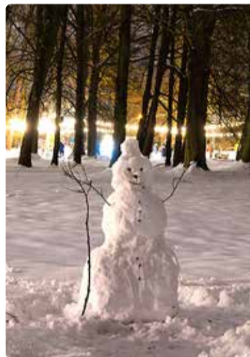
Lumememm Viimsi mõisa pargis.

sealade kehtestamiseni 2023. aasta I pooles.