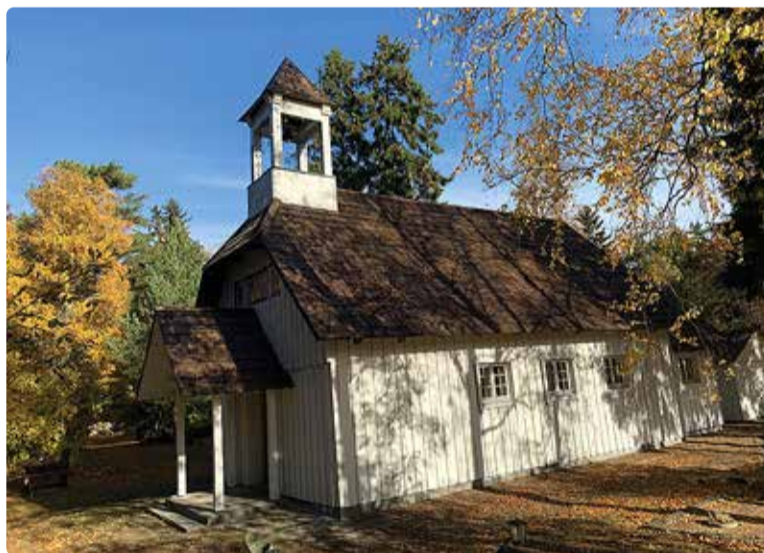
Rohuneeme kalmistu kabel sai uue kuue.

na sanglepik, Schüdlöffeli haljak jm) niitmistööde jaoks telliti tööd lepingupartnerilt, maksumusega 11 934 eurot.