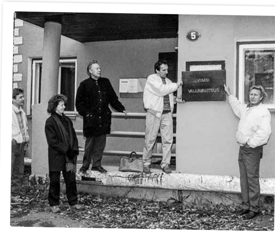
Sildi eemaldamine esimeselt vallamajalt.

Viimsi valla mitu taassündi Viimsi valla sünniaastaks võib pidada aastat 1866, kui Aegna, Haabneeme ja Viimsi mõisavaldustest moodustati Viimsi vald. See eksisteeris kuni 1891. aastani, mil see liideti koos Maardu, Nehatu ja Saaha vallaga ühiseks Nehatu vallaks.