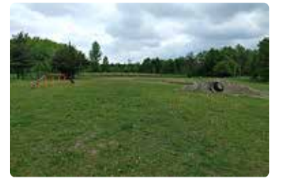
Koerteväljak Randveres.

2022. aastal jätkus Metsakasti külas Ristiku koerteplatsi teise etapi töö-