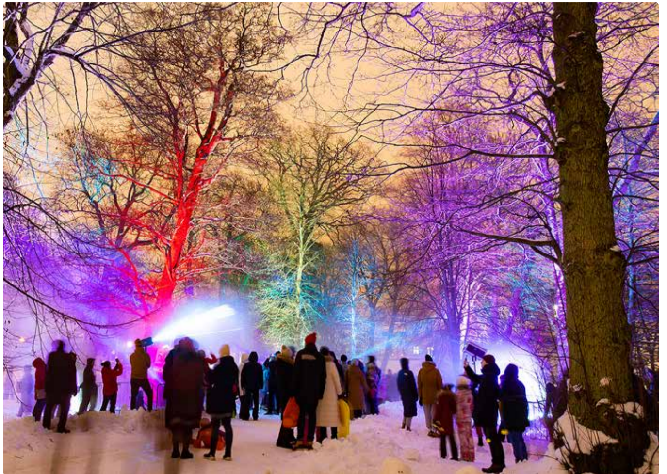
Viimsi mõisa pargis toimunud laser-show.

Kahe uue kaitseala loomise menetluse algatas Viimsi vallavolikogu oktoobrikuu istungil. Järgmisteks etappideks on mõlema loodava kaitseala kaitse-eeskirjade eelnõude koostamine, avalik väljapanek ja arutelu. Kui kõik läheb plaanikohaselt, jõutakse uute kait-