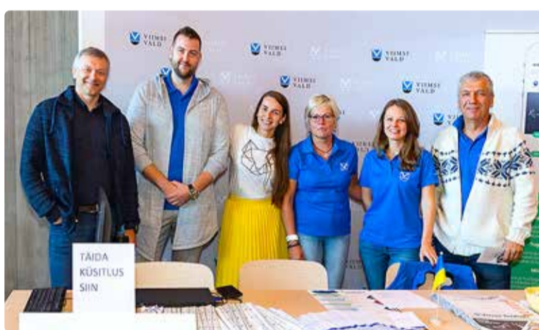
Valla teabepäev.

tagada kvaliteetne teenus ning kogukonna sidumiseks osaleda ühisüritustel.