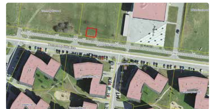
Tammede pargi ala Viimsi gümnaasiumi kõrval;