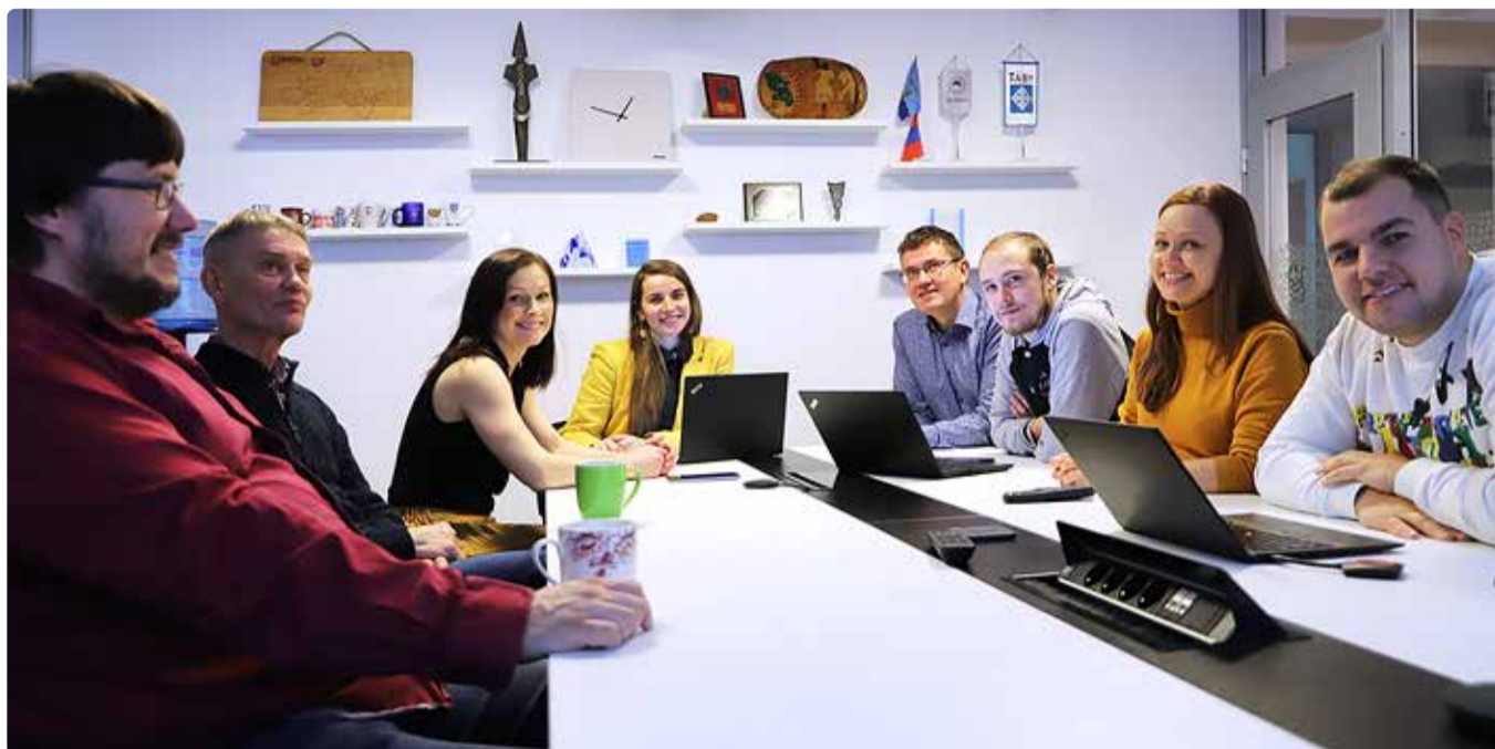
arendusosakonna tiim.

2022. aasta lõpus toimusid strateegiaseminarid vallavalitsuse ja -volikogu meeskondadega ning Viimsi valla elanikest kokku loodud sisulised fookusgrupid. Eraldi võeti fookusesse hariduse, huvitegevuse, kultuuri, sotsiaalhoolekande, ettevõtluse, turismi, külategevuse, planeeringute ja looduskaitse teemad. Fookusgruppides osales kokku üle