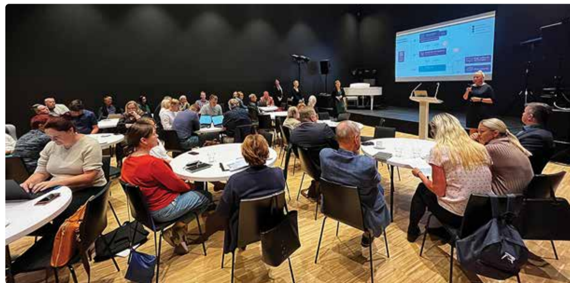
Arengustrateegia avaseminar.