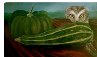
Näitusmüügilt saab töid ka osta.

Näitusel eksponeerib Kommitza teoseid, millel on kujutatud koduseid esemeid, loomi ja tegelaskuju- sid Eesti looduse taustal. Kunstnik armastab värve ja lihvib sürrealistlikud vaikelud tehniliselt viimase piirini. Iga tema töö jutustab oma loo. "Mulle meeldib mõelda, et need vaikelud ei olegi nii vaikesed, kui esmapilgul tundub. Õhtu jätkudes, kui hämarus laskub üle