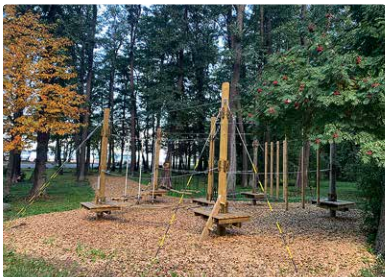
Haabneeme ranna madal-seikluspark.

Augustis teatas Omniva, et sulgeb sügisest üle 70 postiasutuse.