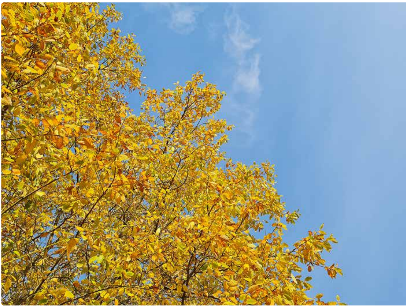
Täname kõiki vabatahtlikke, kes olid ukrainlaste tulekul abiks nii nõu kui ka jõuga!

Kevadel sõlmis Viimsi vallavalitsus koos hallatavate asutustega mitmekesisuse kokkuleppe. Mitmekesisus on inimeste elu osa nii Eestis kui ka mujal maailmas. Erineme üks-teisest nii väljanägemise, päritolu, huvide ja tegevuste, valikute kui ka võimete poolest, aga meil kõigil on ühesugune inimväärikus. Mitmekesisuse kokkulepe on vabatahtlik kokkulepe, millega liitudes kinnitab ettevõtte, vabaühendus või ava-