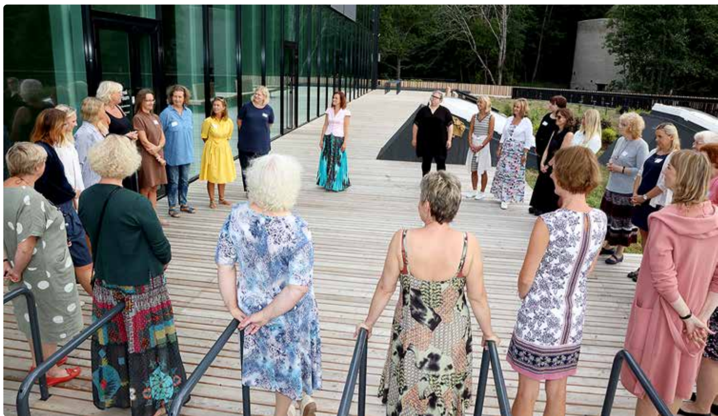
Haridustöötajate arengupäev Viimsi Artiumis.