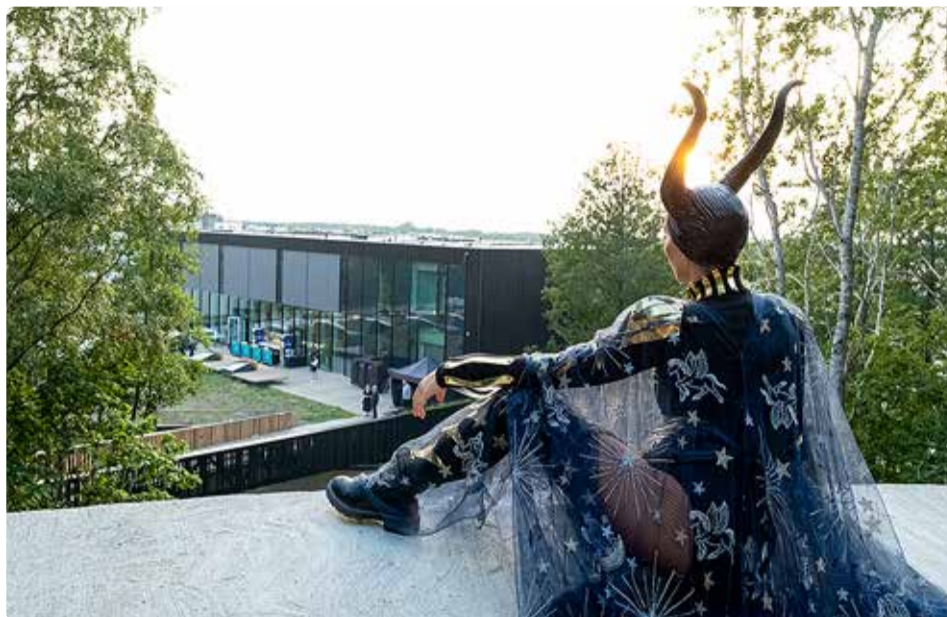
Viimsi Artiumi avamine.