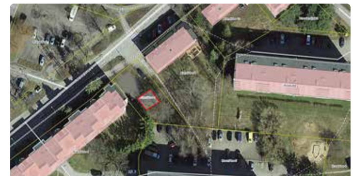
Aiandi tee 6, Viimsi alevik;

Kogumiskohad asuvad järgmistes kohtades: