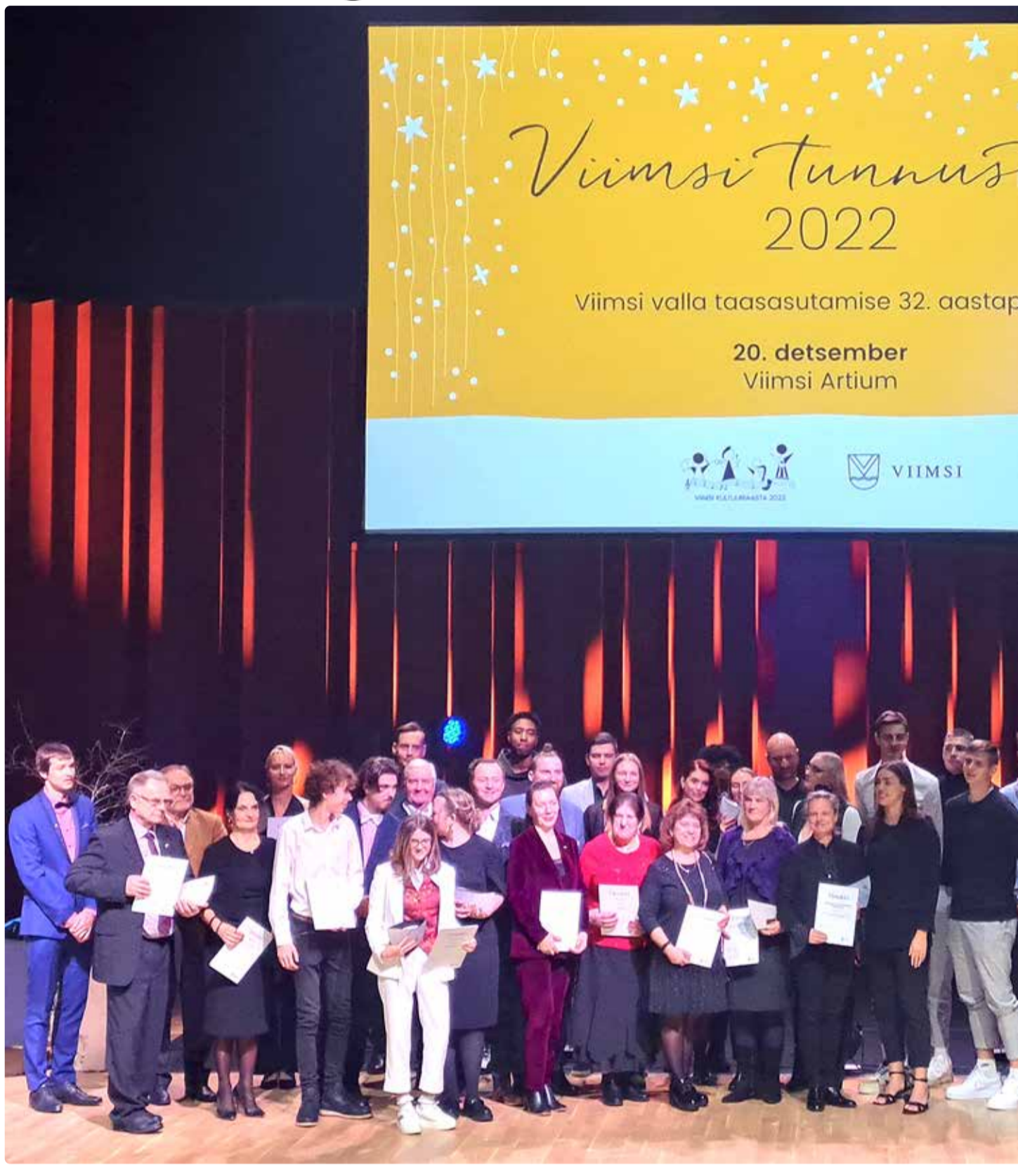
Grupipilt tunnustuse saajatest.