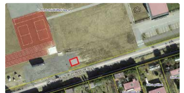
G. H. Schüdlöffeli tee 4, Randvere kooli staadioni parkla.