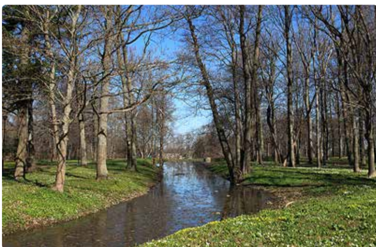
Varakevadine mõisapark.