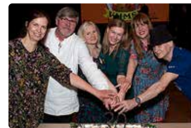
Kapell Viimsi oma 30. sünnipäeva tähistamas.