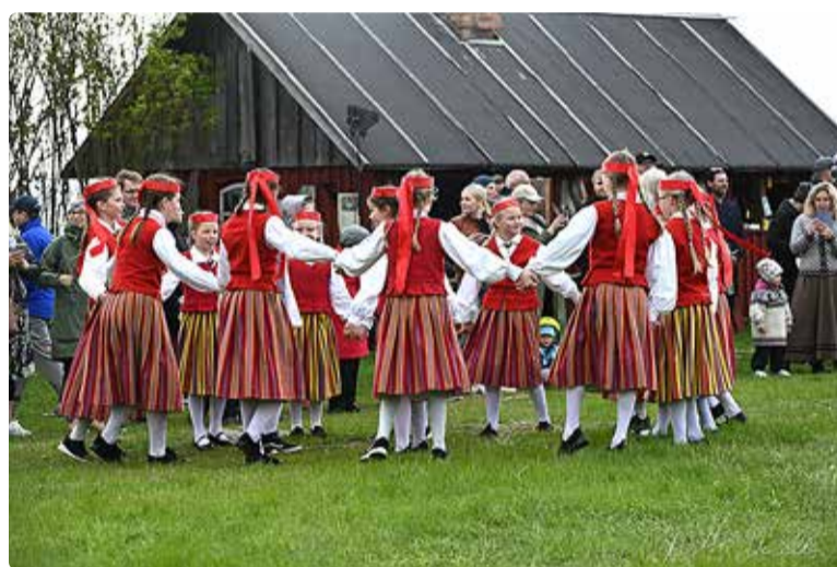
Ühistantsimine "Las käia see tants" Viimsi vabaõhumuuseumis.

Viimsi vabaõhumuuseumis toimus suure ühistantsimise "Las käia see tants" osalejaid ja korraldajaid. See kogukondlik rahvapidu pani kõigil jala tatsuma veel enne simmani algust.