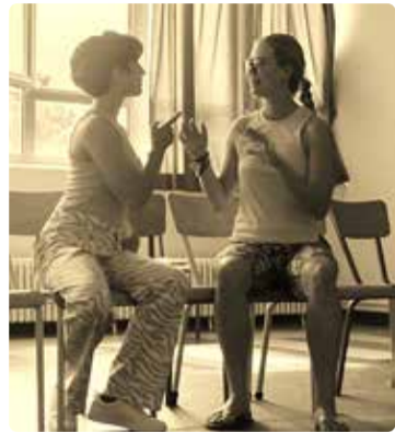
"Into the move" töötuba.

Juuli keskel osalesid Viimsi noored Prantsusmaal Lyonis rahvusvahelises noortevahetuses "All we need is you". Projekti eesmärk oli suurendada vähemate võimalustega noorte kultuurilisi õigusi ning toetada noorte integreerumist ühiskonda.