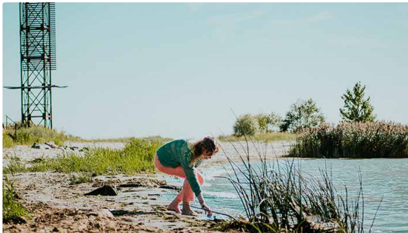
Tänavu pöörab maailmakoristuspäev varasemast rohkem tähelepanu Läänemerele ja meie pikale rannajoonele.

Maailmakoristuspäev kutsus eestlasi üles koristama ka kalmistute ja kirikute ümbrusi.