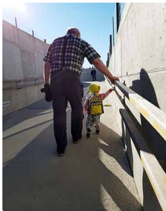
Tänava tähistame vanavanemate päeva pühapäeval, 10. septembril.

Iseenesest mõistetavalt viib see päev minuealiste mõtted tagasi minevikku. Mul oli kaks väga erinevat vanaema, soojema hüüdnimega – mammat. Üks nendest (emapoole) oli humoorikas vanainimene,