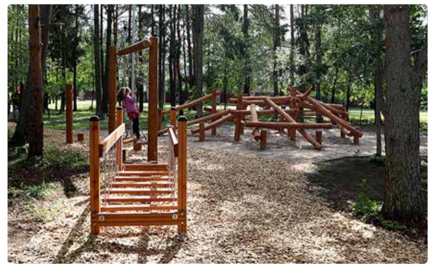
Augustikuus avati kohalike poolt palavalt oodatud Pähklimäni spordipark.

Heiko Leesment avalike suhete osakonna juhataja