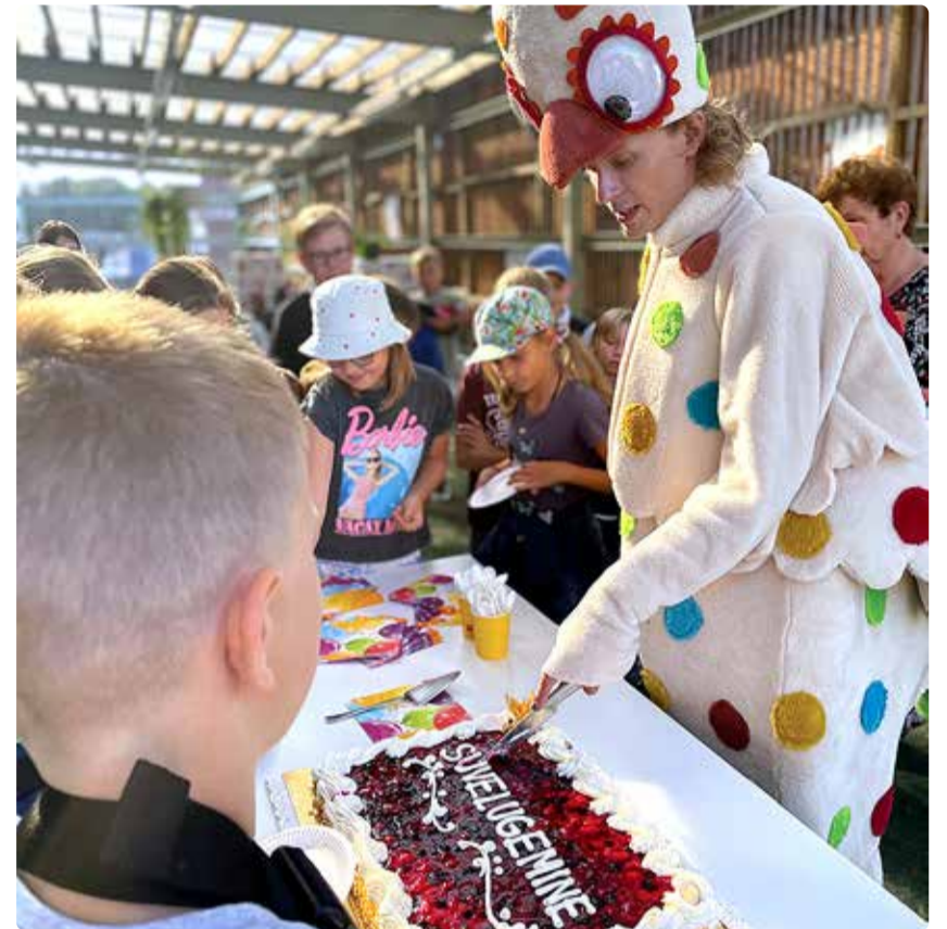
Preemiana ootas kõiki noori maitsev tort, mida jagas raamatukogu maskott Vimpsik.