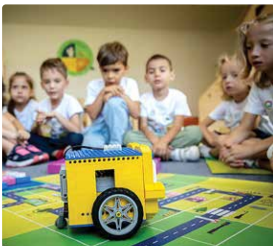
Young Engineers õppeprogrammid.

kasvanutele, kuhu on oodatud õppima kõik muusikahuvilised, olenemata kogemusest. Tegemist on individuaaltundidega, repertuaari valikul ollakse paindlikud ja arvestatakse õpilase huvidega. Füüsilise puude või vaimse erivajadusega õpilased on samuti tundidesse teetunud. Studio Tantsupisik tantsutreeningutele on oodatud kõik 1.-6. klassi õpilased, olenemata eelnevast tantsukogemusest – treenerid on suurte kogemustega tantsuarmastajad, kes nakatavad oma tantsupisikuga igäüht! Commercial dance'i (12-17-aastased) trennides saavad noored õppida showelementidega tantsustiili, mida kasutatakse suurte lavadel, kontsertidel ja sotsiaalmeedias. Tunnis töötatakse enesekindluse, suurte liikumiste ja energiaga,