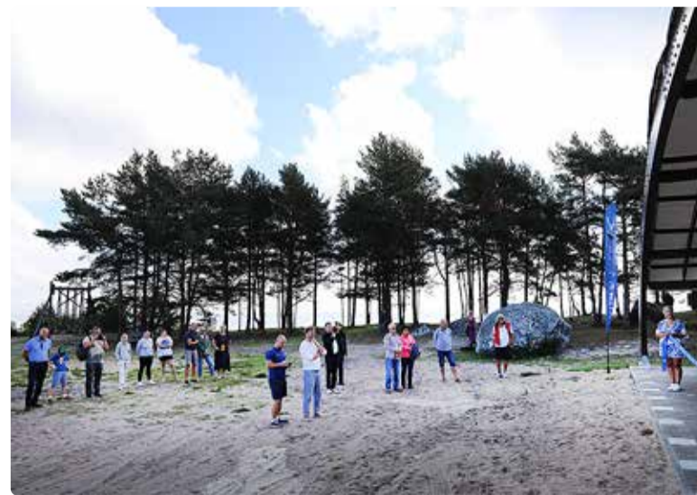
Pidulikult avamisel osales ka suur hulk Prangli saare elanikke.

paadikuuri asemel on kogukond saanud endale väärrika kooskäimise kohta.