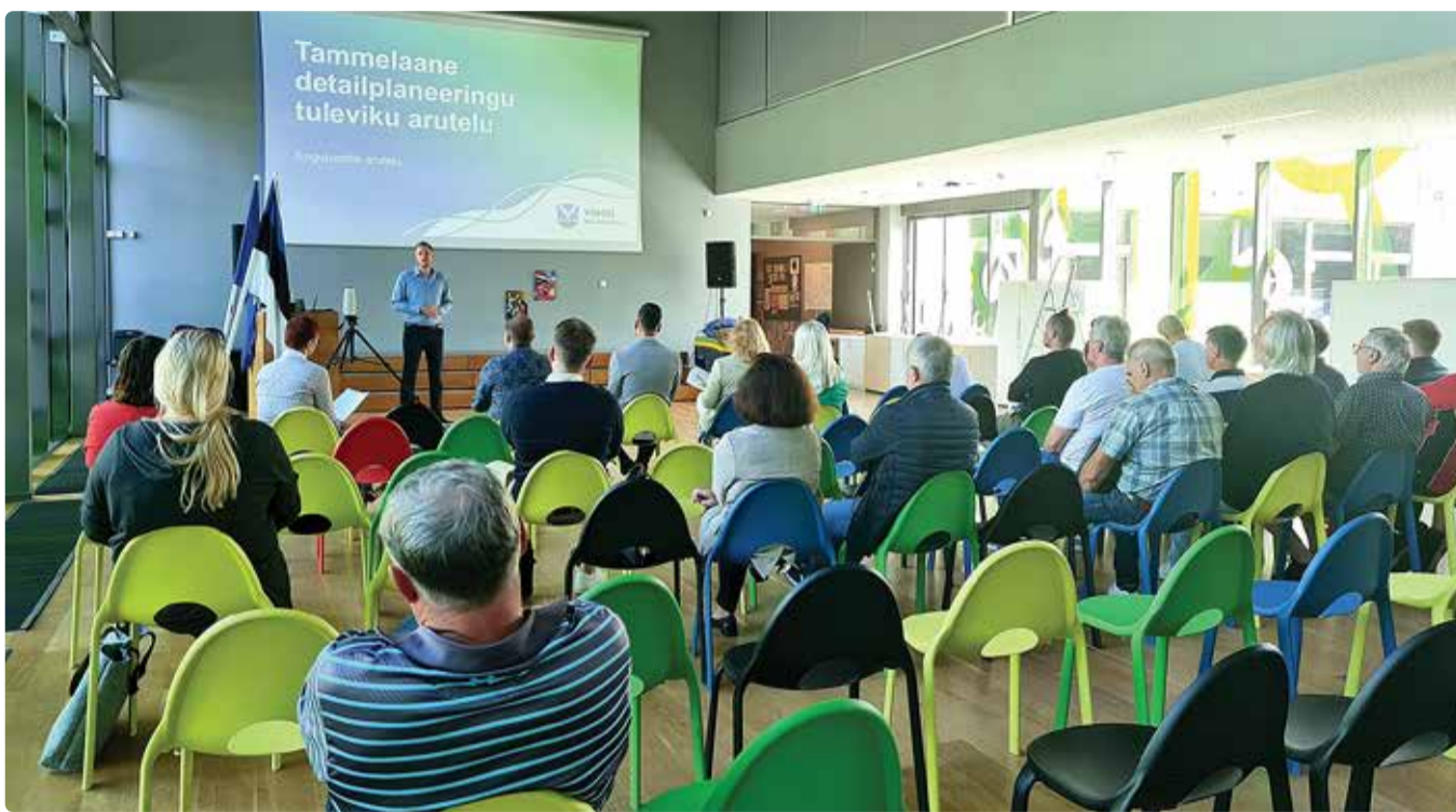
Tammelaane detailplaneeringu tuleviku arutelu toimus Randvere koolis.

Ta lisas, et mõnes mõttes on hea, et riigikohus on planeeringu läbi hekseldanud ning näidanud n-ö näpuga kaalutusvigade peale.