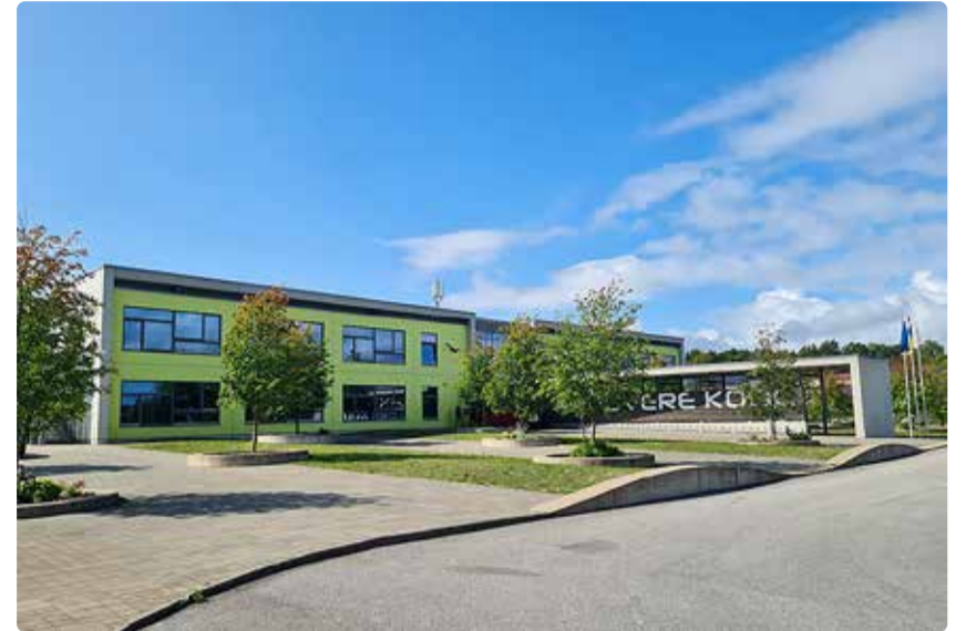
Osaõppuse käigus mängitakse läbi Randvere kooli massevakuatsioon.

Randvere kooli evakuatsioon on osa riiklikust suurõppusest Kooli evakuatsiooniõppus on osa üle-