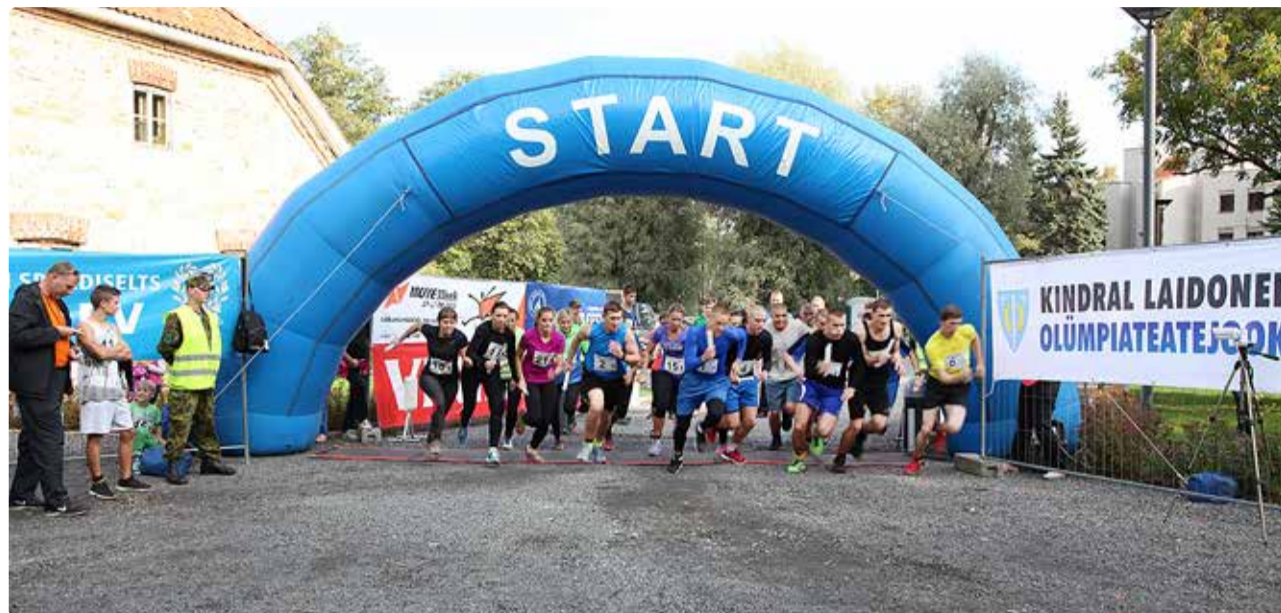
Traditsiooniline kindral Laidoneri olümpiateatejooks tuleb taas.

TEATEJOOKS 21. septembril antakse Viimsi mõisa õuel tõe lähel kindral Laidoneri XXIV olümpiateatejooksule, mis on kutsutud looma vaimset sidet kunagiste ja tänaste põlvkondade vahel, ühendades vabaduse sõnumi olümpiaaatega. Kindral Laidoner oli Eesti Olümpiakomitee president.