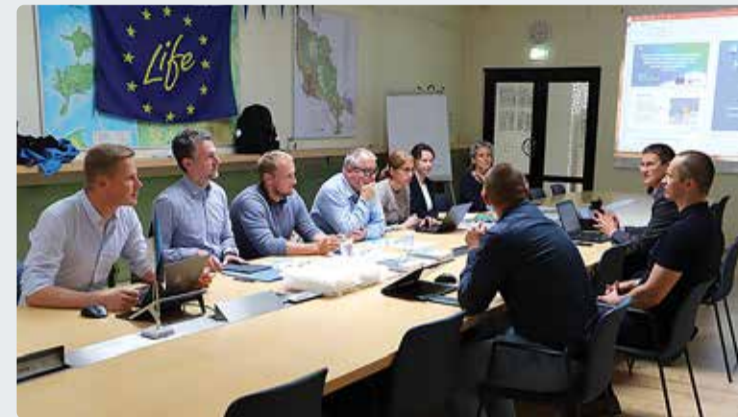
LIFE projekti vedanud valla esindajad koos Euroopa Kontrollikoja liikmetega.

■ 30. augustil külastas kuueliikmeline Euroopa Kontrollikoja delegatsioon Viimsi valda. Külaskäigu jooksul tutvuti projektiga LIFE UrbanStorm ja Viimsi valla kliimamuutustega kohanemise seniste tegevustega.