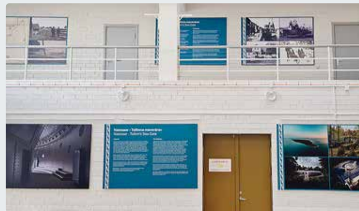
Näitus on üleval Viimsi huvikeskuses ning on kõigile tasuta.