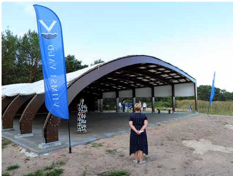
Uuenduskuuri läbinud laululava on kohalike poolt hästi vastu võetud.