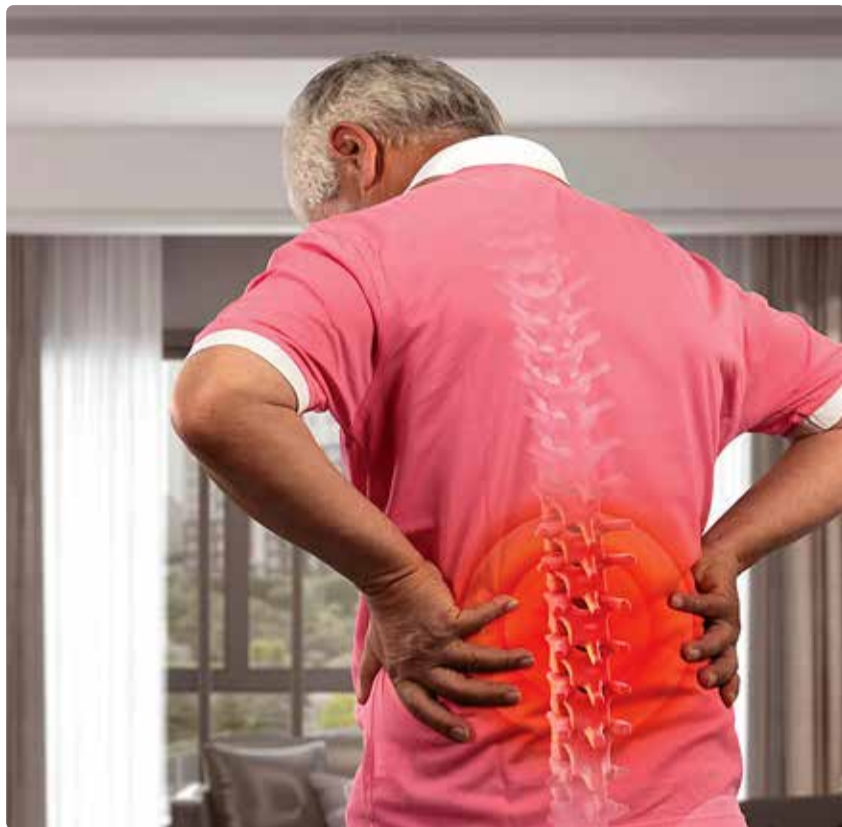
Seljavalu põhjuseid on erinevaid, aga kui valu paari päevaga ei taandu, võiks pöörduda spetsialisti poole.

Sageli välditakse sügavat ette kummardumist või kükkimist, et kingapaelu siduda. Vältides tavapäraseid liigutusmustrid kujuneb välja funktsioonilangus ja peagi avastame, et selg on jäik ja lülisamba, abaluude või puu-