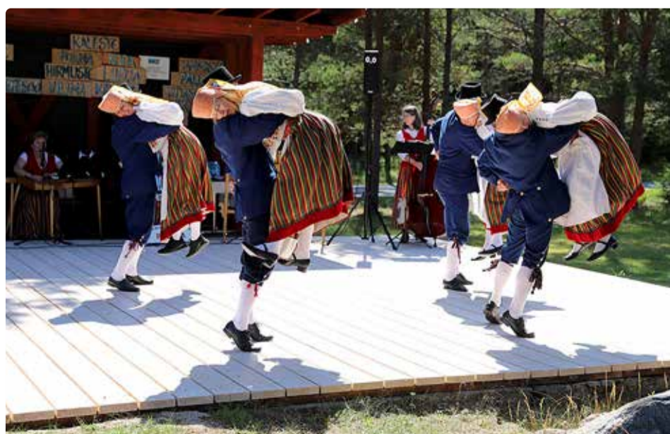
Rahvatantsurühm Valla-Alune.

Sättinud endid meie jaoks esmaklassilisse majutuspaika Suuremõisa ametikooli õpilaskodus, järgnes