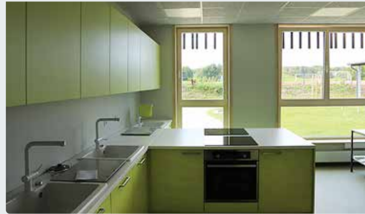
Koolipere tunneb rõõmu uutest ruumidest.