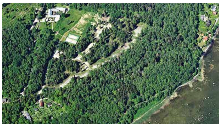
Vaade planeeringualale.

Arutelu lõpus lepitati kokku, et ühe kuu jooksul ehk kuni 23. septembrini on kõigil võimalus saada e-posti aadressile info@viimsivv.ee enda pakutud ettepanek, mil moel planeerimismenetlusega edasi minna. Ettepanekud kogutakse kokku, grupeeritakse ning pannakse elektrooniliselt kogukonna liikmetele tutvumiseks.