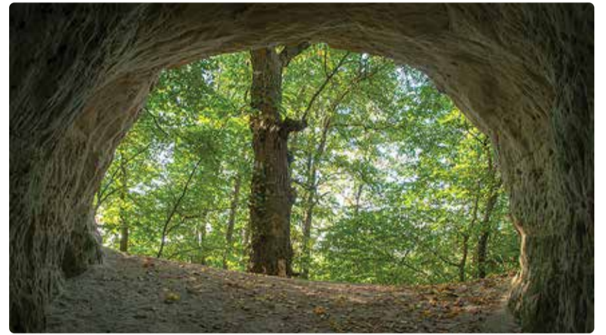
Tarkuse kogumise läbi saame mõista, kui helge ja mitmekesine on maailm.

Kuidas aga võiksime me jõuda selleni, et ühiskond saaks harmooniliselt toimida nõnda, et kellegi huvid ei oleks üle kellegi teise omadest ja samas kõik võiksid tunda elust rõõmu just sellisel määral, nagu nende süda seda igatseb?