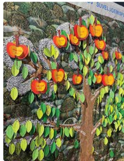
Lugemispuu on kirjasuvel loetud raamatute pealkirjad.

Kuna igaüks võis raamatuid vabalt valida, siis loeti kokku 349 erinevat teost. Raamatud, mida luges neli last, olid: Andris Feldmanis "Erik Kivisüda", Kätlin Kaldma "Halb tüdruk on jumala hea olla", Ilmar Tomusk "Kriminaalsed viineripirukad", Kattie Kirby "Lottie Brooksi katastroofilised apsakad sõpradega", Andrus Kivirähk "Oskar ja asjad" ning Martin Widmark "Karnevalimõistatus" ja "Salapärane kiri".