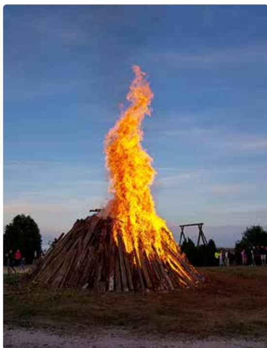
Tuld ei tohi jätta hetkekski järelevalveta.

muti tuleb lähtuda ilmastikutin- gimustest ja tuleohutusnõuetest. Lõkke tegemisel tuleb meeles pi- dada, et tuld ei jäeta hetkekski jä- relevalveta!