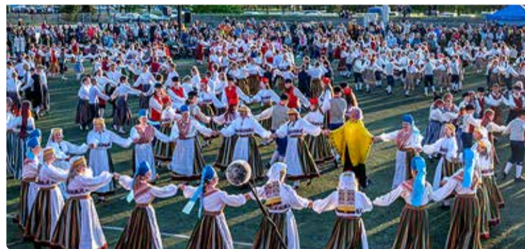
Pidu pakkus rõõmu nii osalejatele kui ka pealtvaatajatele.

RAHVAPIDU 30. mail toimunud laulu- ja tantsuõhtul astus rahva ette üle tuhande kohalikku laulja, rahvatantsija ja pillimängija.