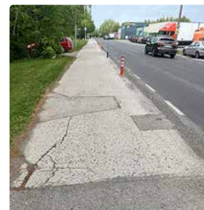
Algavad Muuli tee asfaltkatte remonditööd.

malt segatud peeneteralise killustiku ja lisandite segu, mis kantakse õhukese kihina teekattele. Uus tehnoloogia annab teekattele värsket välimust ja uue tasase ilmastikukindla kaitsekihi.