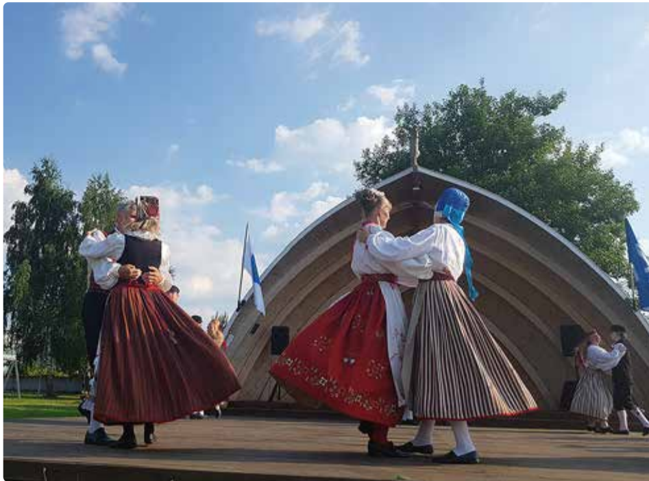
Kelvingi kõlakojas peetakse nii külakoosolekuid kui ka -pidusid.

Veel peab külavanem üheks oluliseks projektiks Reinu tee ehitust. Tööde käigus rekonstrueeriti Reinu tee lõigul Rohuneeme tee kuni Kelvingi küla, kogupikkusega ca 3,2 km ja ehitati kergliiklusteed kogupikkusega ligi 3,5 km. Rekonstrueerimistööde käigus uuendati kõik teealused tehnovõrgud ning rajati uued teekonstruktsioonid. Üheks oluliseks tööks oli kogu piirkonda teenindava sademeveekollektori rajamine kuni mereni. Kollektori viimane lõik enne merre suubumist läbib erakinnistut ning selle rajamine eeldas tihedat koostööd kinnistu omanikega. Tee avamine toimus aastal 2019 ning tänutäheks ehitajatele, vallale ja kohalikele elanikele tellis külavanem kolme-meetrise tordi.