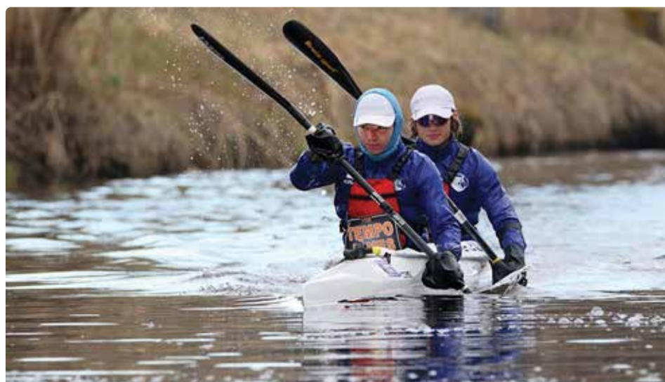
Aerutamisega saab alustada igas vanuses.

Rajaaerutamine on aastat 1936 olümpiamängudel kavas olev spor-