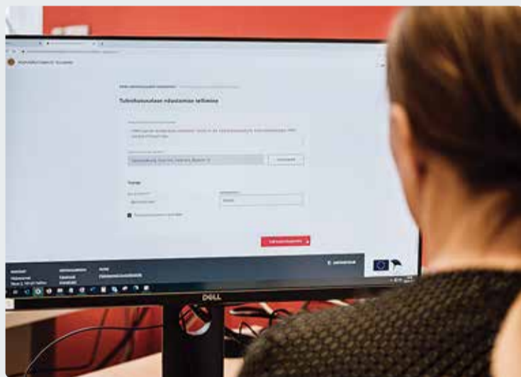
Telli kodunõustamine veebi vahendusel.

Päästeameti kommunikatsiooniosakond, kommunikatsioonijuht