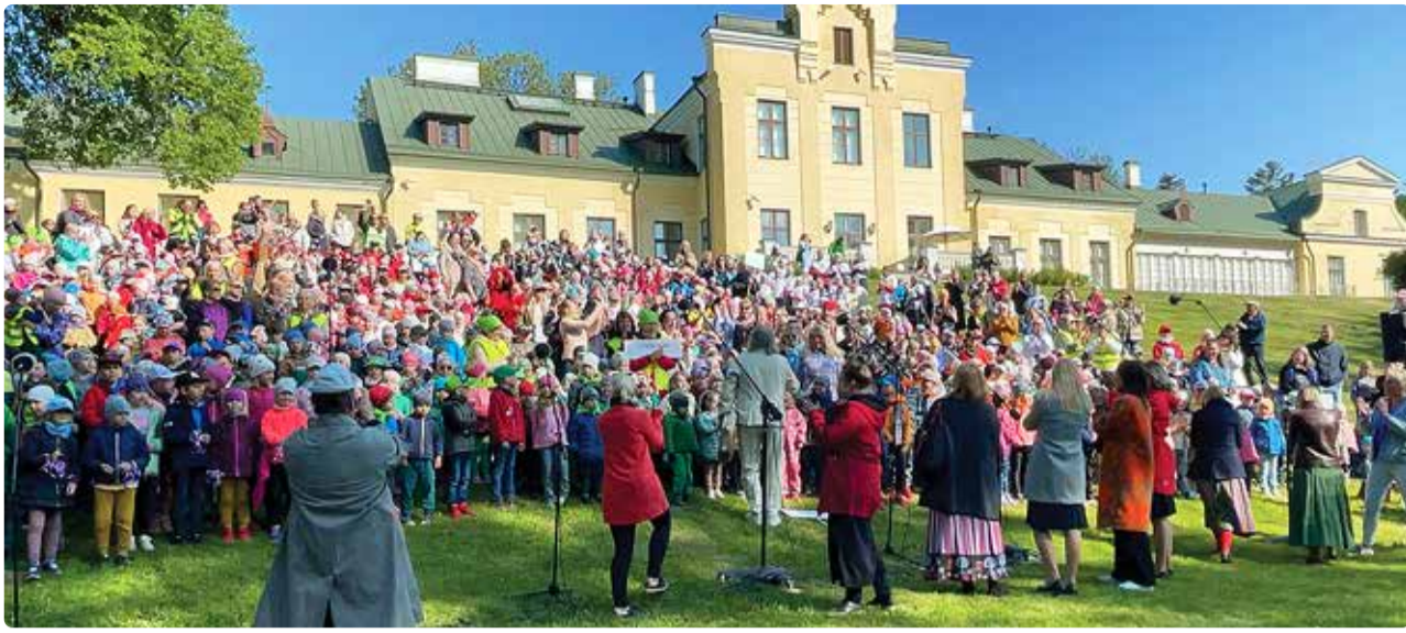
Laulupeol osales ligi tuhat last.