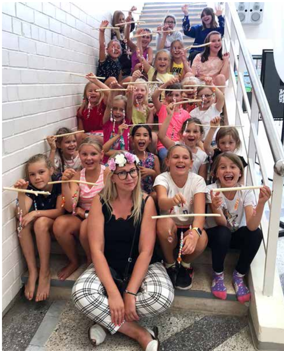
Hea tuju laagris on palju põnevaid tegevusi ja mis peamine – alati hea tuju.

Laagrisse ootame lapsi vanuses 6–10 aastat. Robootika linnalaager on meil alati väga põnevad, harivad ja sisukad. Nuputame, mängime, katsetame ja ehitame ning veedame palju aega looduses seigeldes. Lisaks on igas laagri vahetuses ka väljasõidud. Sel suvel on meid ees ootamas järgnevad külastused: ERRi telemaja, Lennusadam, SkyLab teaduskeskus, bastionikäigud, Eesti Raudtee, politsei- ja piirivalveamet, Balbiino jäätisemuseum ja filmimuseum. Eelnev robootikaalane kogemus pole vajalik. Kui laagris osaleb ühest perest kaks last, rakendub soodustus -10%.