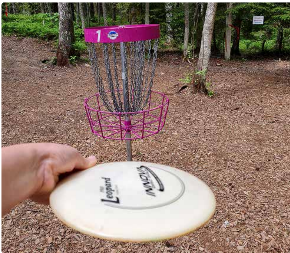
Viimsis asub 18 rajaga kettagolfi park Lubja külas.

Kettagolfi mängimine pakub mitmeid eeliseid. Esiteks on see suurepärase viisi veeta aega vabas õhus ja nautida loodust. Disc golfi radadel on sageli kaunid maastikud ja vaated, mis muudavad mängu nauditavaks. Lisaks on kettagolf väga hea võimalus parandada oma füüsilist aktiivsust. Mängimine hõlmab endas jalutamist, viskamist ja tasakaaluharjutusi, mis parandavad üldist tervist ja kehalist vormi.