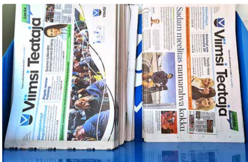
Viimsi Teataja kojukannet teostab AS Eesti Post.

Käesoleva aasta alguses andis OÜ Express Post teada, et pärast 26. maid nemad enam Viimsi Teatajale lehekande teenust ei osuta. See tähendas, et infolehte tuli leida riigihanke korras uus teenusepakkuja. 17. mail lõppenu riigihanke osales kolm pakkujat: Target Master OÜ, AS Eesti Post ja Hepex OÜ. Hanke võitis AS Eesti Post, kelle pakkumine oli neist odavam ehk 72 488,64 eurot (+ km). Hea uudis on ka see, et võrreldes varasema hankega on kojukande teenus märkimisvää-