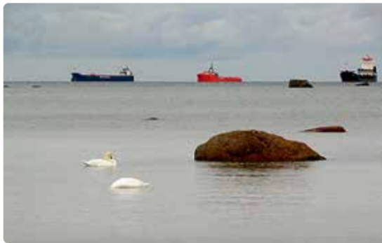
Vaade Kelvingi rannalt.