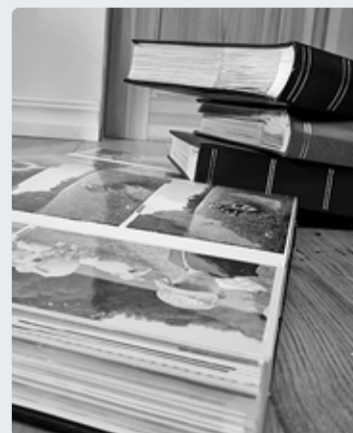
Aitame Meremuuseumil mälestusi koguda.

■ Seoses Naissaarele rajatava Eesti Meremuuseumi uue püsiekspositsiooni ja külastuskeskusega Nargen Nord kutsub muuseum inimesi üles edastama infot Naissaare ajaloo erinevate etappide kohta. Pakkuda võib fotosid, esemeid, joonistusi, skeeme, jooniseid, projekte, kaarte, kirjeldusi, mälestusi ja muud infot. Palume asjad edastada meremuuseumile 1. augustiks 2023.