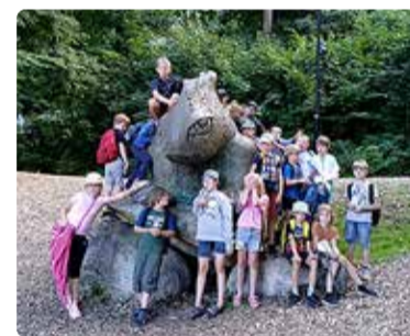
Laagrilapsed Karulaugu terviserajal.

Laagrisse ootame lapsi vanuses 6–10 aastat. Iga laagripäev on huvitav ja sisukas, pakkudes palju põnevust, väljasõite, avastamisrõõmu, mänge, nuputamist ja seiklusi ning lõbusat ajaveetmist. Põnevaid tegevusi jagub igale maitsele! Kui laagris osaleb ühest perest kaks last, rakendub soodustus -10%.