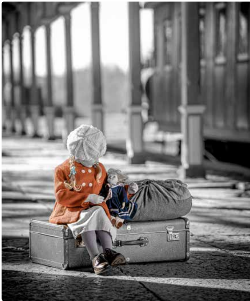
14. juunil 1941 küüditasid Nõukogude Liidu okupatsioonivõimud üle 10 000 eesti-maalase, kellest 7000 olid naised, lapsed, vanurid.

Tänavu võtab mälestusüritus fookusesse küüditatud lapsed. 1941. aastal viidi kodudest jõuga ära terved perekonnad koos lastega ning kui lastel õnnestuski kodumaale jääda, ei kohtunud paljud neist enam kunagi oma vanematega. "Ukrainas küüditatakse praegu tuhandeid või isegi kümneid