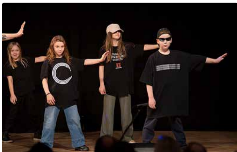
Street Dance linnalaagris on iga päev lahe muusika ja tants ning põnevad ja aktiivsed tegevused.