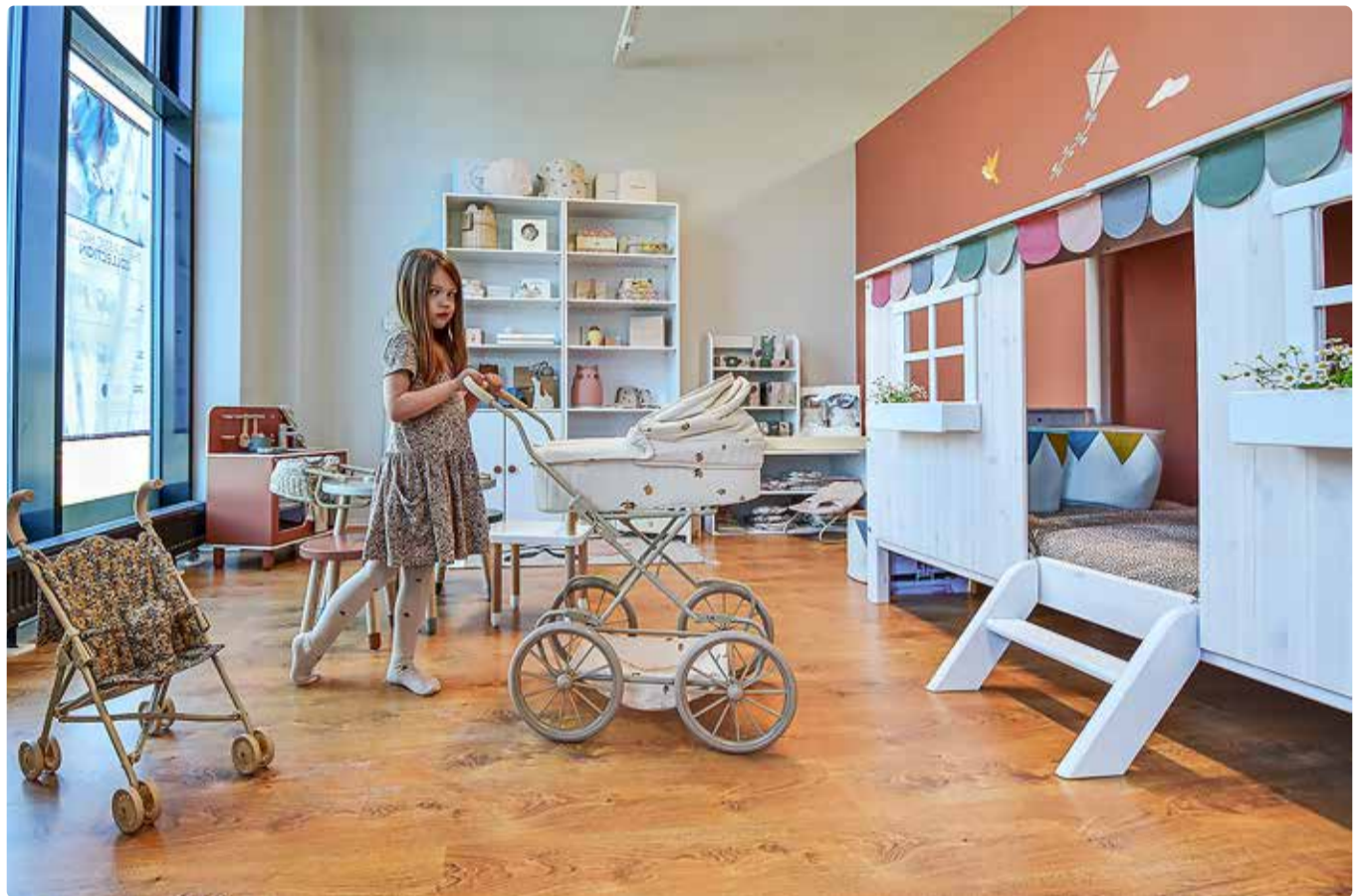
Pood Viimsi Äritares on nagu väikene mängumaa.