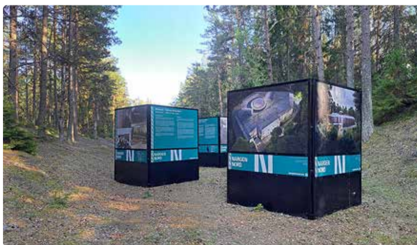
Näitus jääb avatuks septembri keskpaigani.

Naissaarel Lõunakülas, Taani kuni aias, Patarei 10A juures ning sadamas ja mandril Lennusadamades paiknev näitus tutvustab saare põnevat ja