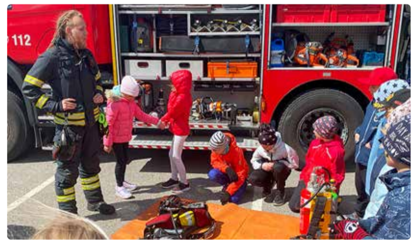
Põnev päästeauto varustus.