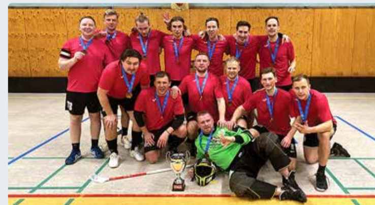
Saalihokimeeskond Viimsi Kepp.