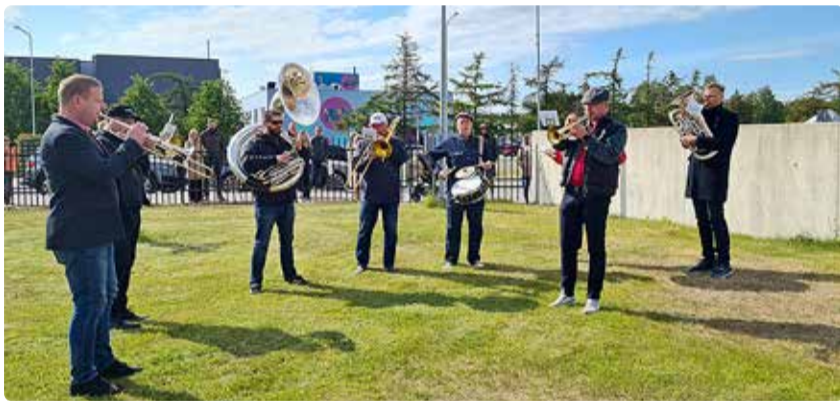
Rongkäigus jagasid marsirütme sõjaväeorkestri pillimehed.

MLA Viimsi Lasteaiad 2022/23 õppeaasta teemaks oli "Koo on tore" ning ka seda teemat prooviti laulude valimisel arvesse võtta. Välja valitud laule harjutasid lapsed kogu õppeaasta vältel. Ühel varakevadisel päeval said Karulaugu majas peaprooviks kokku valla lasteaedade koolieelikud ning üheskoos löödi laulud kõlama.