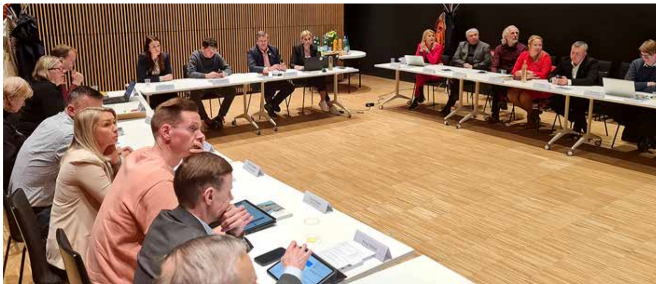
Vallavalikogu istung.

Eelmisel aastal riigikogus vastu võetud seadus näeb ette maaomanikele maamaksu tõusu vastu kaitsemeetmed. Maamaksu liiga järsu tõusu väitmiseks on kehtestatud kümneprotsendine piirmäär. See tähendab, et maamaks ei saa eelmise aastaga võrreldes suurendada rohkem kui kümme protsenti aastas. Lisaks säilivad ka kõik senised maksusoodustused ja -vabastused, sealhulgas koduomanike ja represseeritu maksuvabastus. Jätkuvalt on koduomanikud Viimsi vallas