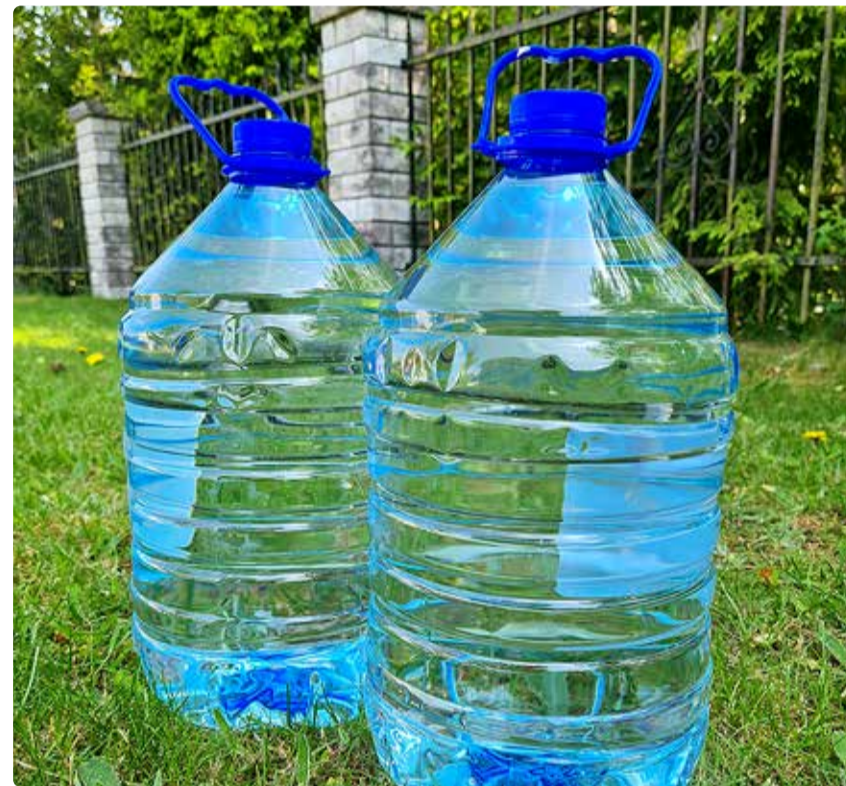
Oluline on, et ka kodus majapidamises oleks varutud joogivett.

Lisaks tuleks üle vaadata, et kinnistu reoveekanalisatsioonisüsteemi ei suunataks drenaaži ega ka sademe-