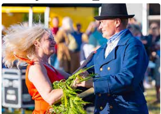
Jaanipidu möödub ikka tantsides.

Värvavad avatakse kõikidele külastajatele kell 19, juba kell 20 süttib