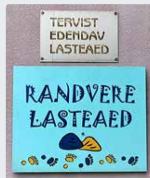
Lasteaiakohatasud võivad muutuda.

6. juunil kogunes vallavolikogu noorsoo- ja hariduskomisjon, kelle kohtumise päevakorra üks punktides oli Viimsi lasteaedade ja -hoidude kohatasude tõstmine.