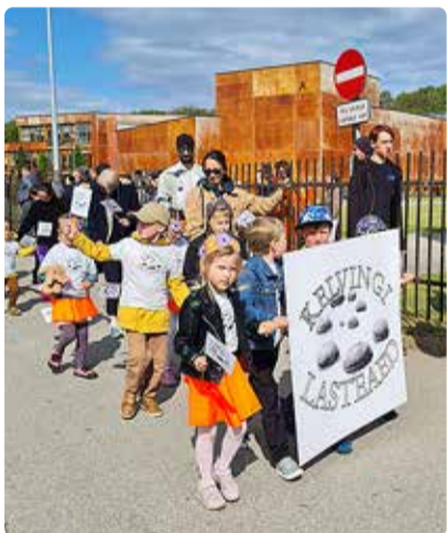
Esmakordselt osalesid peol ka valla eralasteaiad.

Juba peaproovis oli tunda, kui eriline see pidu saab olema, sest laste silmad särasid ning laulud olid kõigil selged.