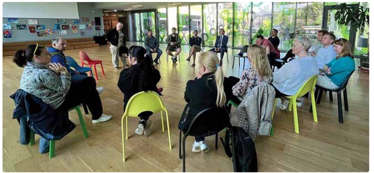
Randvere koolis toimus lapsevanematele õppuse kohta infotund.