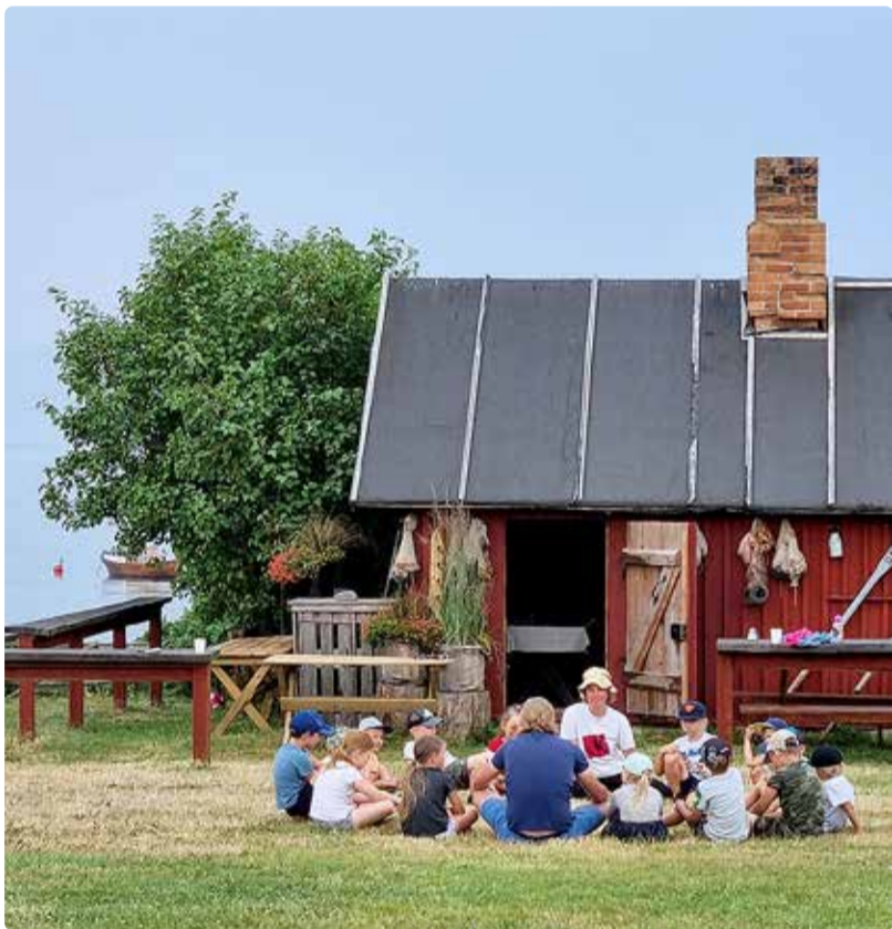
Päevalaagrisse ootame lapsi vanuses 5–10.

Jekaterina Alipova Viimsi vabaõhumuuseumi sündmuste koordinaator